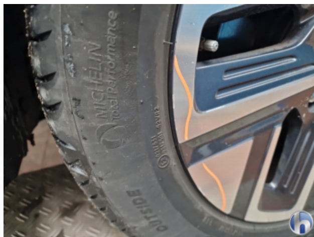
4. Felge Vorne - Rechts Kratzer - Smart Repair