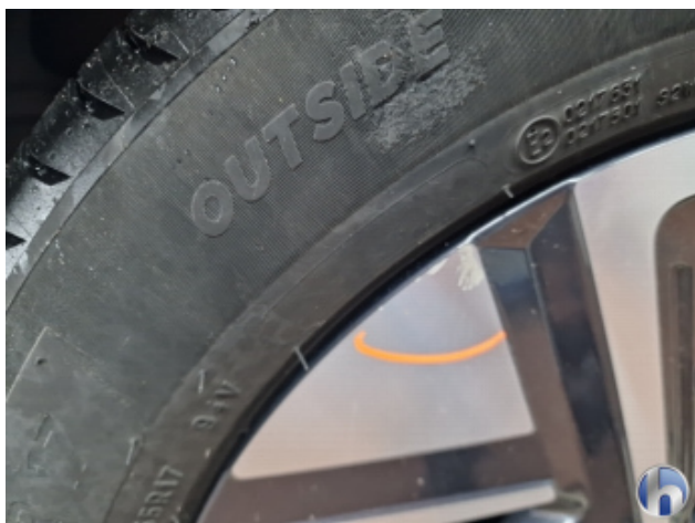
6. Felge Hinten - Rechts Beschädigt - Smart Repair