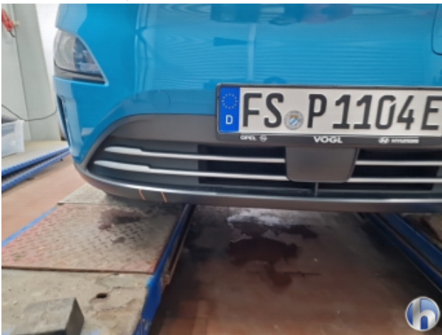
3. Stoßfänger Vorne Kratzer - Smart Repair