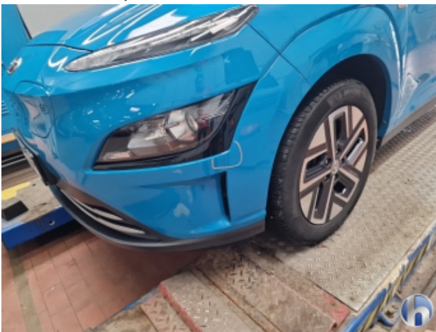
3. Stoßfänger Vorne Kratzer - Smart Repair