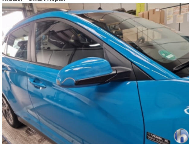
5. Außenspiegel Gehäuse - Rechts Kratzer - Smart Repair