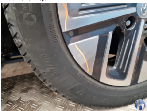
4. Felge Vorne - Rechts Kratzer - Smart Repair