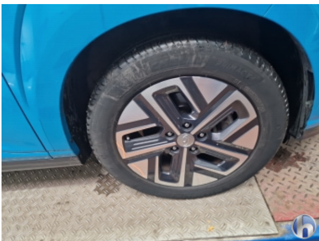
4. Felge Vorne - Rechts Kratzer - Smart Repair