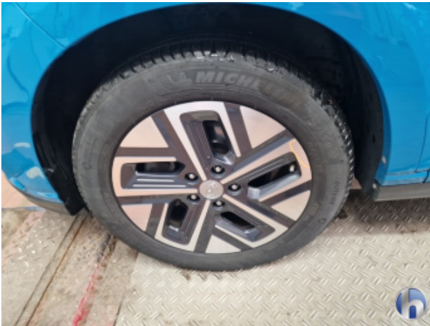
2. Felge Vorne - Links Kratzer - Smart Repair