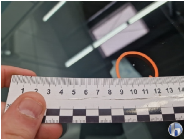
8. Windschutzscheibe Gebrauchsspuren - Ohne Reparatur