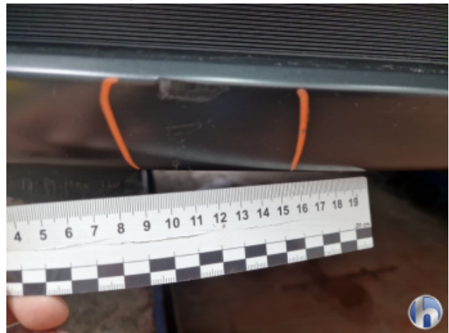
3. Stoßfänger Vorne Kratzer - Smart Repair