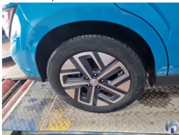
6. Felge Hinten - Rechts Beschädigt - Smart Repair