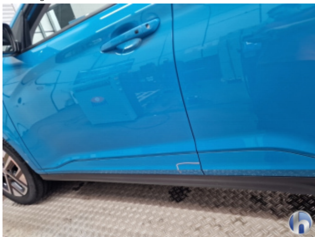
1. Tür Vorne - Links Beschädigt - Smart Repair