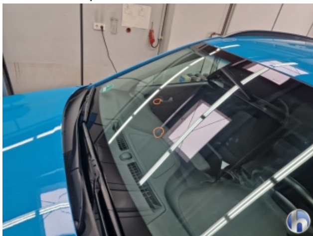
8. Windschutzscheibe Gebrauchsspuren - Ohne Reparatur