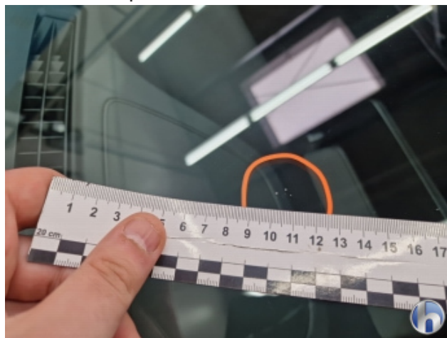
8. Windschutzscheibe Gebrauchsspuren - Ohne Reparatur