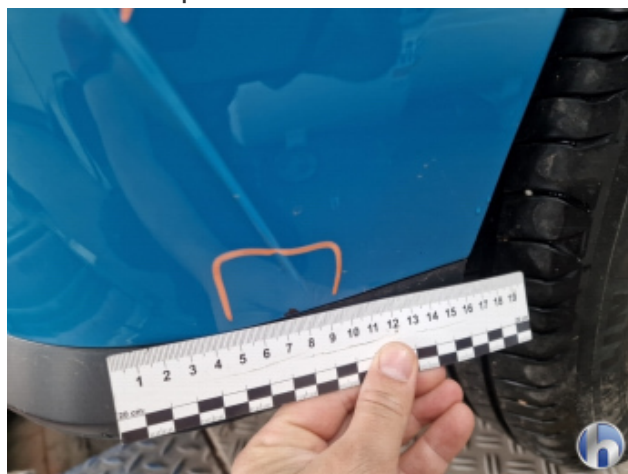
7. Stoßfänger Hinten Kratzer - Smart Repair