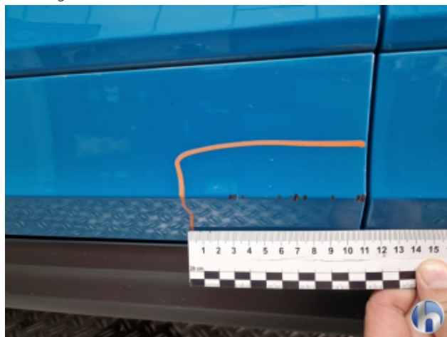
1. Tür Vorne - Links Beschädigt - Smart Repair