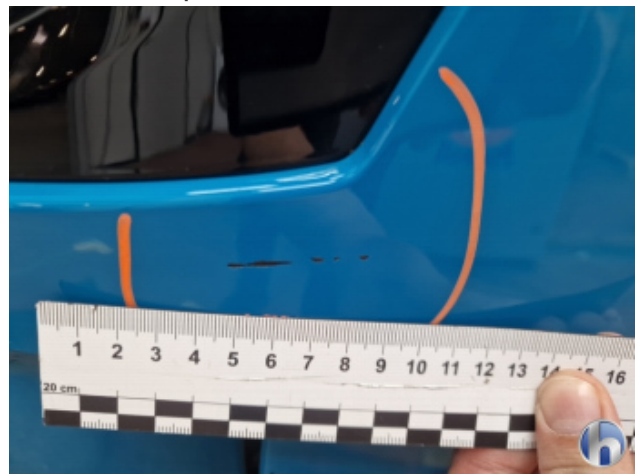
3. Stoßfänger Vorne Kratzer - Smart Repair