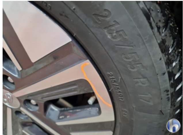
2. Felge Vorne - Links Kratzer - Smart Repair