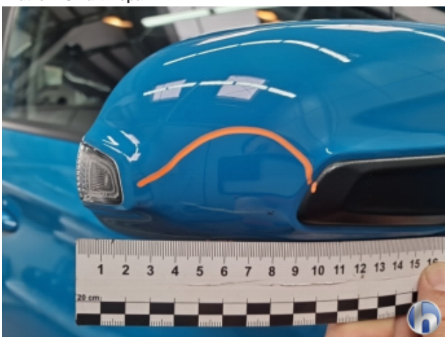
5. Außenspiegel Gehäuse - Rechts Kratzer - Smart Repair