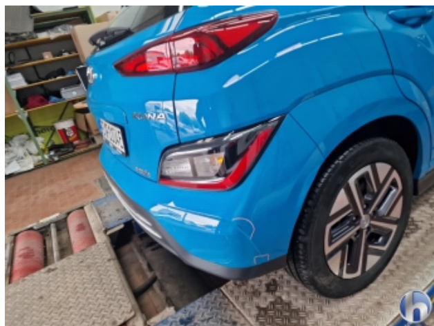
7. Stoßfänger Hinten Kratzer - Smart Repair