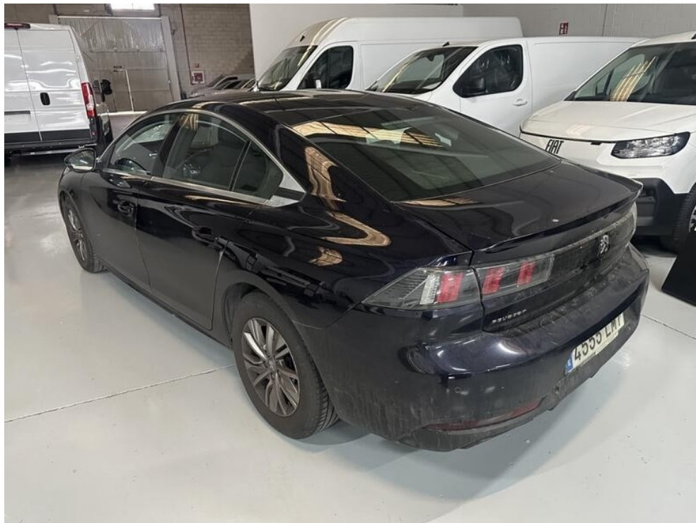
5. Fotos Exteriores