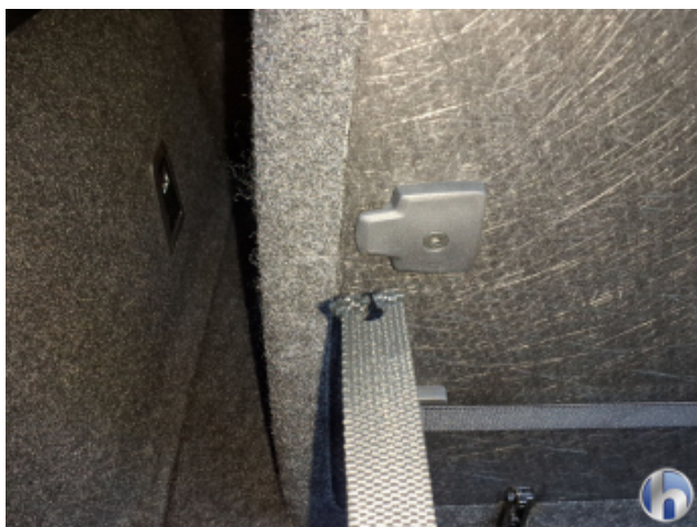
3. Befestigung Beschädigt - Erneuern