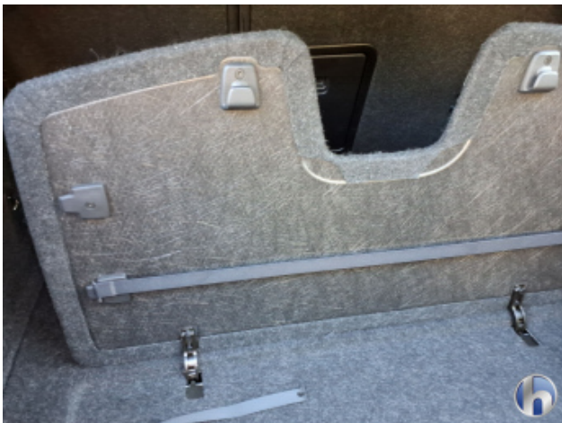
3. Befestigung Beschädigt - Erneuern