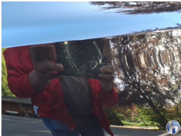
2. Seitenwand - Hinten - Rechts Oberflächenkratzer - Aufbereiten / Polieren