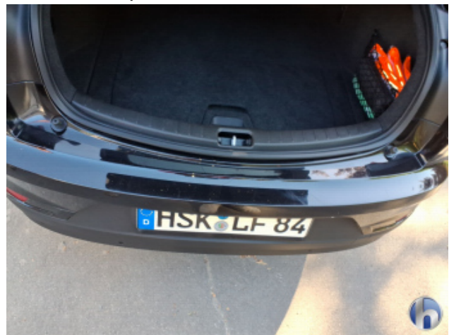
1. Stoßfänger Hinten Kratzer - Smart Repair