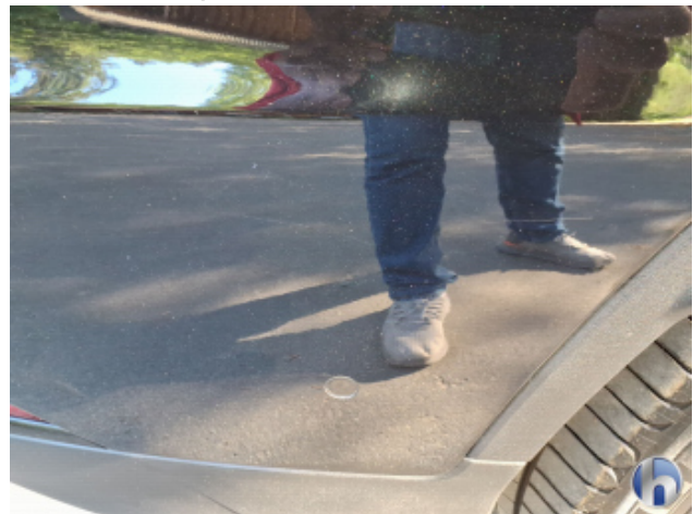
2. Seitenwand - Hinten - Rechts Oberflächenkratzer - Aufbereiten / Polieren