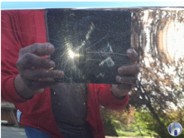
2. Seitenwand - Hinten - Rechts Oberflächenkratzer - Aufbereiten / Polieren