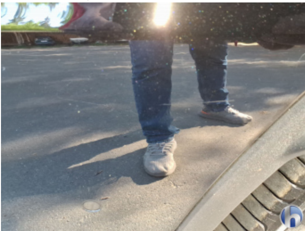
2. Seitenwand - Hinten - Rechts Oberflächenkratzer - Aufbereiten / Polieren