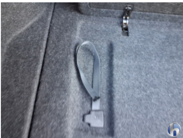
3. Befestigung Beschädigt - Erneuern