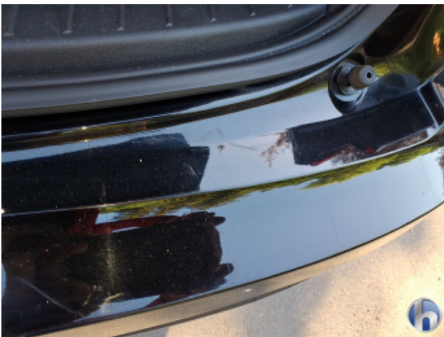
1. Stoßfänger Hinten Kratzer - Smart Repair