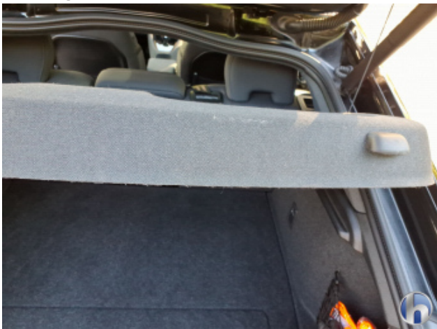
3. Befestigung Beschädigt - Erneuern