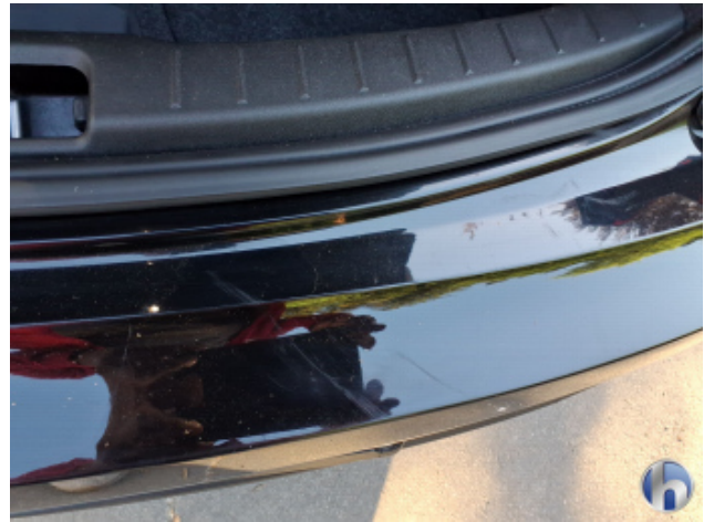
1. Stoßfänger Hinten Kratzer - Smart Repair