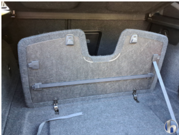
3. Befestigung Beschädigt - Erneuern