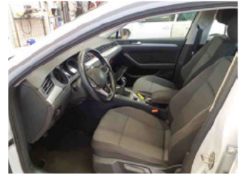
Innenraum - vorne