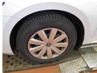
Räder - Rad montiert vorne links