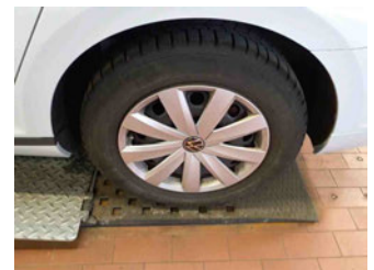
Räder - Rad montiert hinten links