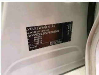
Fahrzeug - Typenschild/Fahrgestellnummer