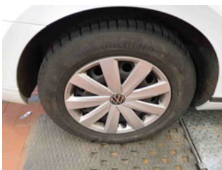
Räder - Rad montiert hinten rechts