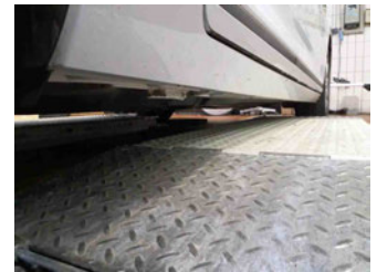
Seitenansicht - Schweller rechts