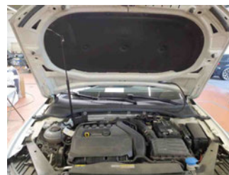
Fahrzeug - Motorraum offen