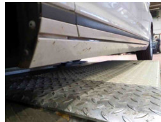
Seitenansicht - Schweller links