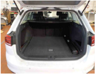
Innenraum - Kofferraum