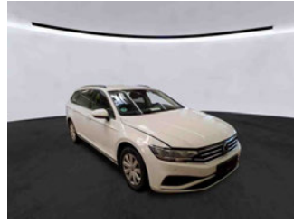
Fahrzeugansicht - diagonal vorne rechts