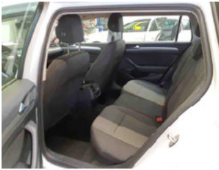
Innenraum - hinten