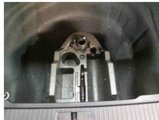
Equipment - Bordwerkzeug