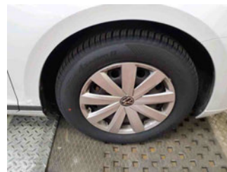
Räder - Rad montiert vorne rechts