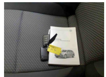
Equipment - Boardmappe/ Securitybag