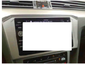
Innenraum - Navigationsgerät/Radio