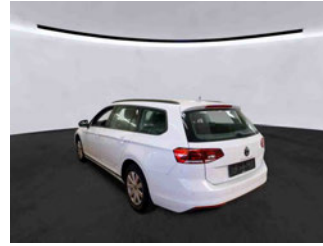
Fahrzeugansicht - diagonal hinten links