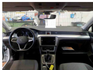
Innenraum - Mittelkonsole