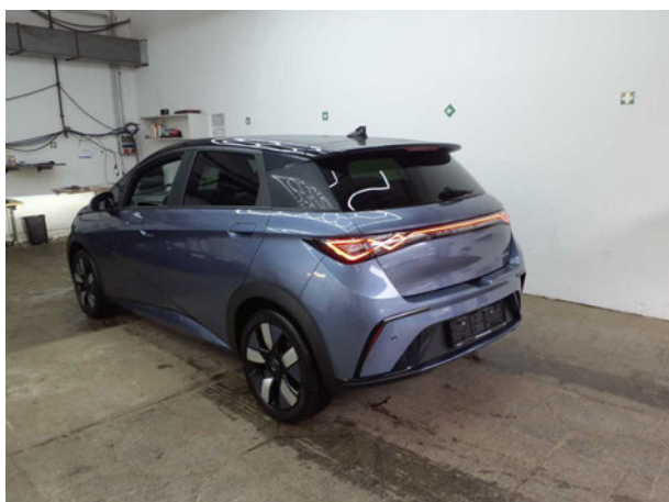
Abbildung 3: Schräg hinten