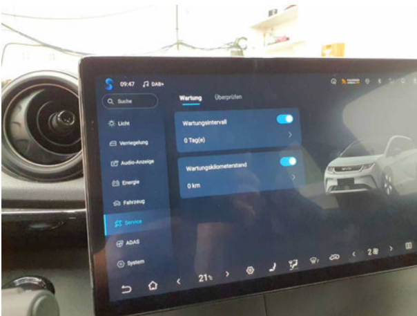
Beschädigung #2: Sonstiges: Inspektion/Wartung - fällig - durchführen