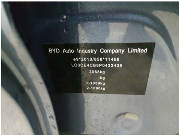
Abbildung 7: FIN