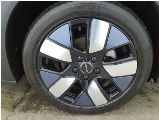
Abbildung 15: Montierte Bereifung