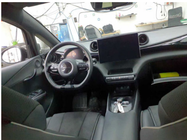
Abbildung 11: Instrumententafel