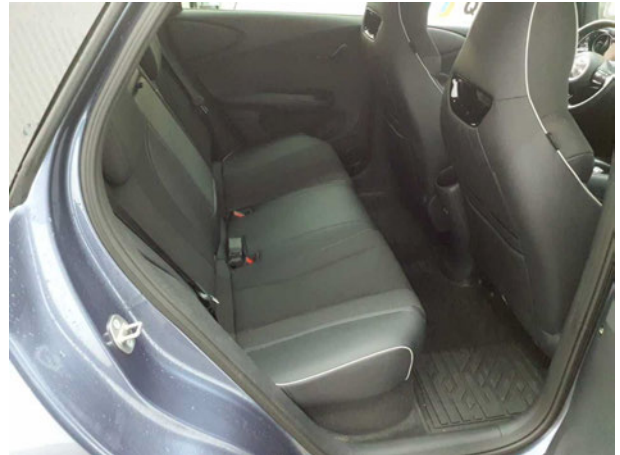
Abbildung 14: Innenraum hinten