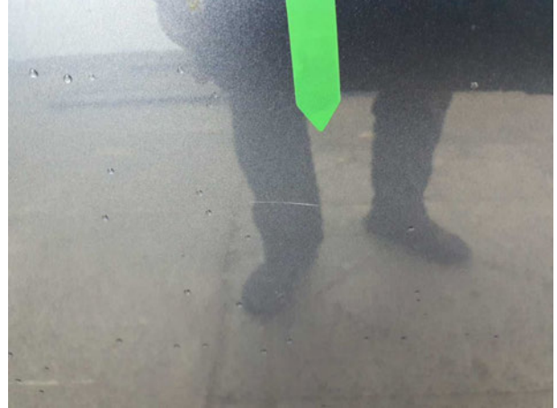
Beschädigung #1: Tür hinten links: Tür - Kratzer - auslegen / polieren