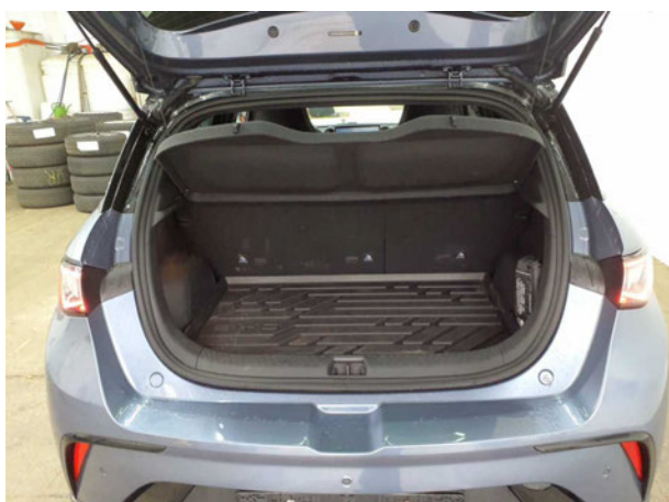
Abbildung 5: Laderaum