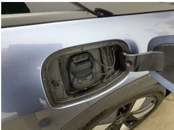
Abbildung 17: Ladebuchse/Tankstutzen