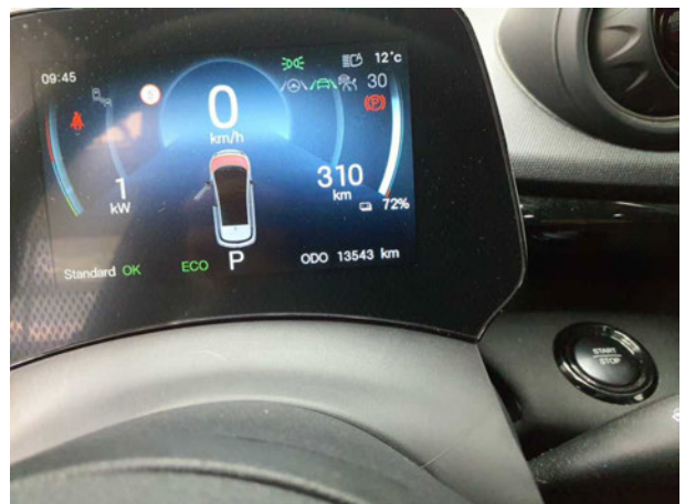
Abbildung 10: Laufleistung