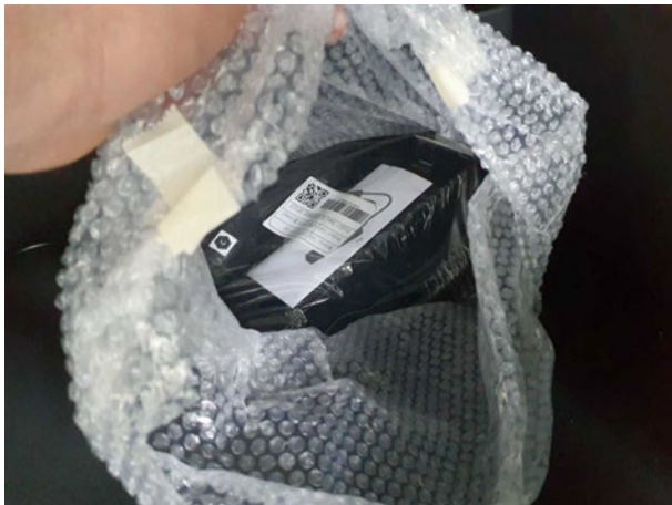
Abbildung 21: Sonstiges