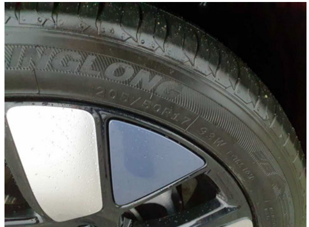
Abbildung 16: Montierte Bereifung