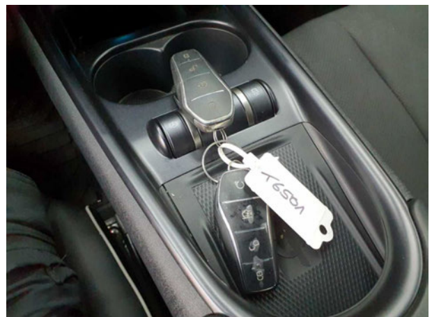
Abbildung 18: Sonstiges