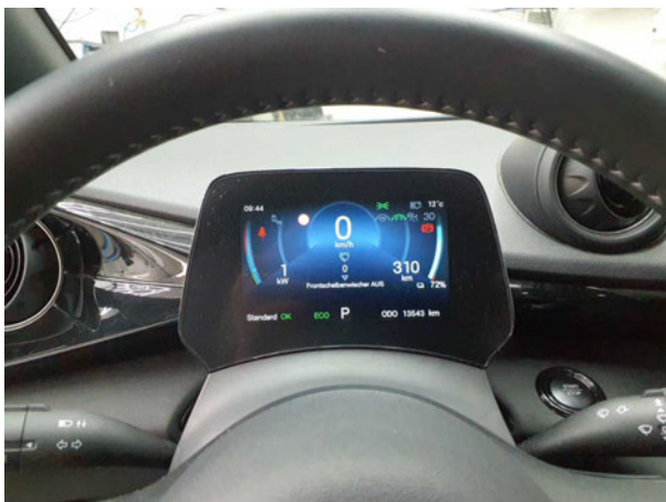
Abbildung 9: Kombiinstrument