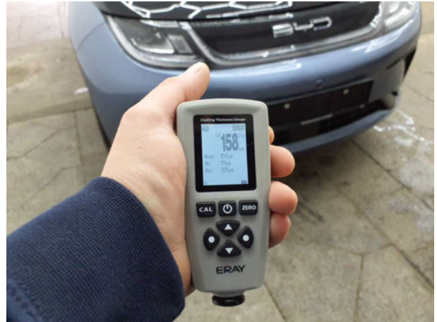
Abbildung 20: Sonstiges