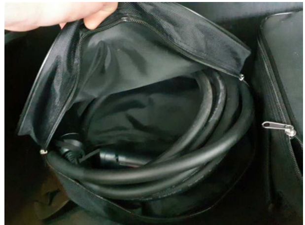
Abbildung 22: Sonstiges