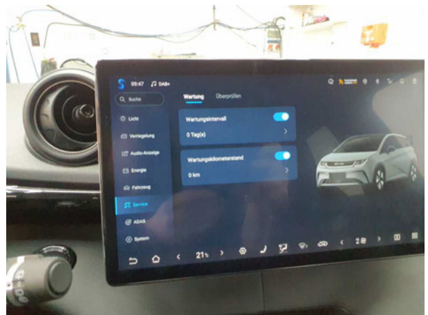
Abbildung 12: Instrumententafel