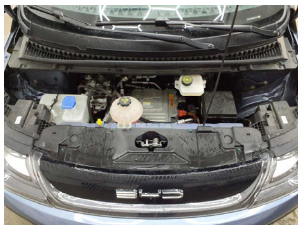
Abbildung 6: Motorraum