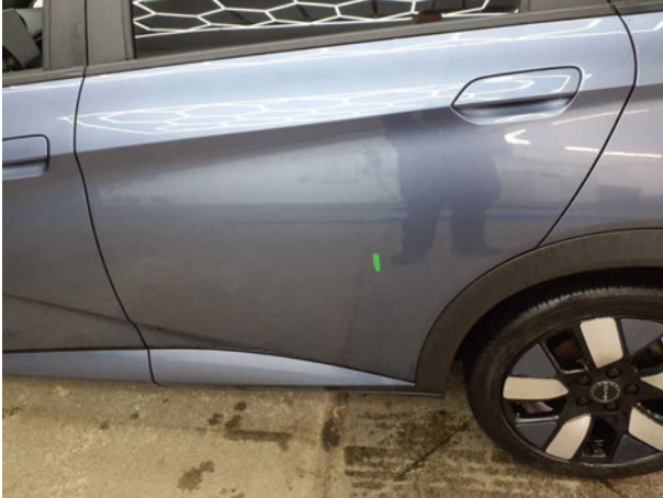
Beschädigung #1: Tür hinten links: Tür - Kratzer - auslegen / polieren