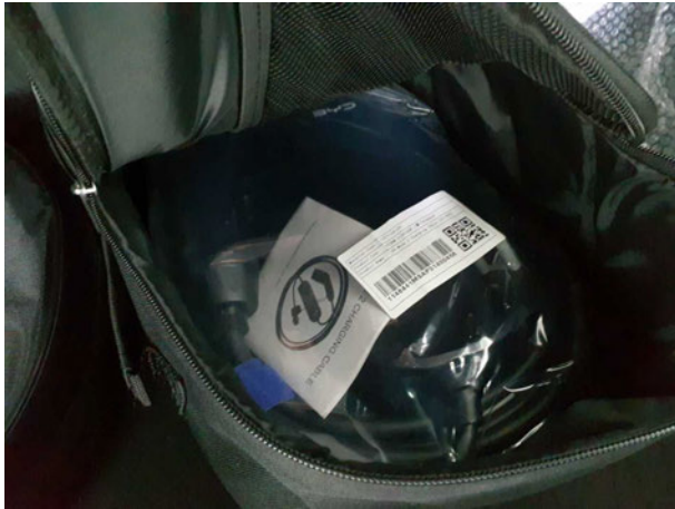
Abbildung 19: Sonstiges