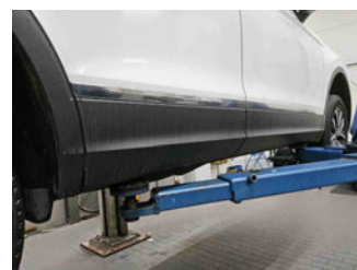
Seitenansicht - Schweller rechts