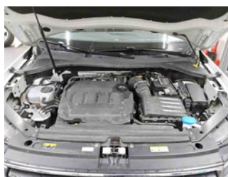
Fahrzeug - Motorraum offen