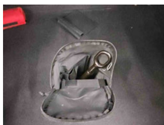
Equipment - Bordwerkzeug