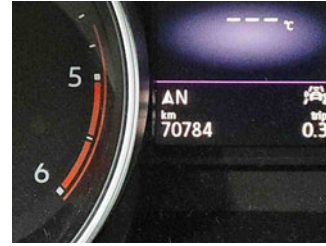
Innenraum - Cockpit mit Laufleistung