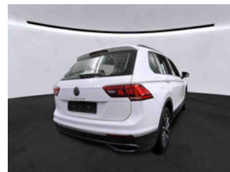
Fahrzeugansicht - diagonal hinten rechts