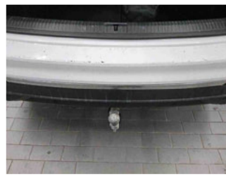
Equipment - Anhängerkupplung