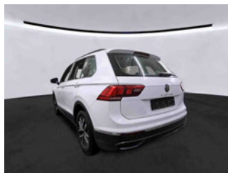
Fahrzeugansicht - diagonal hinten links