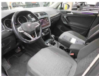
Innenraum - vorne