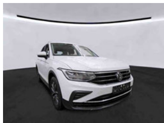
Fahrzeugansicht - diagonal vorne rechts