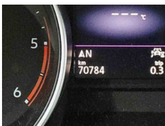
Innenraum - Cockpit mit Laufleistung