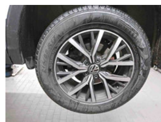
Räder - Rad montiert hinten links