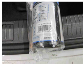
Räder - Haltbarkeitsdatum Tirefit