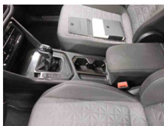
Innenraum - Mittelkonsole