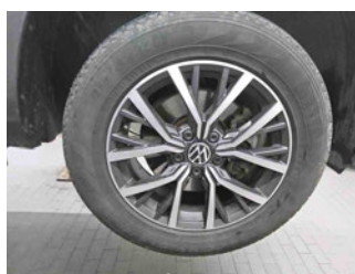
Räder - Rad montiert vorne rechts