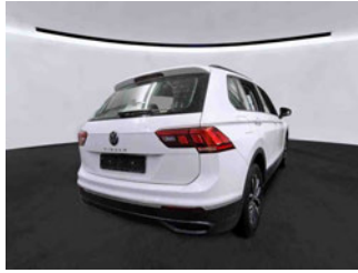
Fahrzeugansicht - diagonal hinten rechts