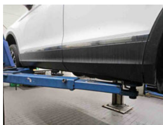
Seitenansicht - Schweller links