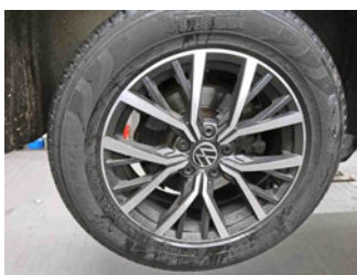
Räder - Rad montiert hinten rechts