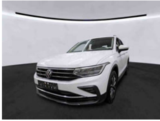
Fahrzeugansicht - diagonal vorne links

Auftrags-Nr: 1002194133 Besichtigt am: 19.11.2025 15:53 Berichts-Nr: 9482274 FIN: WVGZZZ5N6PW505596