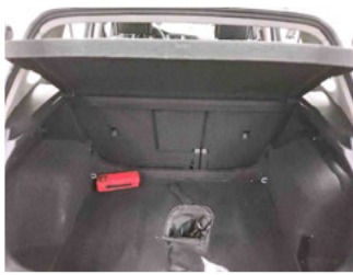
Innenraum - Kofferraum