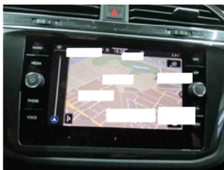
Innenraum - Navigationsgerät/Radio