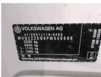
Fahrzeug - Typenschild/Fahrgestellnummer