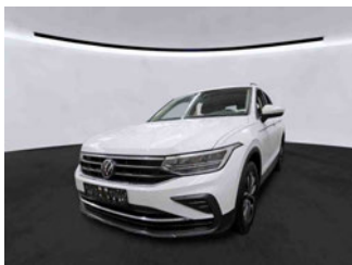
Fahrzeugansicht - diagonal vorne links