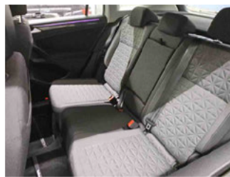
Innenraum - hinten