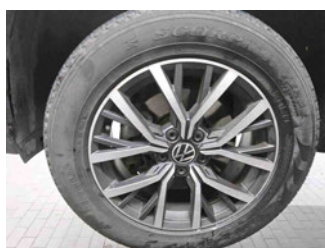
Räder - Rad montiert vorne links