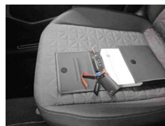
Equipment - Boardmappe/ Securitybag