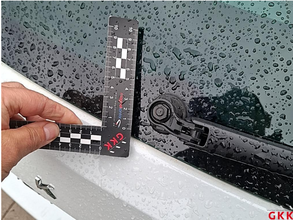
Bild 13. Heckwischer, Abdeckung, fehlt, ersetzen