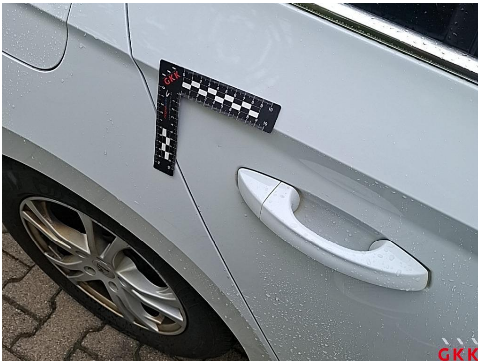
Bild 14. Tür hinten rechts, bis 3 Dellen / Bauteil, Smartrepair