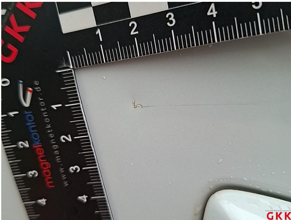
Bild 16. Tür hinten rechts, bis 3 Dellen / Bauteil, Smartrepair