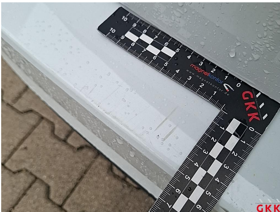
Bild 12. Stoßfänger hinten, Verkleidung -lackiert-, verkratzt, auslegen, schleifen, polieren