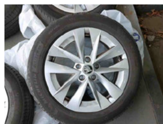
Räder - Rad beiliegend #2