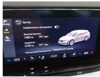
Fahrzeug - Serviceunterlagen / Wartungsnachweis