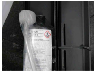
Räder - Haltbarkeitsdatum Tirefit