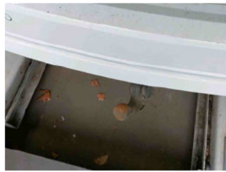
Equipment - Anhängerkupplung