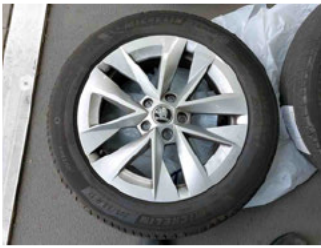
Räder - Rad beiliegend #4