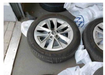
Räder - Rad beiliegend #3