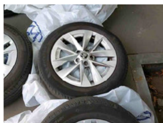
Räder - Rad beiliegend #1