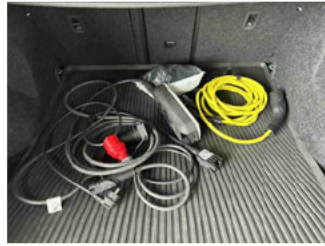
Equipment - Ladeequipment