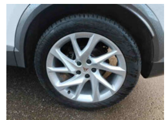
Räder - Rad montiert hinten links