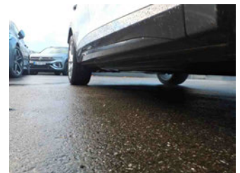
Seitenansicht - Schweller rechts