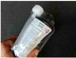
Räder - Haltbarkeitsdatum Tirefit