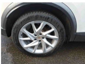
Räder - Rad montiert hinten rechts