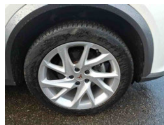
Räder - Rad montiert vorne rechts