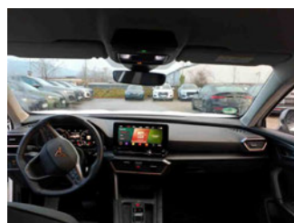
Innenraum - Mittelkonsole