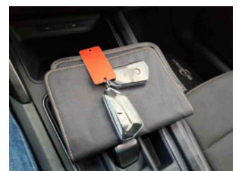
Equipment - Boardmappe/ Securitybag