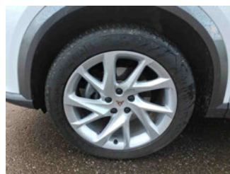
Räder - Rad montiert vorne links