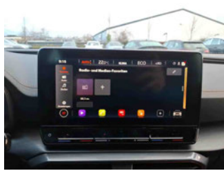
Innenraum - Navigationsgerät/Radio