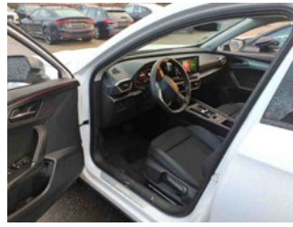
Innenraum - vorne