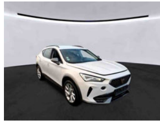
Fahrzeugansicht - diagonal vorne rechts