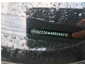
Fahrzeug - Typenschild/Fahrgestellnummer