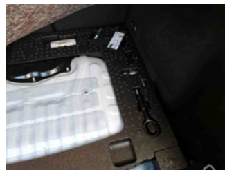
Equipment - Bordwerkzeug