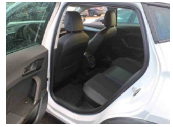
Innenraum - hinten