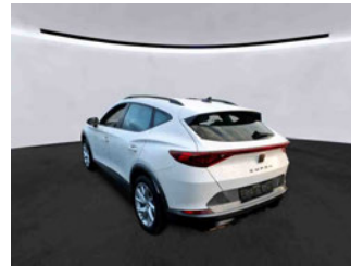
Fahrzeugansicht - diagonal hinten links