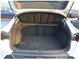
Innenraum - Kofferraum