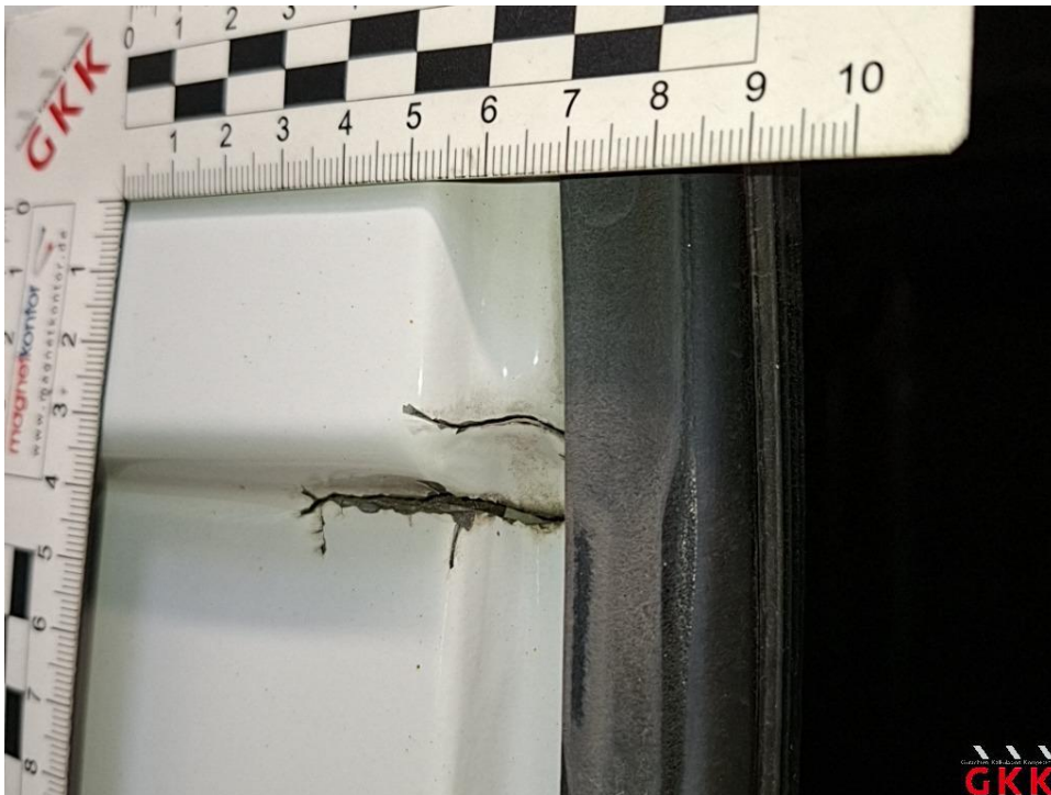
Bild 28 Hecktür links, beschädigt, ersetzen