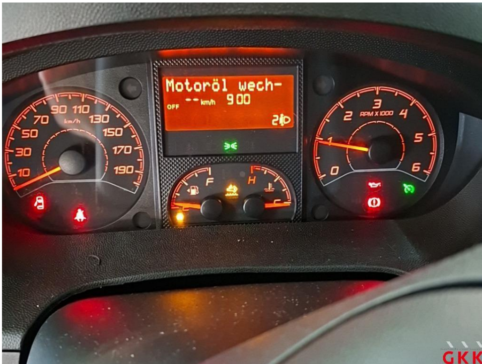
Bild 34 Ölservice, Transporter, fällig, durchführen