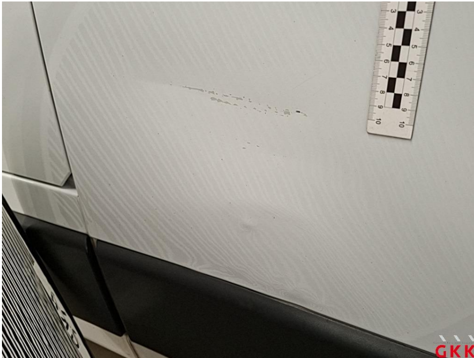
Bild 19 Seitenwand links, beschädigt, instand setzen - lackieren