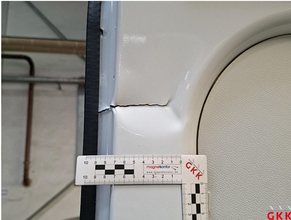
Bild 27 Hecktür links, beschädigt, ersetzen