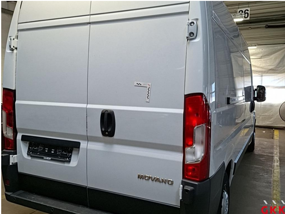
Bild 23 Hecktür rechts, beschädigt, instand setzen - lackieren