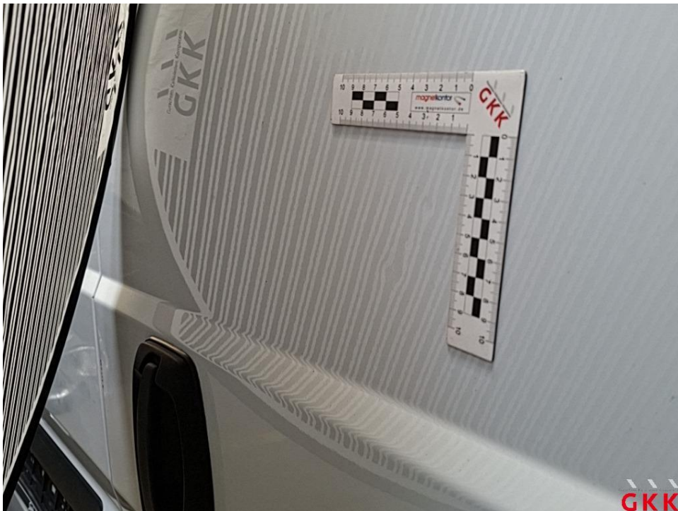
Bild 24 Hecktür rechts, beschädigt, instand setzen - lackieren