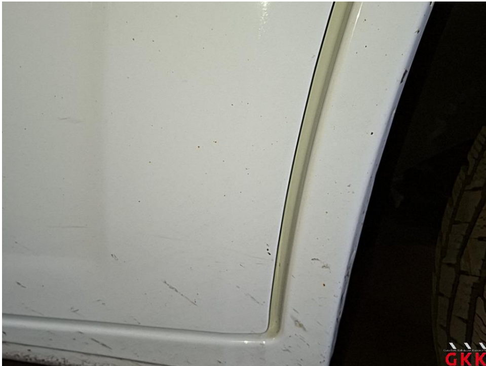
Bild 17 Fahrzeug, außen, Lackierung verwittert / matt, aufbereiten