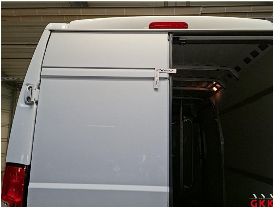
Bild 26 Hecktür links, beschädigt, ersetzen