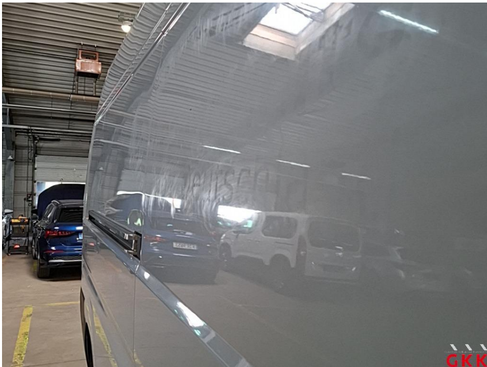
Bild 16 Fahrzeug, außen, Lackierung verwittert / matt, aufbereiten