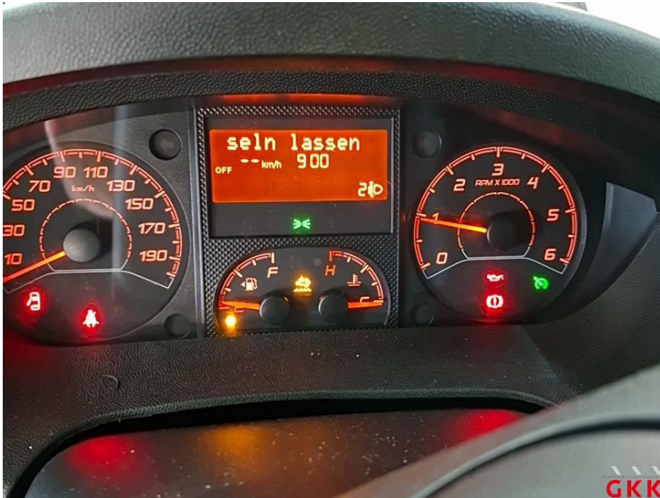
Bild 35 Ölservice, Transporter, fällig, durchführen