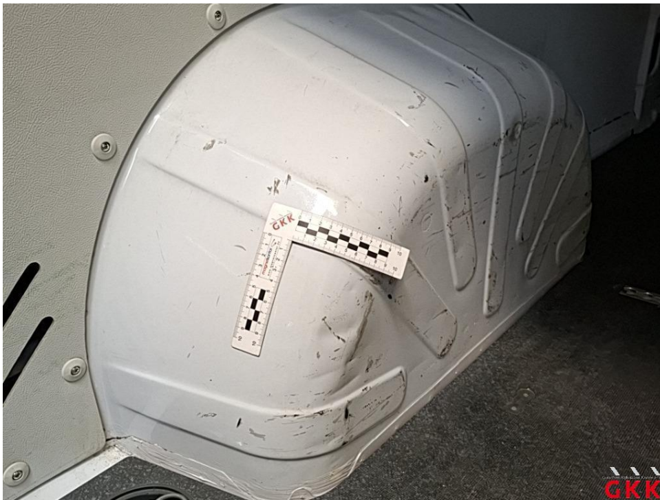
Bild 30 Radhaus hinten links und rechts, eingedellt und verkratzt (I), Smartrepair