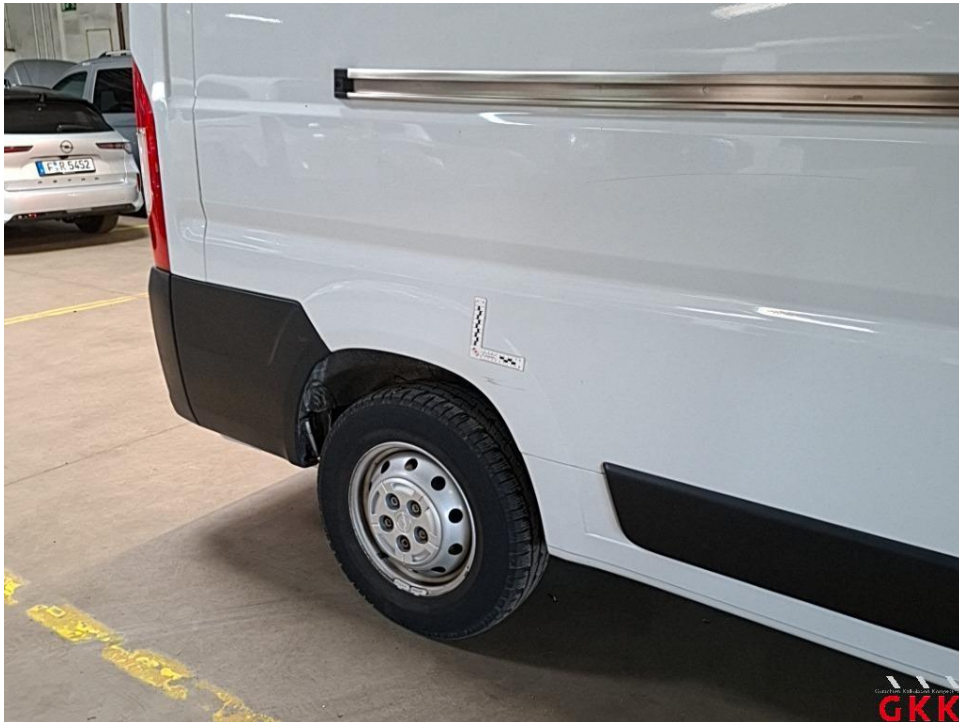
Bild 21 Seitenwand rechts, beschädigt, instand setzen - lackieren