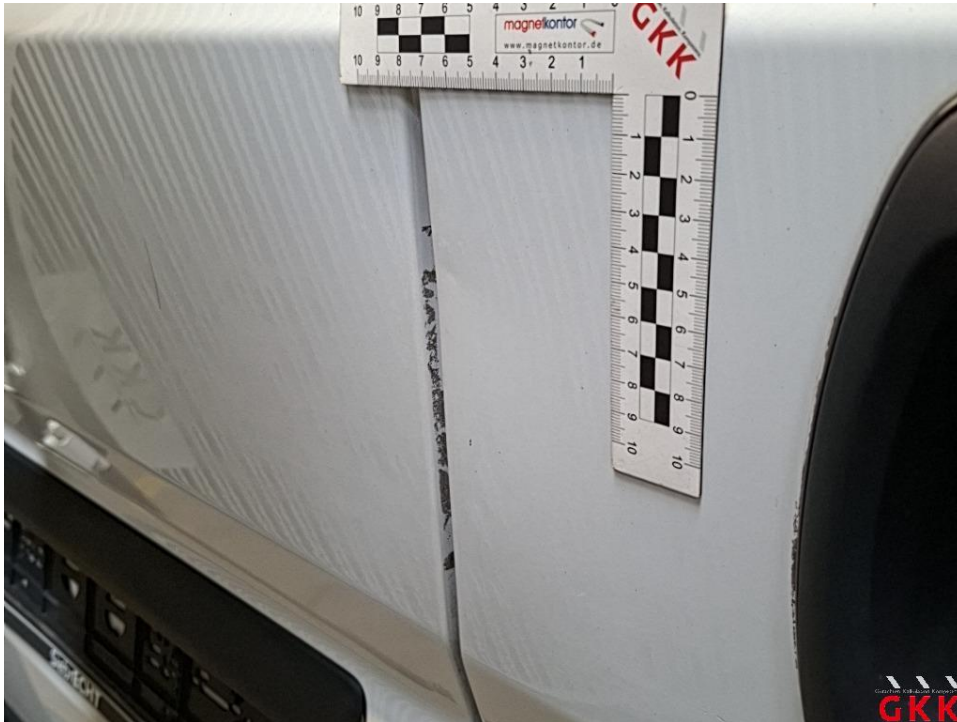
Bild 25 Hecktür rechts, beschädigt, instand setzen - lackieren