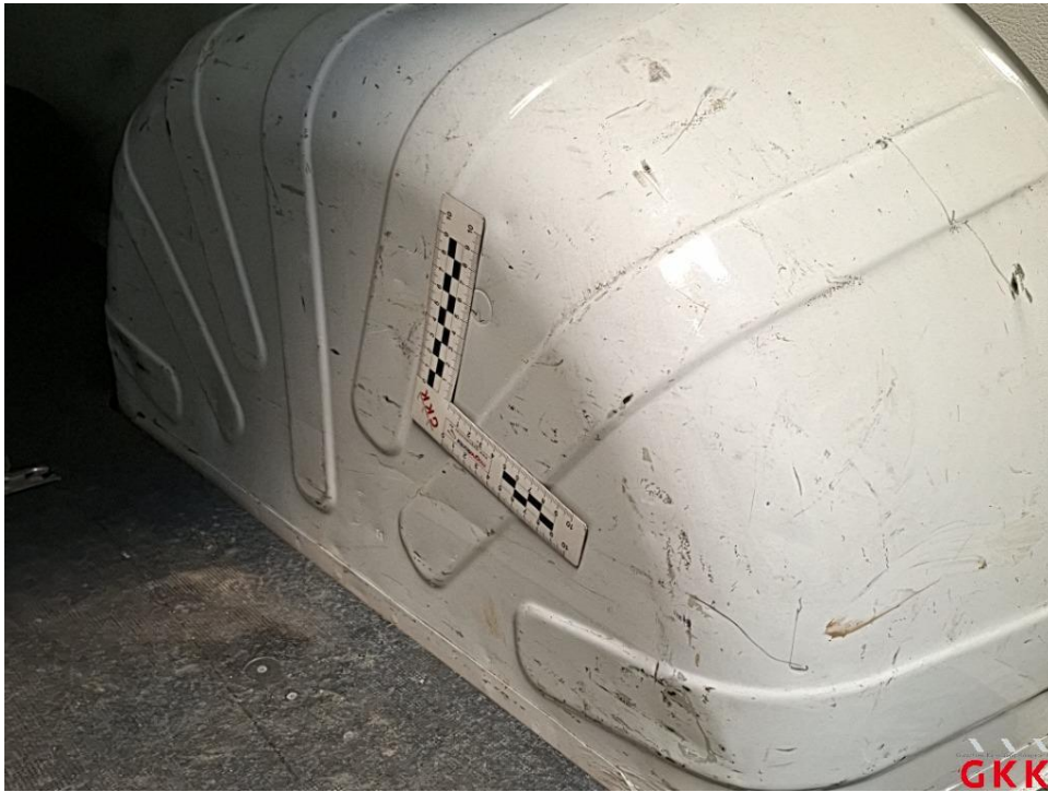
Bild 29 Radhaus hinten links und rechts, eingedellt und verkratzt (I), Smartrepair