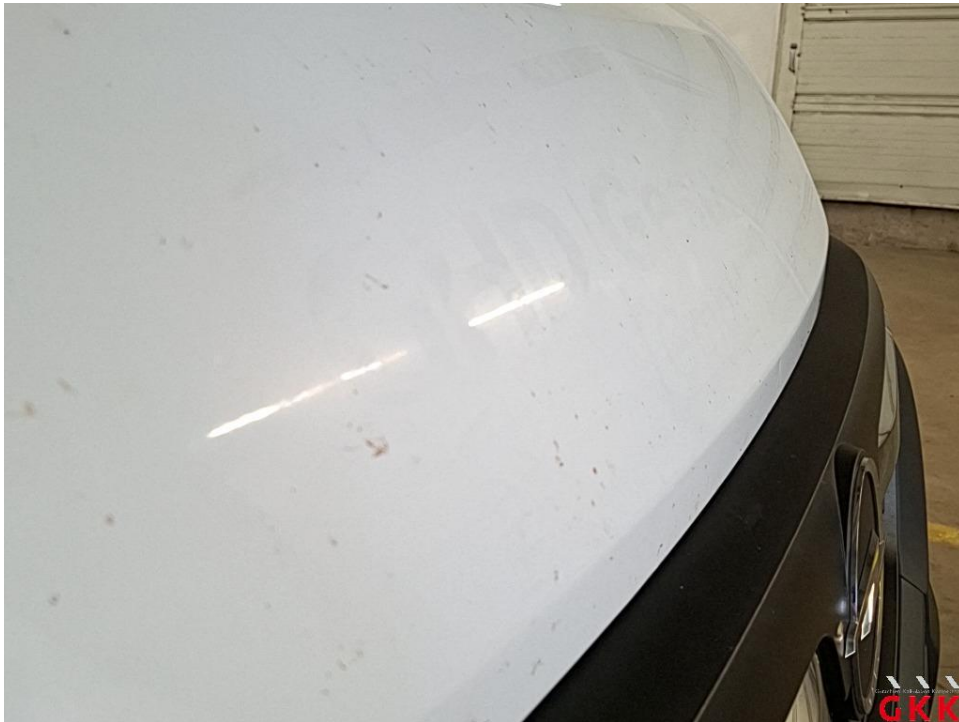
Bild 15 Fahrzeug, außen, Lackierung verwittert / matt, aufbereiten