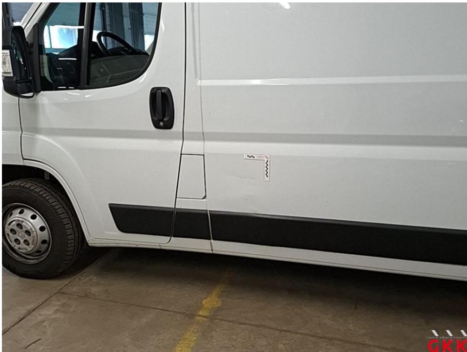
Bild 18 Seitenwand links, beschädigt, instand setzen - lackieren