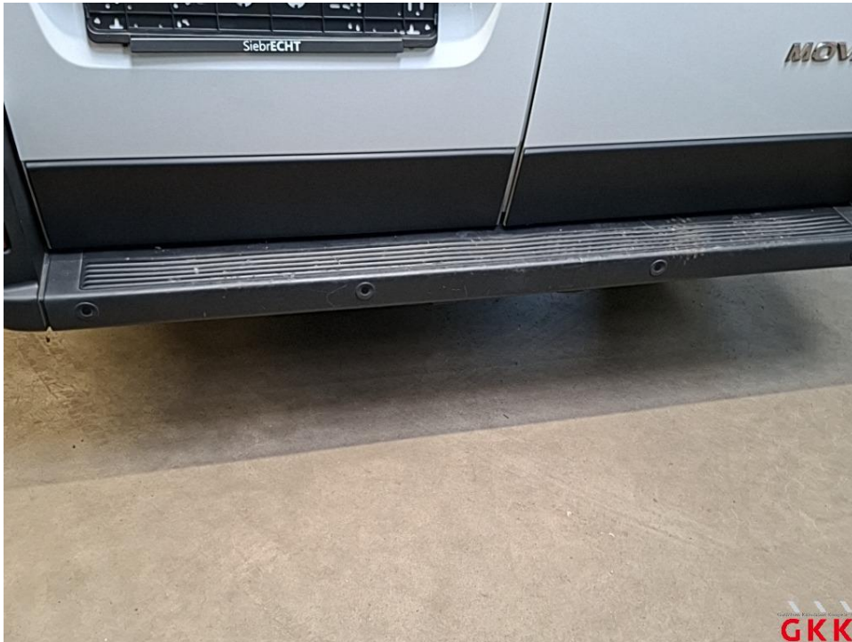
Bild 31 Stoßfänger hinten, Verkleidung -unlackiert-, beschädigt, ersetzen