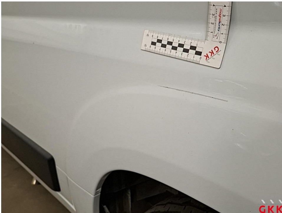
Bild 20 Seitenwand links, beschädigt, instand setzen - lackieren