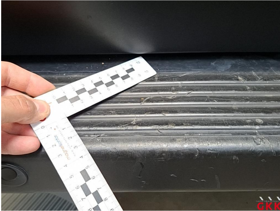
Bild 33 Stoßfänger hinten, Verkleidung -unlackiert-, beschädigt, ersetzen