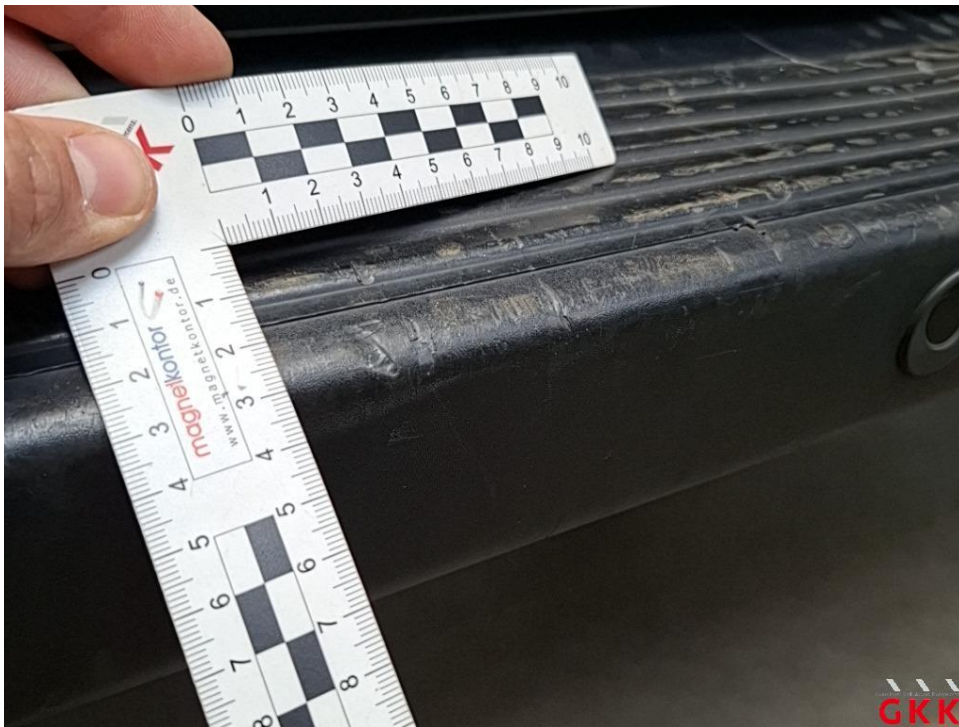
Bild 32 Stoßfänger hinten, Verkleidung -unlackiert-, beschädigt, ersetzen