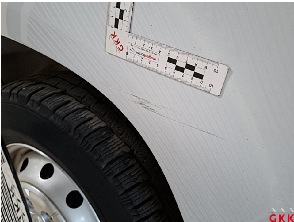
Bild 22 Seitenwand rechts, beschädigt, instand setzen - lackieren