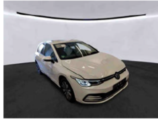
Fahrzeugansicht - diagonal vorne rechts