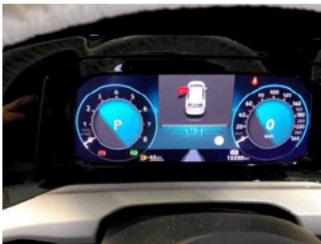
Innenraum - Cockpit mit Lauffleistung