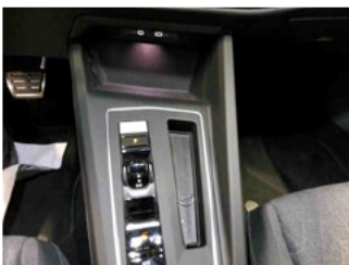
Innenraum - Mittelkonsole