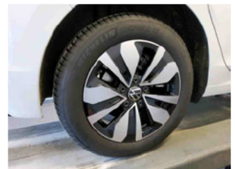
Räder - Rad montiert hinten rechts