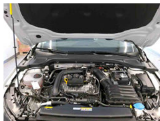
Fahrzeug - Motorraum offen