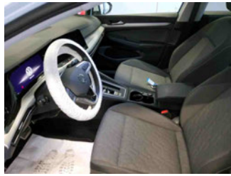
Innenraum - vorne