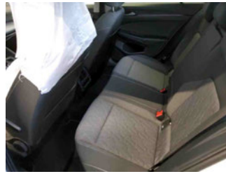
Innenraum - hinten