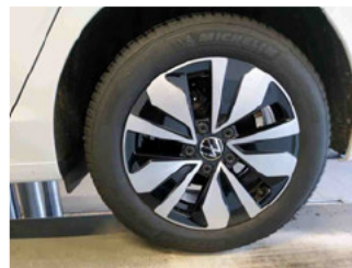
Räder - Rad montiert hinten links