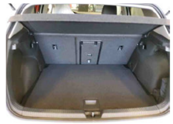
Innenraum - Kofferraum