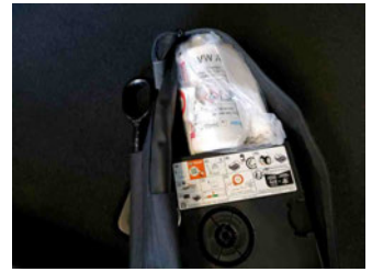
Räder - Haltbarkeitsdatum Tirefit