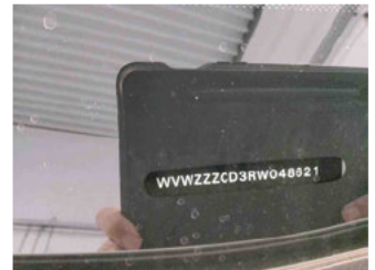
Fahrzeug - Typenschild/Fahrgestellnummer