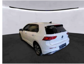
Fahrzeugansicht - diagonal hinten links