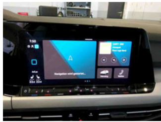
Innenraum - Navigationsgerät/Radio