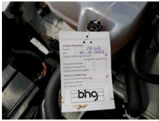
Fahrzeug - Serviceunterlagen / Wartungsnachweis