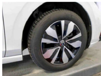
Räder - Rad montiert vorne rechts