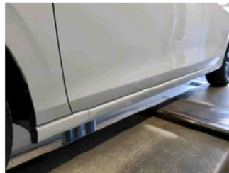
Seitenansicht - Schweller links