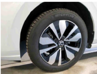
Räder - Rad montiert vorne links