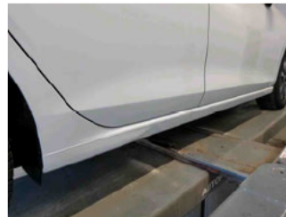
Seitenansicht - Schweller rechts