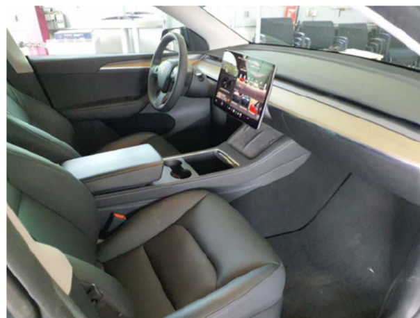
Abbildung 8: Innenraum vorne