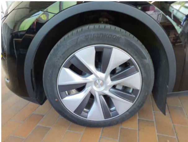
Abbildung 15: Montierte Bereifung