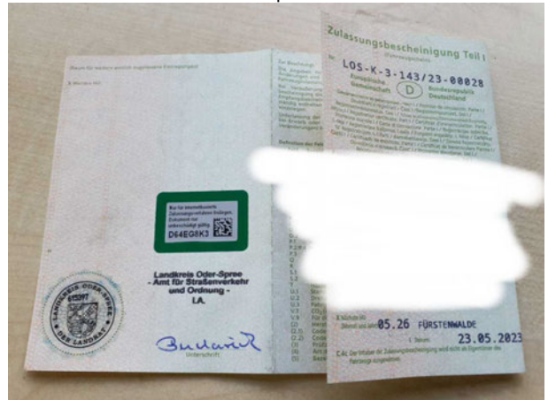
Beschädigung #3: Sonstiges: Hauptuntersuchung - fällig - durchführen