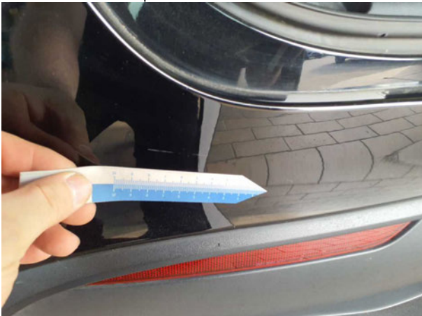
Beschädigung #2: Stossfänger hinten: Stossfänger hinten - verkratzt / verschürft - Smart Repair