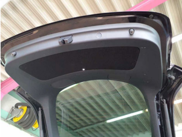
Beschädigung #1: Verkleidungen/Abdeckungen: Heckdeckel, Innenverkleidung - verkratzt / verschürft - erneuern