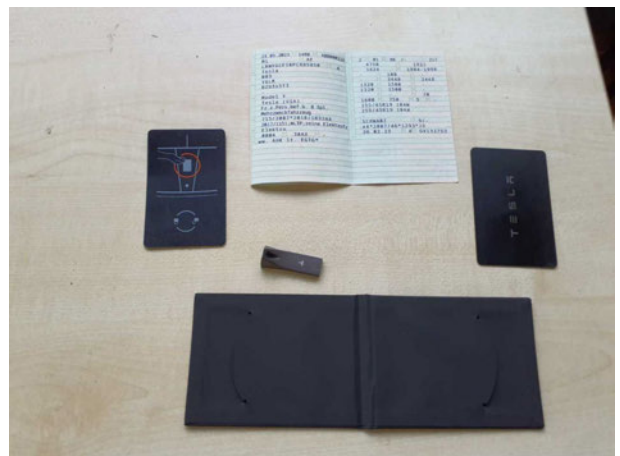
Abbildung 18: Sonstiges