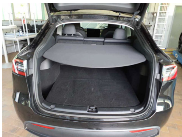
Abbildung 5: Laderaum