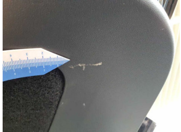
Beschädigung #1: Verkleidungen/Abdeckungen: Heckdeckel, Innenverkleidung - verkratzt / verschürft - erneuern