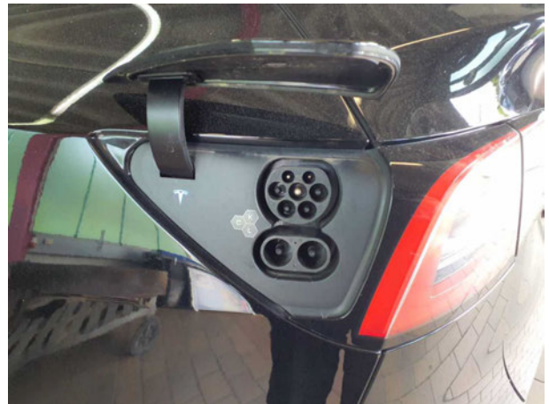
Abbildung 16: Ladebuchse/Tankstutzen