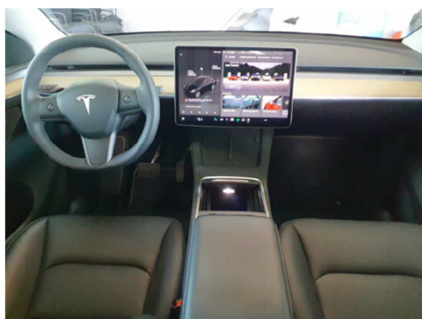
Abbildung 11: Instrumententafel