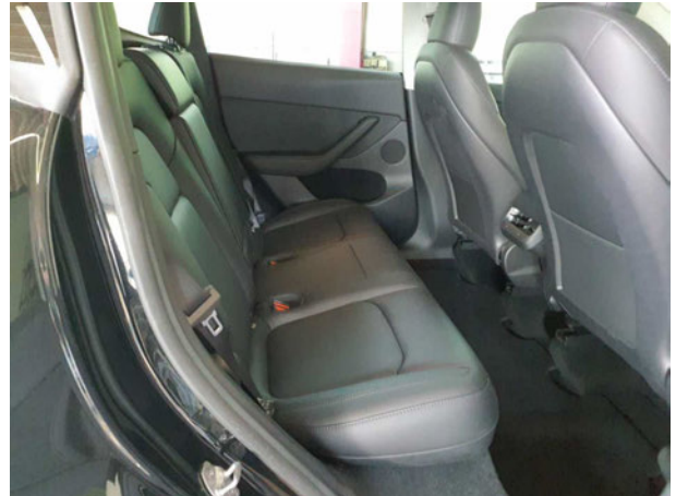
Abbildung 14: Innenraum hinten