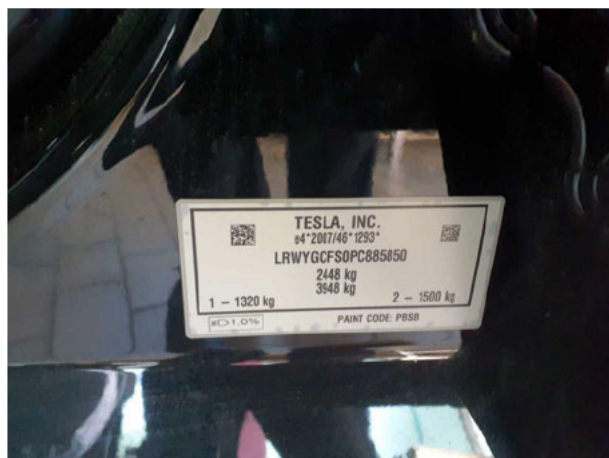
Abbildung 7: FIN