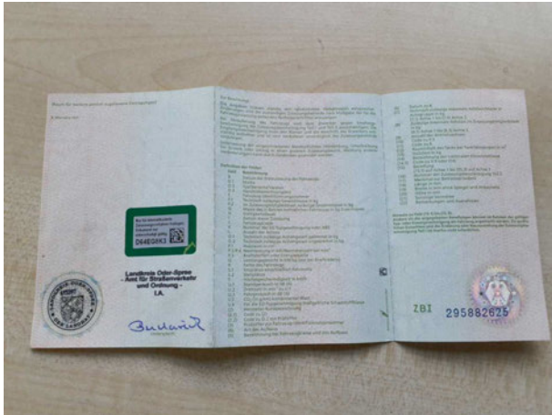
Abbildung 13: Zulassungsdokument(e)