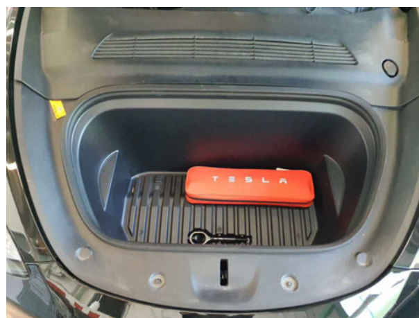
Abbildung 6: Motorraum