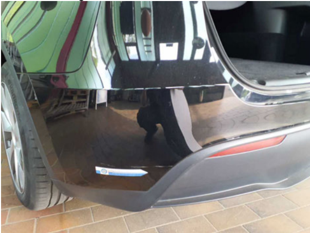
Beschädigung #2: Stossfänger hinten: Stossfänger hinten - verkratzt / verschürft - Smart Repair