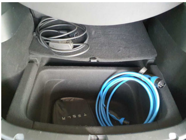
Abbildung 17: Sonstiges