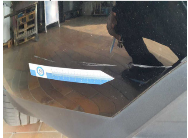
Beschädigung #2: Stossfänger hinten: Stossfänger hinten - verkratzt / verschürft - Smart Repair