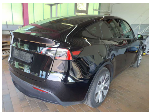
Abbildung 3: Schräg hinten