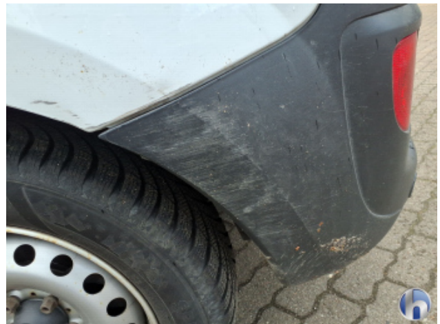
2. Stoßfänger Hinten Beschädigt - Instandsetzen und Lackieren