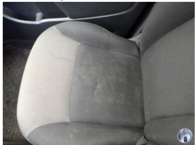
5. Sitz Innenraum rechts vorne Verschmutzt - Reinigen