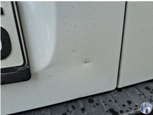
1. Heckklappe 1 Delle - Smart Repair