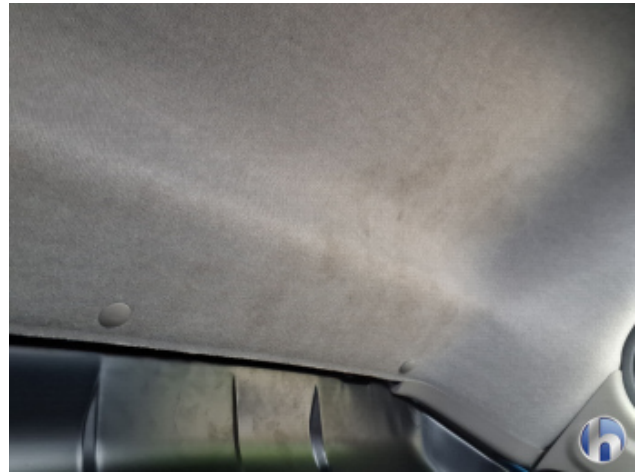
4. Dachhimmel Verschmutzt - Reinigen