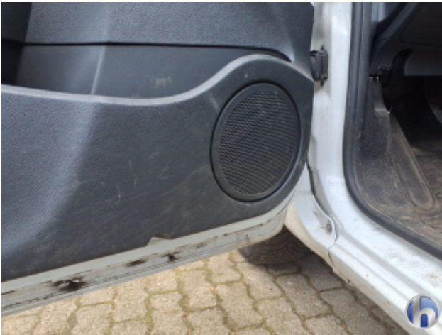
3. Verkleidung Gebrauchsspuren - Ohne Reparatur