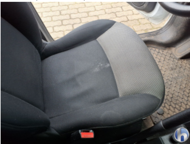
5. Sitz Innenraum rechts vorne Verschmutzt - Reinigen