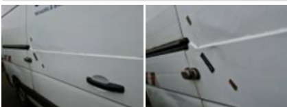
Panneau Latéral D, Bosse(s) et griffe(s), LI - Réparer et peindre (complet)