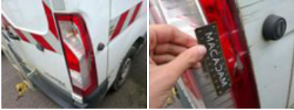
Porte de malle AR D, Bosse(s) et griffe(s), LI - Réparer et peindre (complet)