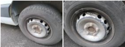
Enjoliveur de roue ARD, Manque, E - Remplacer