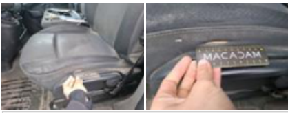
Intérieur, Sale, Nettoyage chimique