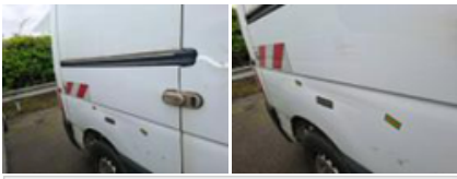
Moulure de panneau latéral D, Manque, E - Remplacer