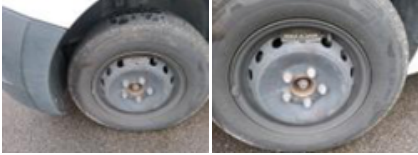
Enjoliveur de roue ARG, Manque, E - Remplacer