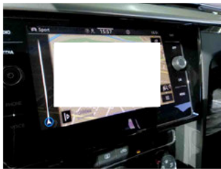
Innenraum - Navigationsgerät/Radio