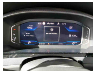
Innenraum - Cockpit mit Laufleistung