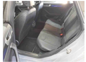
Innenraum - hinten