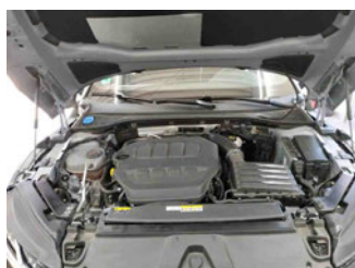
Fahrzeug - Motorraum offen