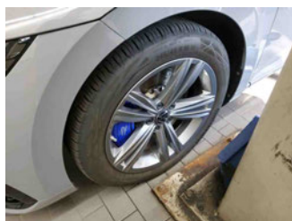
Räder - Rad montiert vorne links