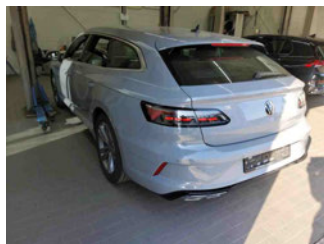
Fahrzeugansicht - diagonal hinten links