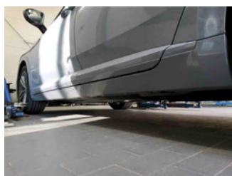
Seitenansicht - Schweller links