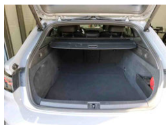
Innenraum - Kofferraum