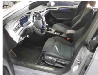
Innenraum - vorne