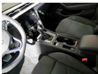
Innenraum - Mittelkonsole