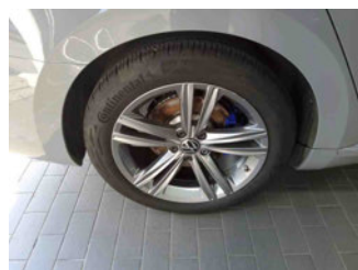
Räder - Rad montiert hinten rechts