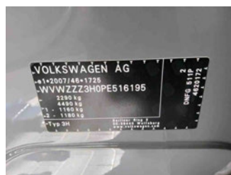
Fahrzeug - Typenschild/Fahrgestellnummer