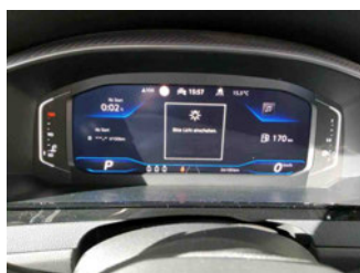
Innenraum - Cockpit mit Laufleistung