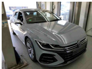
Fahrzeugansicht - diagonal vorne rechts