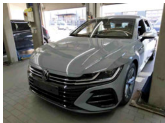
Fahrzeugansicht - diagonal vorne links