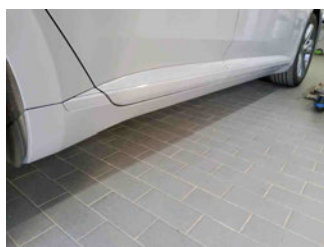
Seitenansicht - Schweller rechts