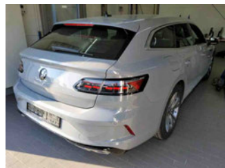
Fahrzeugansicht - diagonal hinten rechts