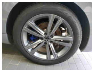
Räder - Rad montiert hinten links