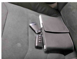
Equipment - Boardmappe/ Securitybag