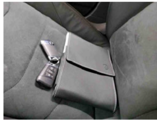
Fahrzeug - Serviceunterlagen / Wartungsnachweis