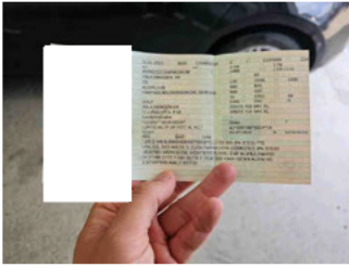
Fahrzeug - abgegebene ZB1