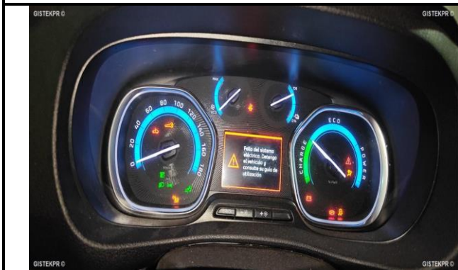
Foto daños internos 1