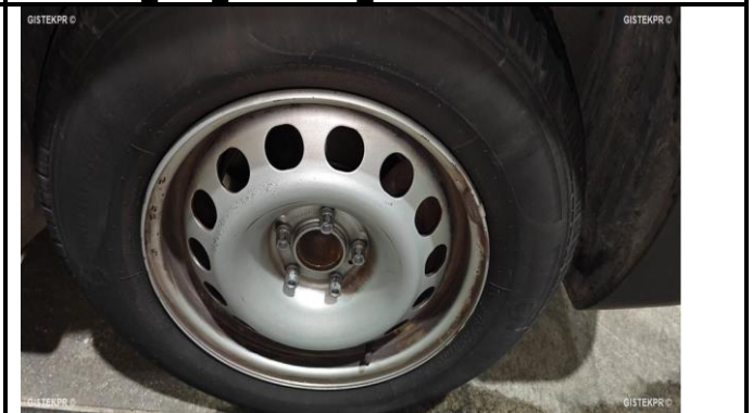
FLLAN IMG 20241202_095816