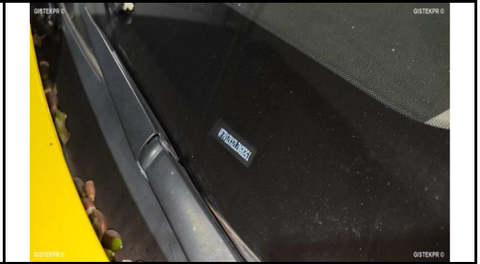
Foto daños internos 1