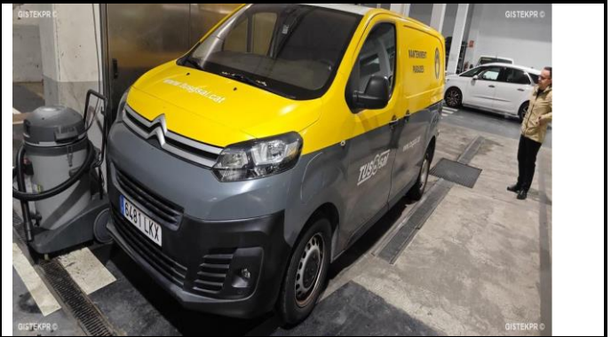
FFLTD IMG 20241202 095845