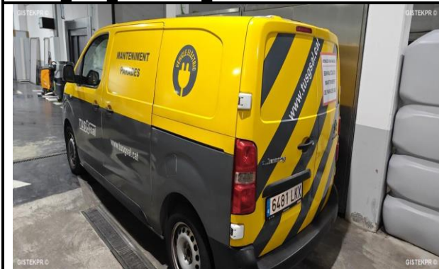
FFLT1 IMG 20241202_095813