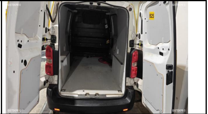
FMLTRO IMG 20241202_095804