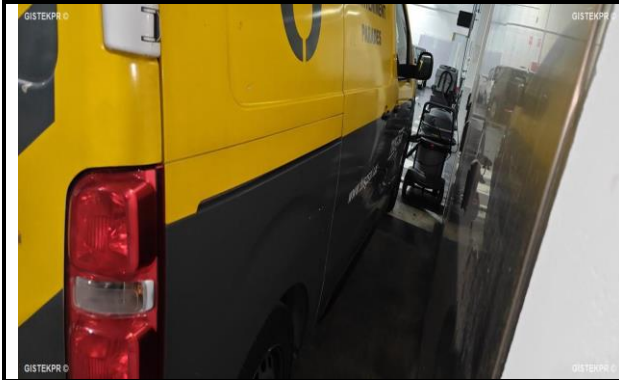
FLTD IMG 20241202_095751

INFORME-STELL-RE-664- 2024__(9513438402-6481LKX).DOC