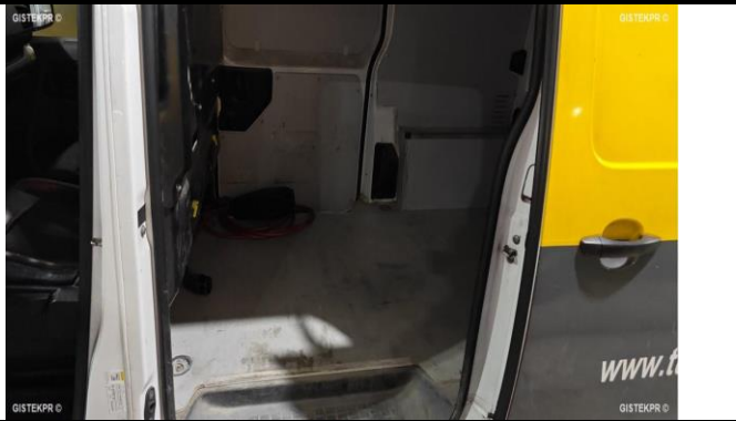
FASTRAS IMG 20241202 095832