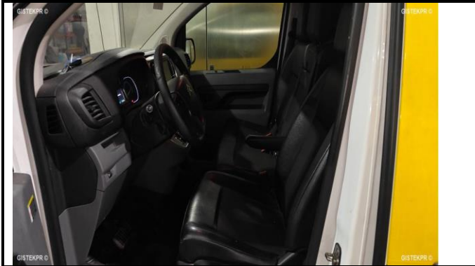
FASDEL IMG 20241202 095824