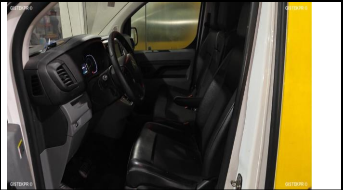
FSALP IMG 20241202 095824