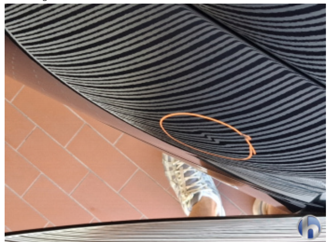
1. Seitenwand - Hinten - Links 1 Delle - Sanft Instandsetzen