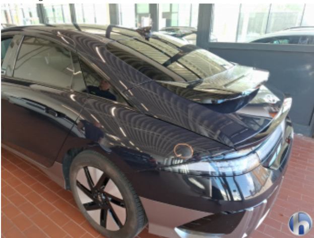
1. Seitenwand - Hinten - Links 1 Delle - Sanft Instandsetzen