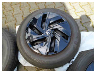
Räder - Rad beiliegend #2