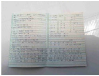
Fahrzeug - abgegebene ZB1