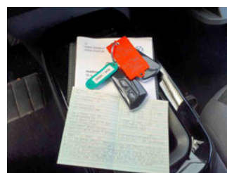
Equipment - Boardmappe/ Securitybag