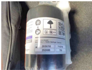
Räder - Haltbarkeitsdatum Tirefit