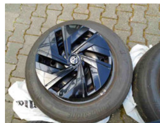
Räder - Rad beiliegend #3