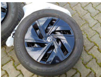
Räder - Rad beiliegend #1