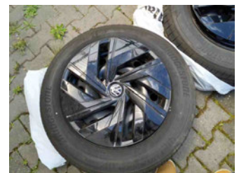
Räder - Rad beiliegend #4