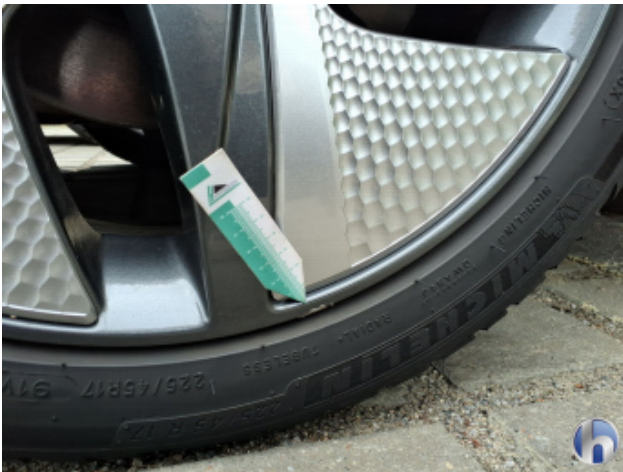
3. Felge Vorne - Rechts Kratzer - Smart Repair