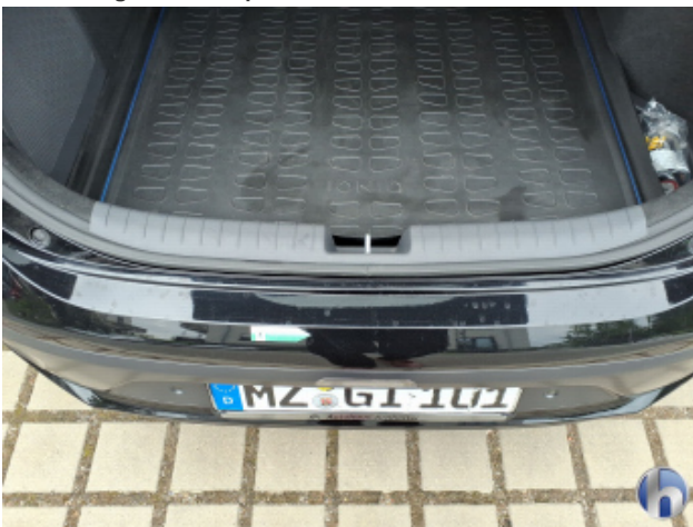
7. Stoßfänger Hinten Kratzer - Smart Repair