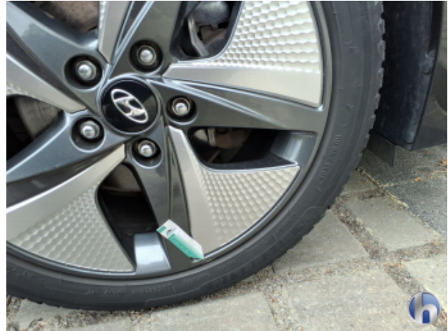
3. Felge Vorne - Rechts Kratzer - Smart Repair