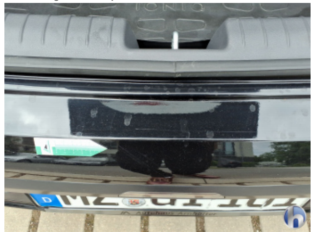
7. Stoßfänger Hinten Kratzer - Smart Repair