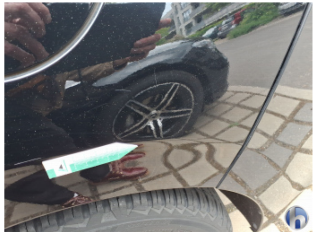
1. Seitenwand - Hinten - Links Kratzer - Smart Repair