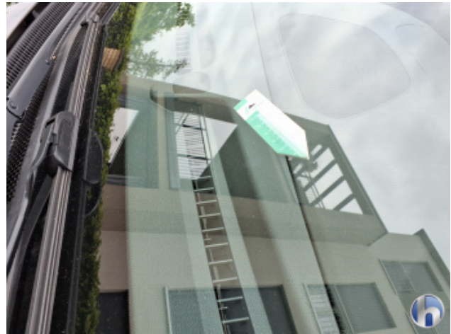
6. Windschutzscheibe Steinschlag - Smart Repair