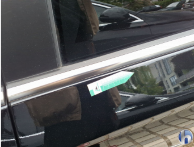
2. Tür Hinten - Links Kratzer - Smart Repair