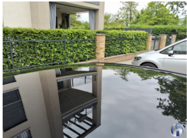
5. Dach Hagelschaden - Sanft Instandsetzen