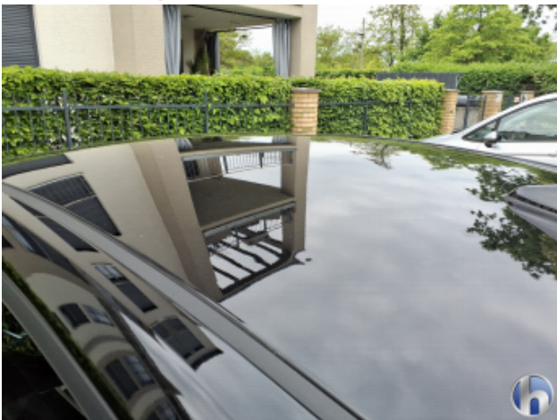
5. Dach Hagelschaden - Sanft Instandsetzen