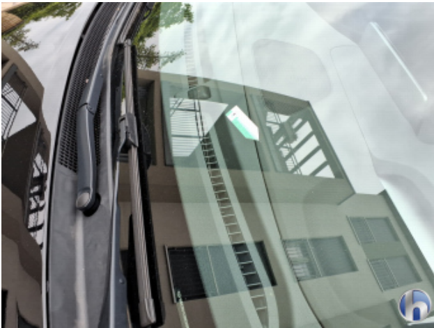
6. Windschutzscheibe Steinschlag - Smart Repair