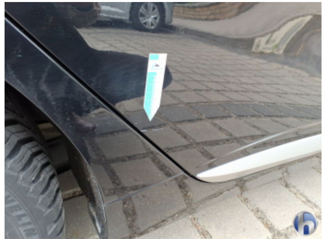
4. Tür Hinten - Rechts Kratzer - Smart Repair