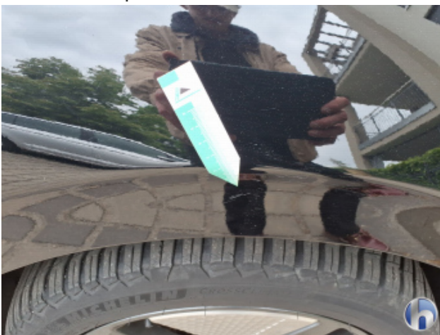
8. Kotflügel Vorne - Rechts Kratzer - Smart Repair