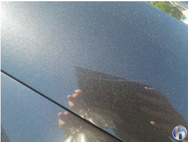
6. Motorhaube Kratzer - Lackieren