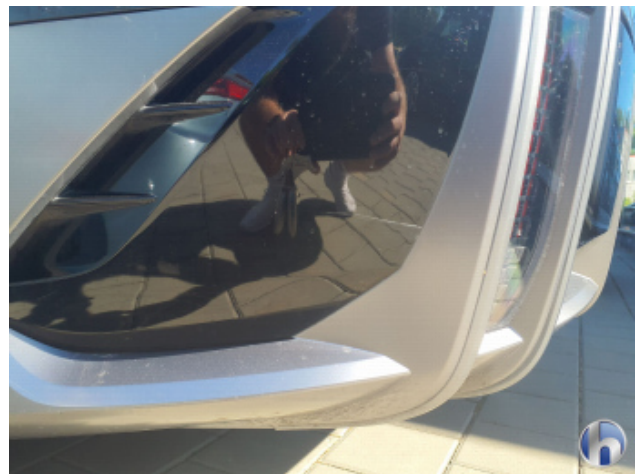
3. Stoßfänger Hinten Kratzer - Lackieren