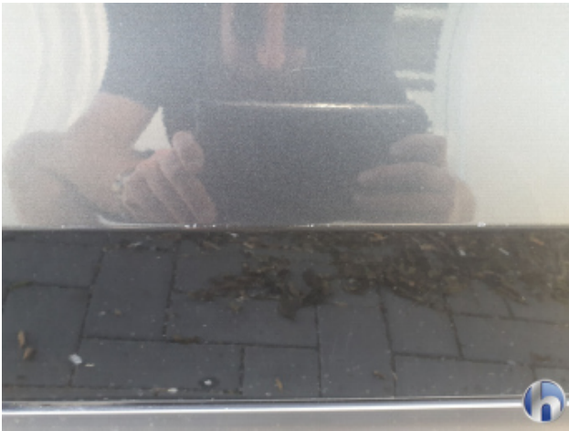
1. Tür Hinten - Links Kratzer - Lackieren