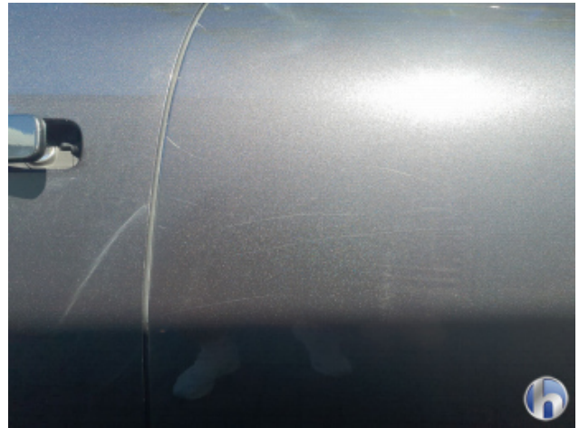
1. Tür Hinten - Links Kratzer - Lackieren