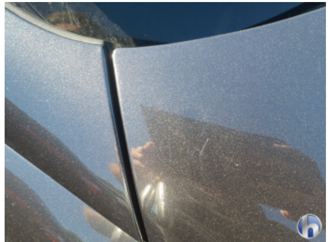
6. Motorhaube Kratzer - Lackieren