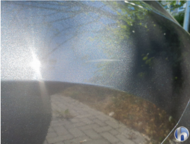
5. Seitenwand - Hinten - Links Kratzer - Lackieren