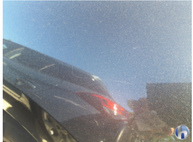
5. Seitenwand - Hinten - Links Kratzer - Lackieren