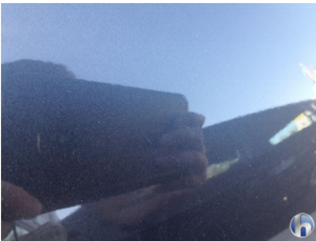
2. Seitenwand - Hinten - Rechts Kratzer - Smart Repair