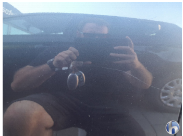
4. Tür Hinten - Rechts Kratzer - Lackieren