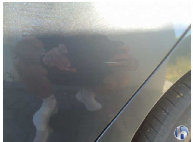
1. Tür Hinten - Links Kratzer - Lackieren