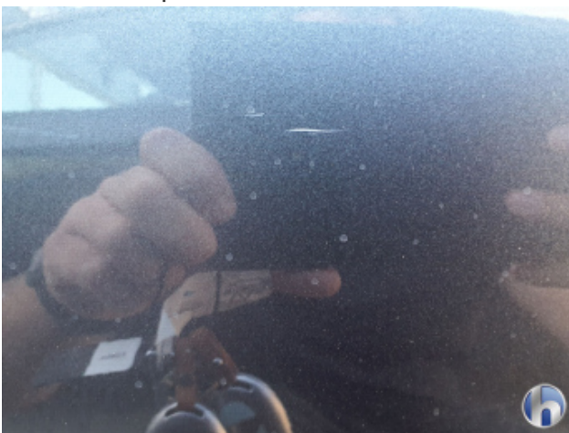
4. Tür Hinten - Rechts Kratzer - Lackieren