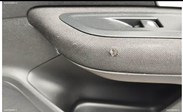
GUARNECIDO PUERTA TI