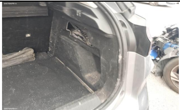
GUARNECIDO LAT D MALETERO.