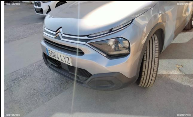
FFLTI_FOTOS FRONTO LATERAL IZQUIERDA