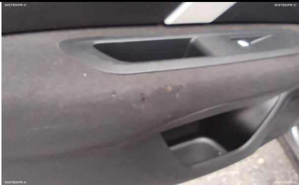
GUARNECIDO PUERTA TI