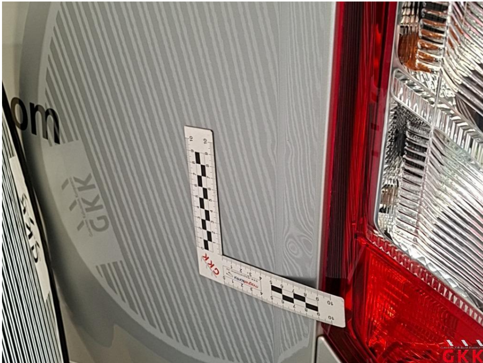
Bild 19 Seitenwand links, beschädigt, kalt drücken