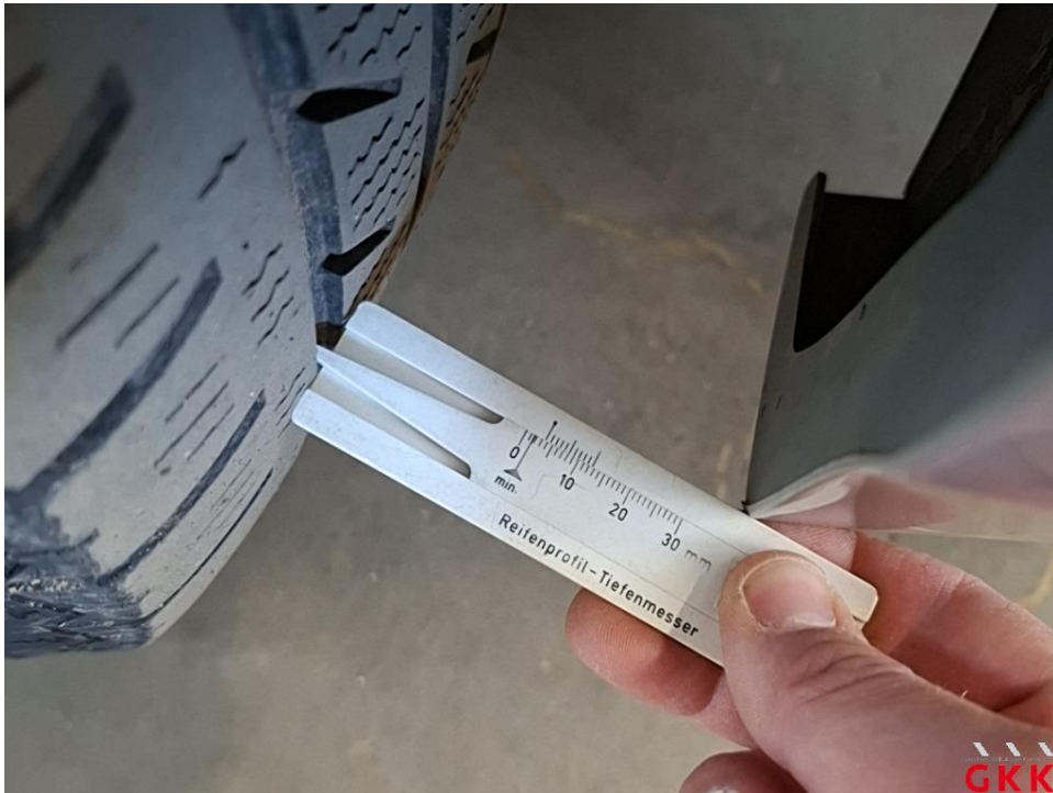
Bild 17 Reifen, vorn links und rechts, Untermaß, ersetzen