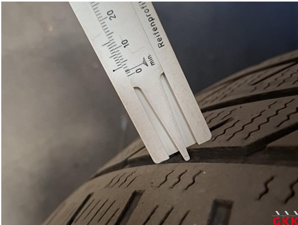
Bild 16 Reifen, vorn links und rechts, Untermaß, ersetzen