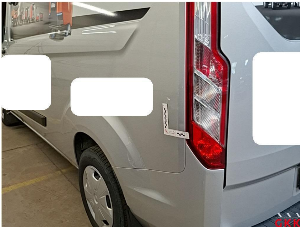
Bild 18 Seitenwand links, beschädigt, kalt drücken