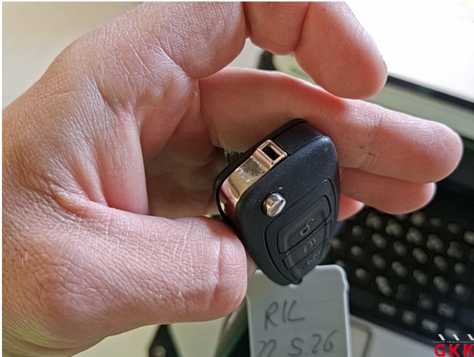
Bild 15 Hauptschlüssel, inkl. Zusatzschlüssel, fehlt, ersetzen