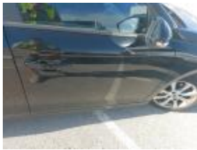
Aleta Tras Dr