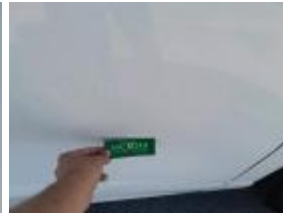
Reparar + Pintar