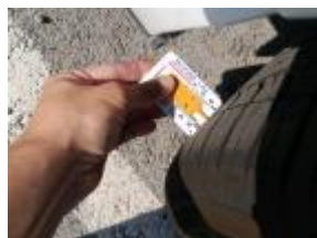
Residuos de pegamento