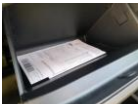
Tarjeta De Matriculación