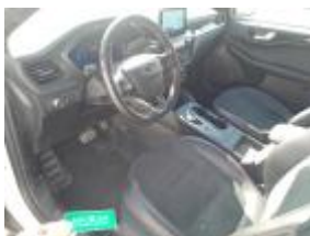
Manual de Instrucciones