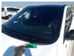
Kit de pegamento de parabrisas