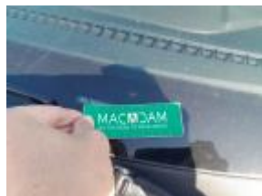
Necesario para instalar el acristalamiento