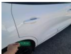
Puerta Delant Dr