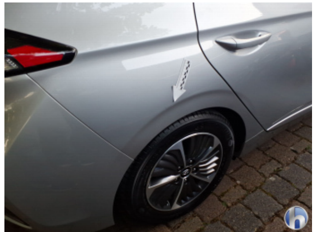
1. Seitenwand - Hinten - Rechts Gebrauchsspuren - Ohne Reparatur