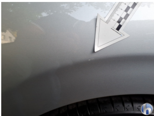
1. Seitenwand - Hinten - Rechts Gebrauchsspuren - Ohne Reparatur