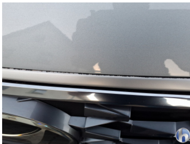
2. Kühlergrill Außen vorne Lackabplatzer - Lackieren