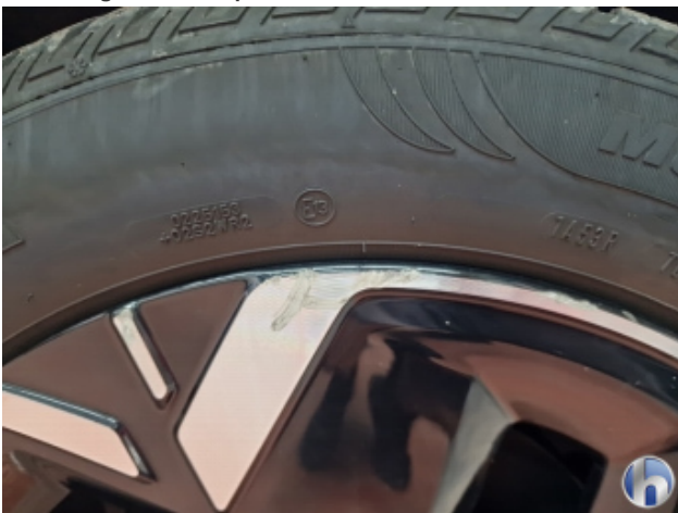
1. Felge Vorne - Rechts Beschädigt - Smart Repair