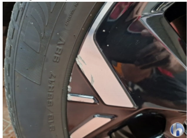
1. Felge Vorne - Rechts Beschädigt - Smart Repair