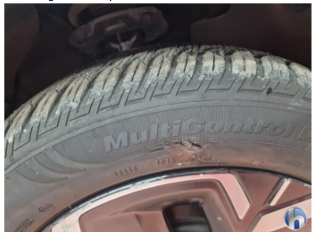
2. Reifen Vorne - Rechts Beschädigt - Smart Repair