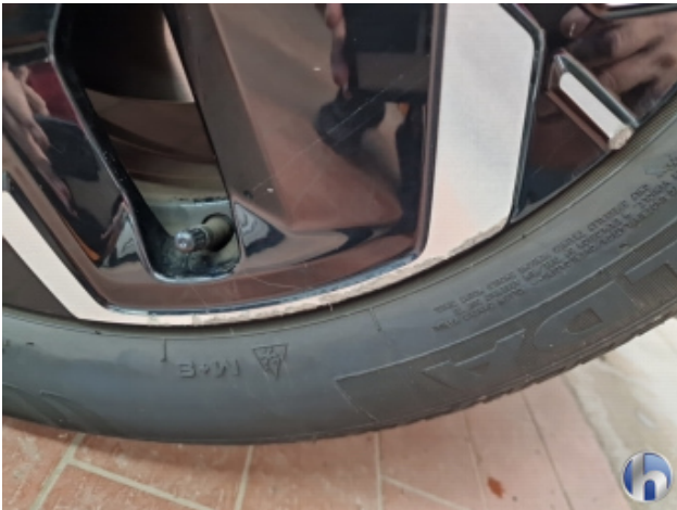
1. Felge Vorne - Rechts Beschädigt - Smart Repair