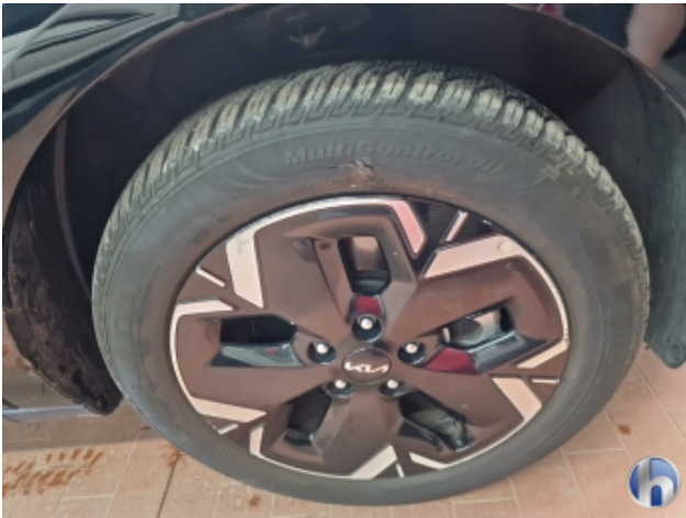
2. Reifen Vorne - Rechts Beschädigt - Smart Repair