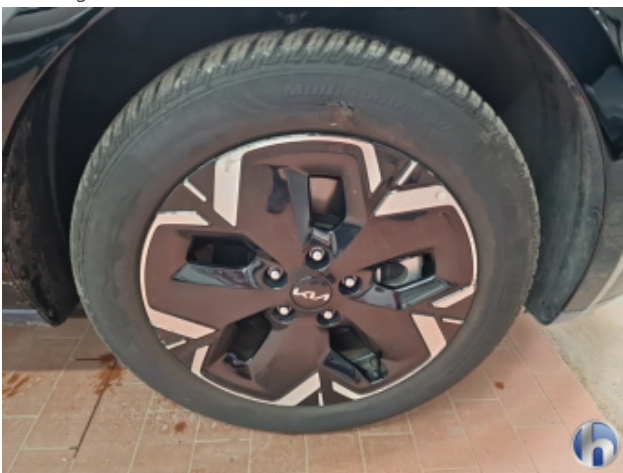
1. Felge Vorne - Rechts Beschädigt - Smart Repair