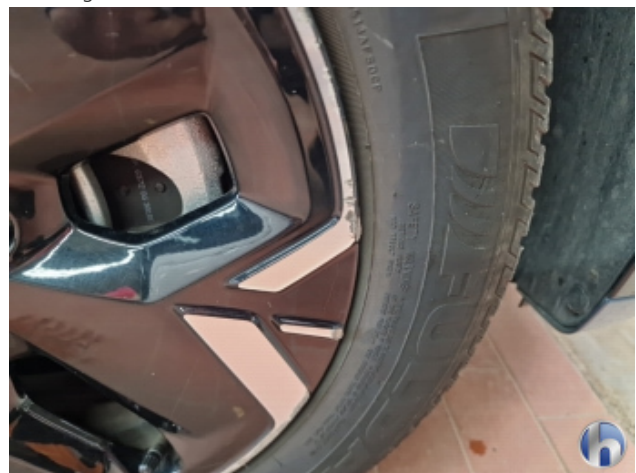
1. Felge Vorne - Rechts Beschädigt - Smart Repair