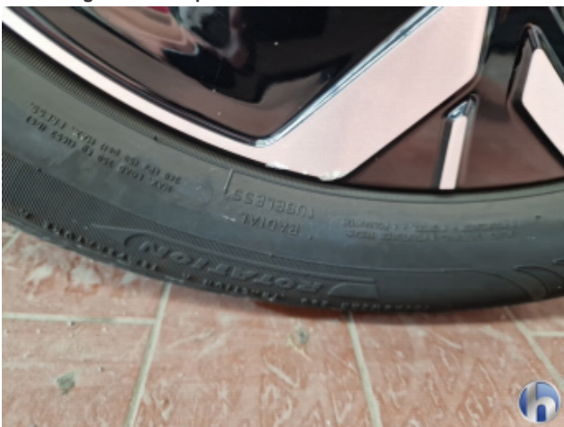
1. Felge Vorne - Rechts Beschädigt - Smart Repair