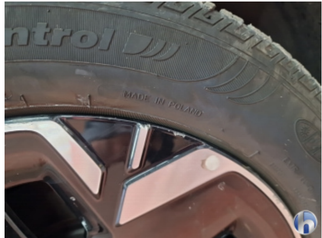
1. Felge Vorne - Rechts Beschädigt - Smart Repair