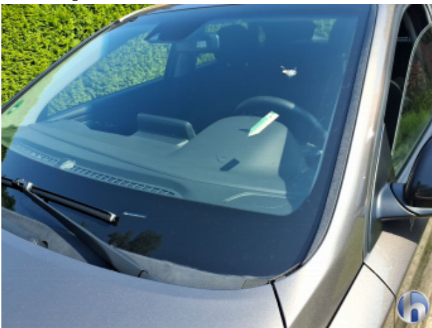
1. Windschutzscheibe Steinschlag - Erneuern