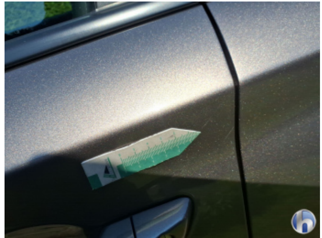
2. Tür Vorne - Links Kratzer - Smart Repair