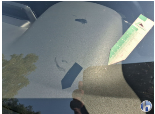
1. Windschutzscheibe Steinschlag - Erneuern