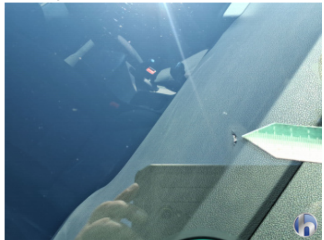
1. Windschutzscheibe Steinschlag - Erneuern