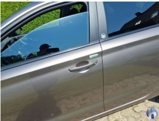
2. Tür Vorne - Links Kratzer - Smart Repair