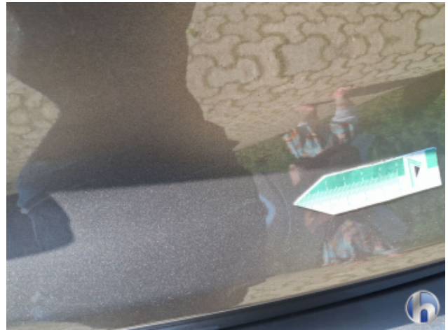
4. Heckklappenverkleidung Gebrauchsspuren - Ohne Reparatur