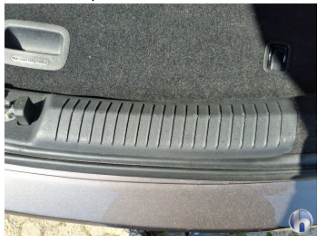
4. Heckklappenverkleidung Gebrauchsspuren - Ohne Reparatur