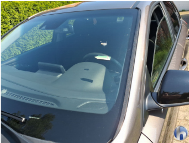
1. Windschutzscheibe Steinschlag - Erneuern