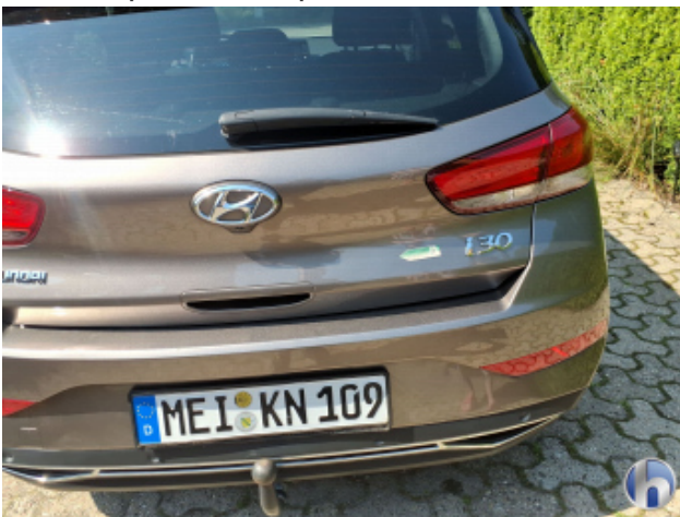
4. Heckklappenverkleidung Gebrauchsspuren - Ohne Reparatur