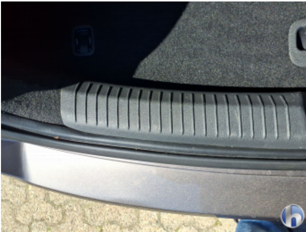
4. Heckklappenverkleidung Gebrauchsspuren - Ohne Reparatur