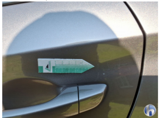
3. Tür Hinten - Links Kratzer - Smart Repair