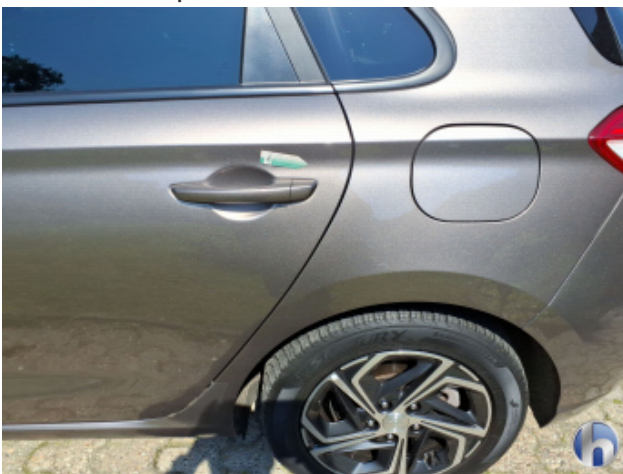
3. Tür Hinten - Links Kratzer - Smart Repair