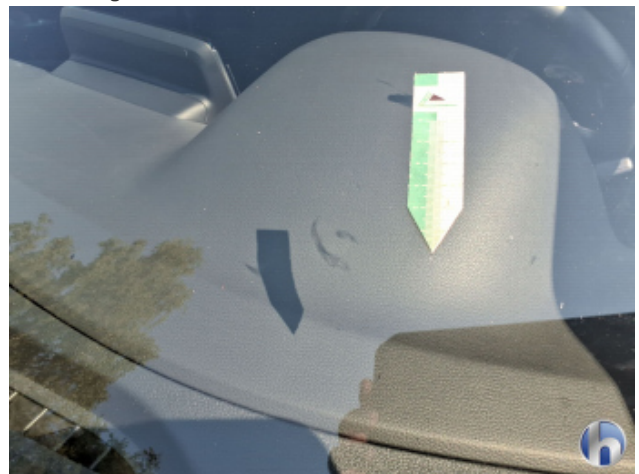
1. Windschutzscheibe Steinschlag - Erneuern