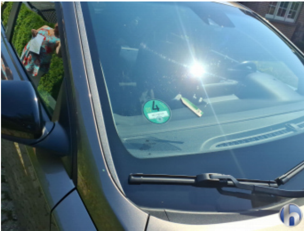
1. Windschutzscheibe Steinschlag - Erneuern