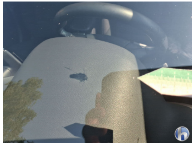
1. Windschutzscheibe Steinschlag - Erneuern