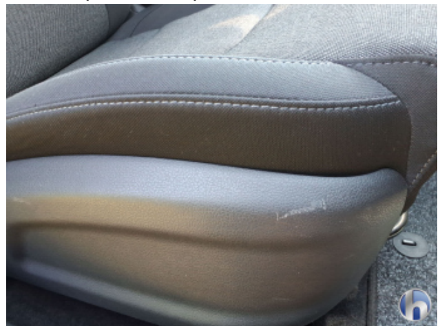
5. Sitz Innenraum rechts vorne Kratzer - Smart Repair