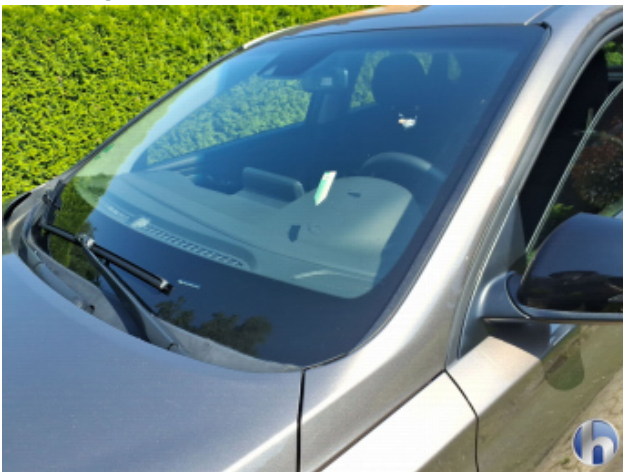
1. Windschutzscheibe Steinschlag - Erneuern