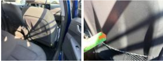
Guarnición Puerta Del DR Rayado Importe

Ubicación Type Tipo de reparación Cubierta respaldo DL Dr Rayado Importe