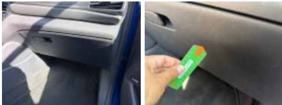
Guarnic Tapa Tras Rayado Importe