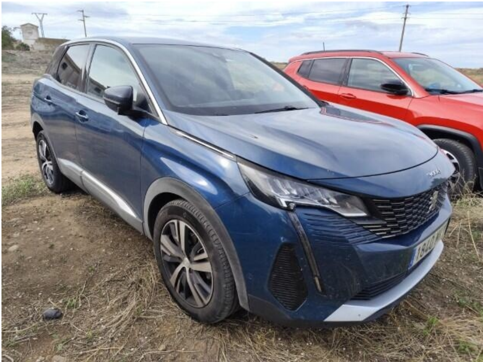
5. Fotos Exteriores