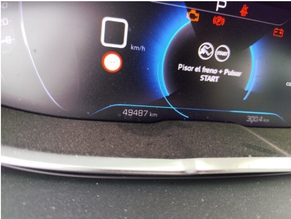
4. Vista General