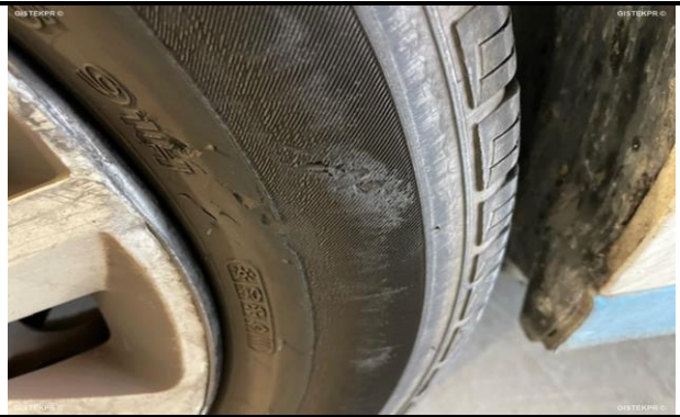
Foto daños externos 1