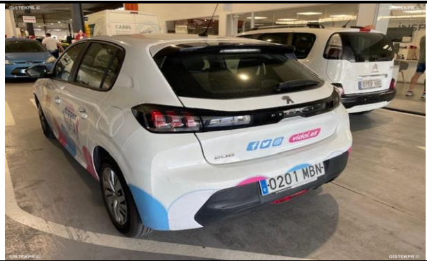
FTLTI_FOTOS TRASERA LATERAL IZQUIERDA