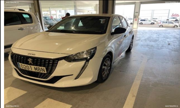
FFLTI_FOTOS FRONTO LATERAL IZQUIERDA