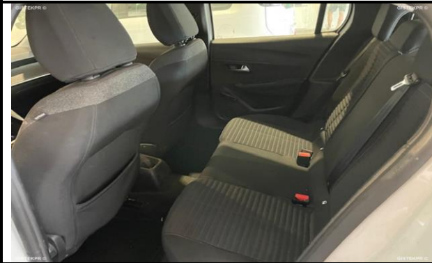
FASTRAS_FOTOS ASIENTOS TRASEROS

INFORME-STELL-RE-1010- 2025_(9514749731- 0201MBN).DOC