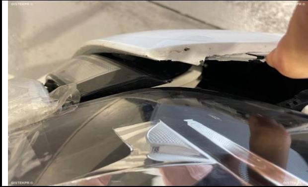
Foto daños externos 1