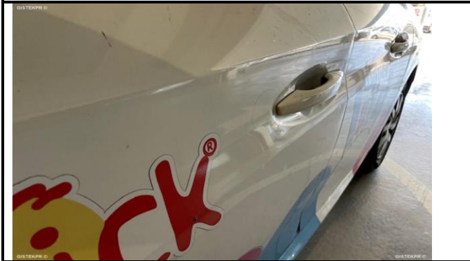
Foto daños externos 1