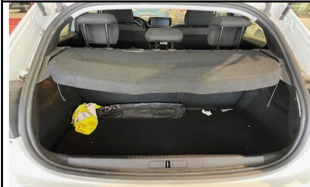
Foto daños internos 25