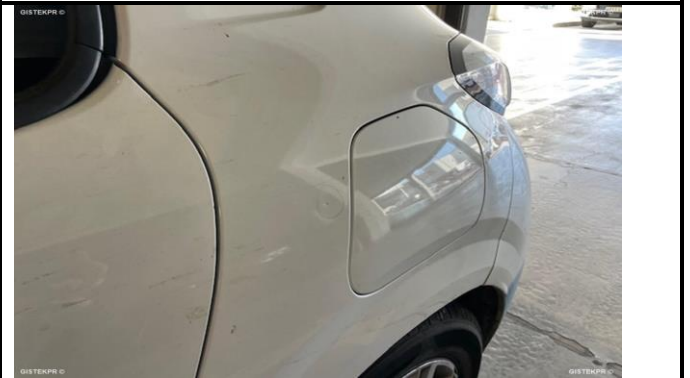
Foto daños externos 1