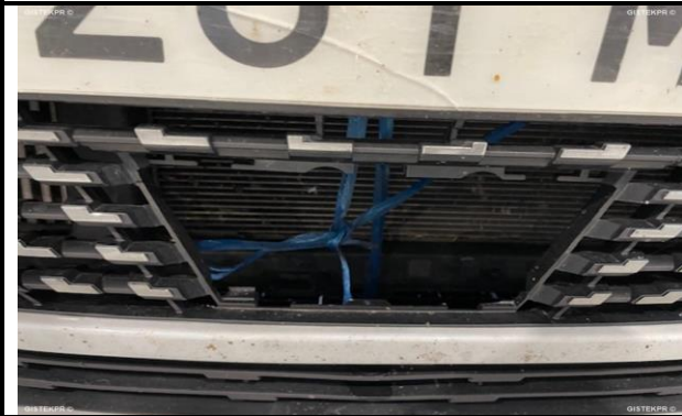
Foto daños externos 1

INFORME-STELL-RE-1010- 2025_(9514749731- 0201MBN).DOC