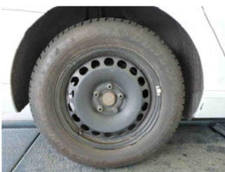
Räder - Rad montiert hinten rechts