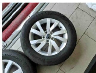
Räder - Rad beiliegend #1