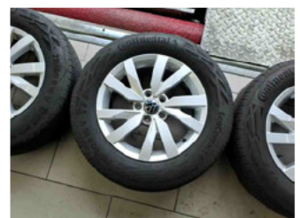
Räder - Rad beiliegend #3