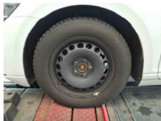
Räder - Rad montiert vorne links