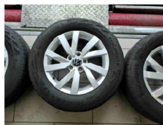
Räder - Rad beiliegend #2