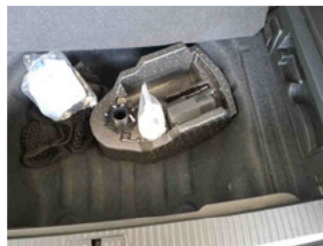
Equipment - Bordwerkzeug