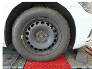
Räder - Rad montiert vorne rechts