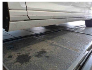
Seitenansicht - Schweller links