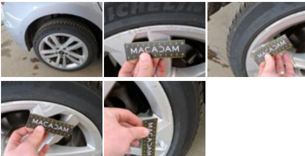
Jante alum. AVD, Griffe(s), Réparer/rempl. (montant forfaitaire)