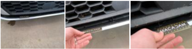
Calandre, Cassé, E - Remplacer