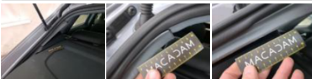
Garn mont pavillon ARD, Griffe(s), Réparer/rempl. (montant forfaitaire)