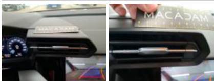
Console centrale, Griffe(s), Smart repair +