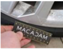
Aile AVG, Bosse(s), LI - Réparer et peindre (complet)