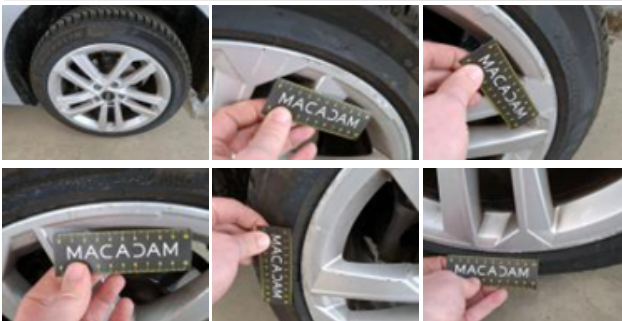
Jante alum. ARD, Griffe(s), Réparer/rempl. (montant forfaitaire)