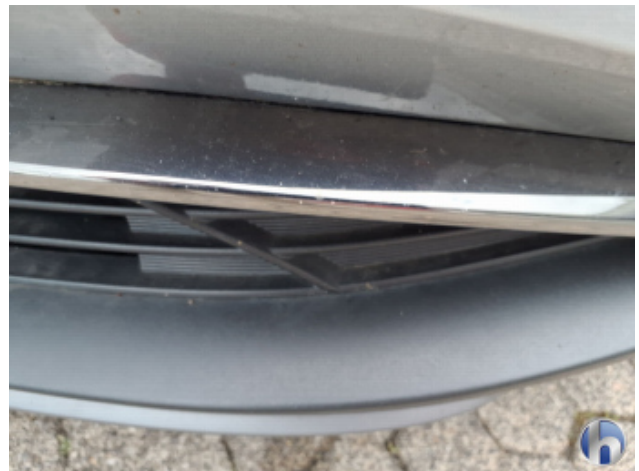
2. Stoßfänger Vorne Gebrauchsspuren - Ohne Reparatur