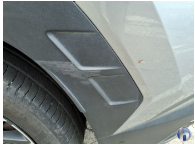
4. Radlaufblende hinten Abschürfung - Erneuern