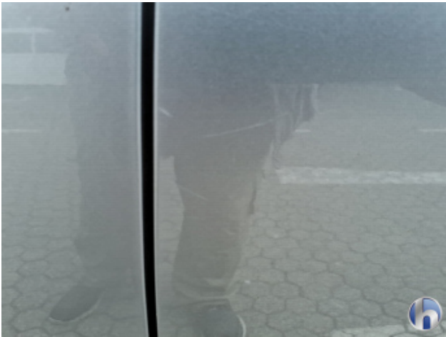
3. Tür Hinten - Links Kratzer - Smart Repair