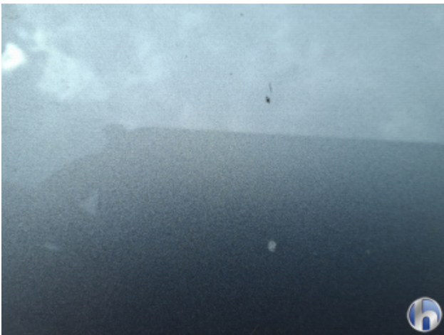
1. Motorhaube Gebrauchsspuren - Ohne Reparatur