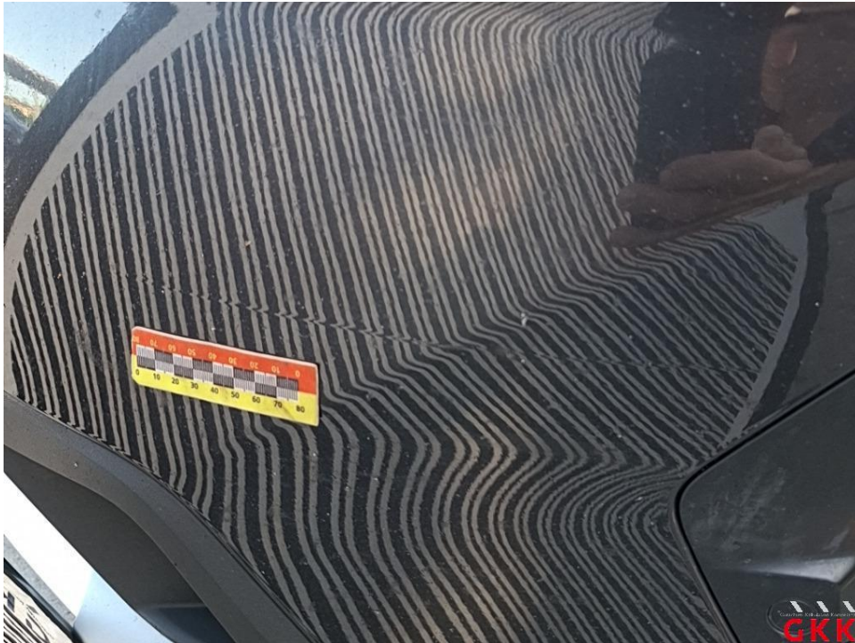
Bild 27. Stoßfänger vorne, Verkleidung -lackiert-, beschädigt, instand setzen - lackieren