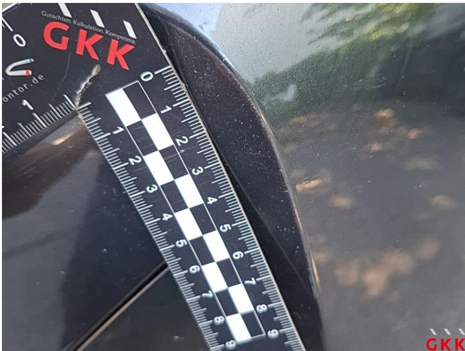
Bild 26. Stoßfänger vorne, Verkleidung -lackiert-, beschädigt, instand setzen - lackieren