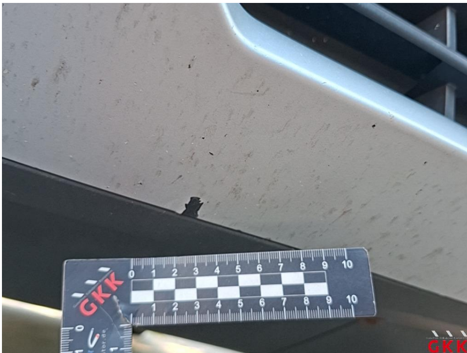
Bild 34. Stoßfänger vorne, Spoiler -lackiert-, verkratzt, lackieren