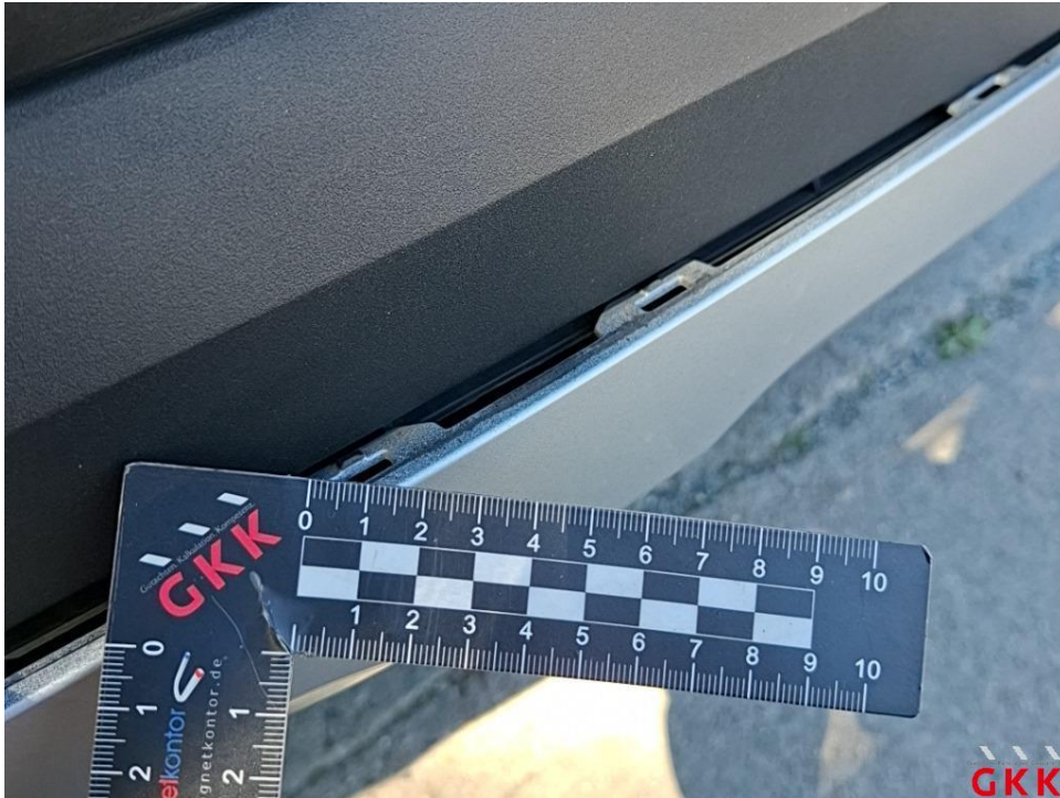
Bild 15. Stoßfänger hinten, Spoiler -lackiert-, beschädigt, ersetzen