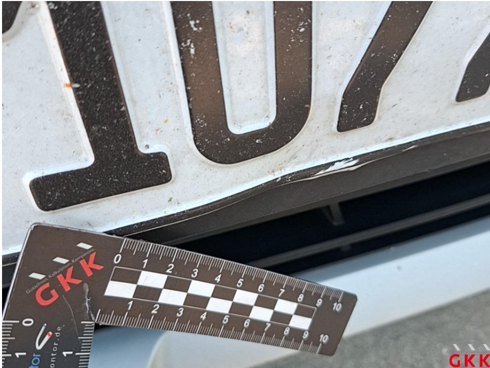
Bild 39. Kennzeichen vorne, beschädigt, ersetzen