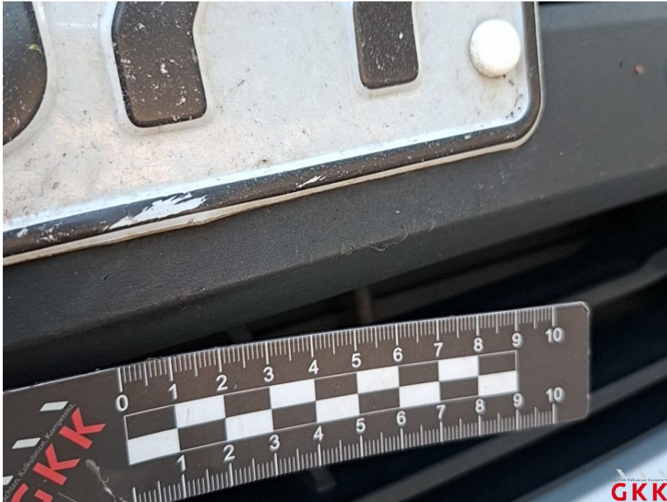
Bild 29. Stoßfänger vorne, Leiste -mittig-, beschädigt, ersetzen