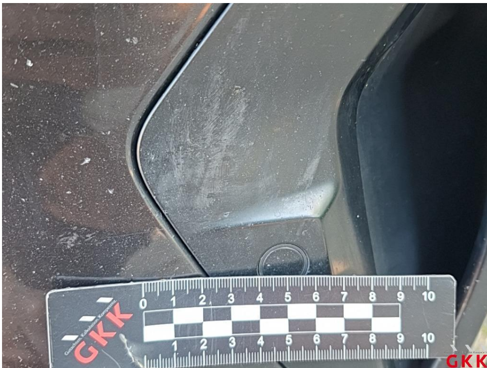
Bild 32. Stoßfänger vorne, Blende -lackiert-, beschädigt, ersetzen