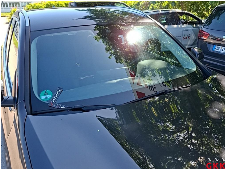
Bild 22. Frontscheibe, mit Regensensor und Frontkamera, Steinschlag mit Rissbildung, ersetzen