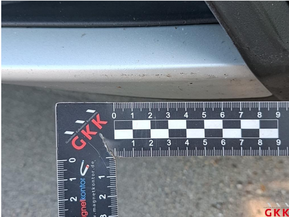
Bild 33. Stoßfänger vorne, Spoiler -lackiert-, verkratzt, lackieren