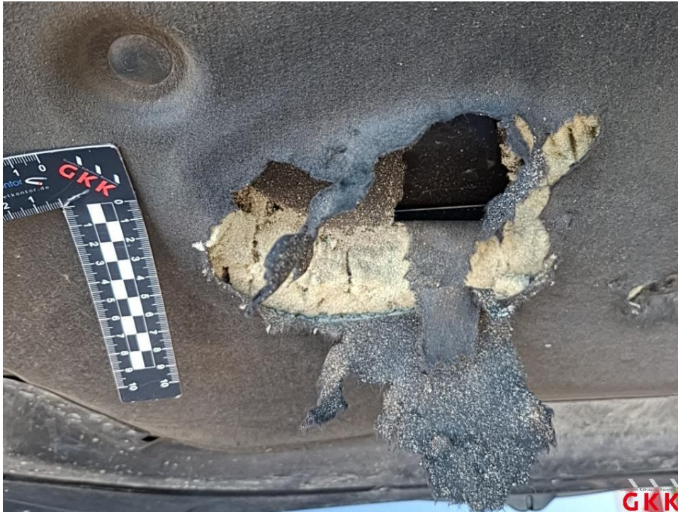
Bild 13. Motorhaube, Dämmmatte, beschädigt, ersetzen