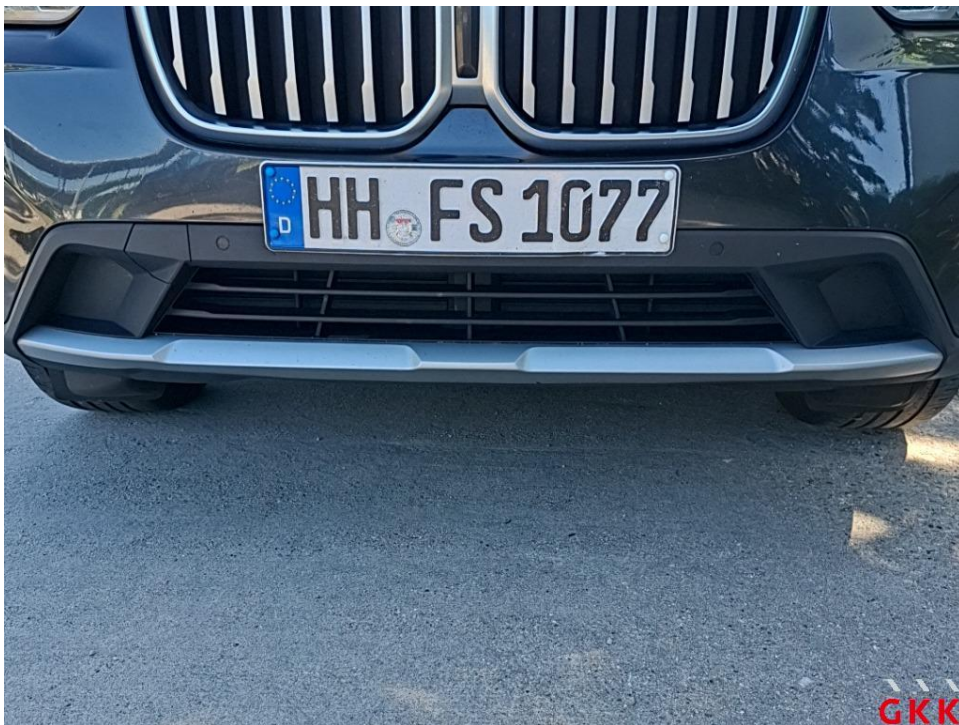
Bild 28. Stoßfänger vorne, Leiste -mittig-, beschädigt, ersetzen