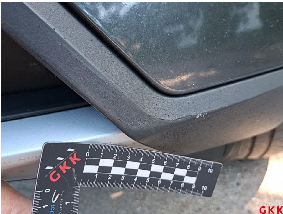
Bild 30. Stoßfänger vorne, Leiste -mittig-, beschädigt, ersetzen