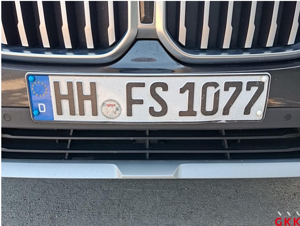
Bild 38. Kennzeichen vorne, beschädigt, ersetzen