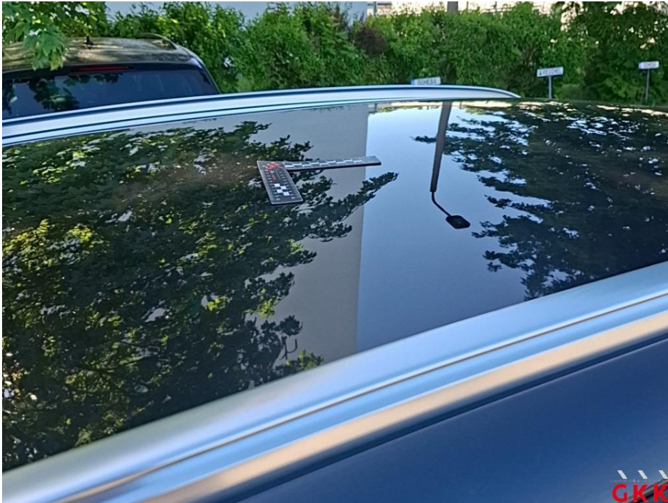
Bild 19. Dach, bis 3 Dellen / Bauteil, kalt drücken