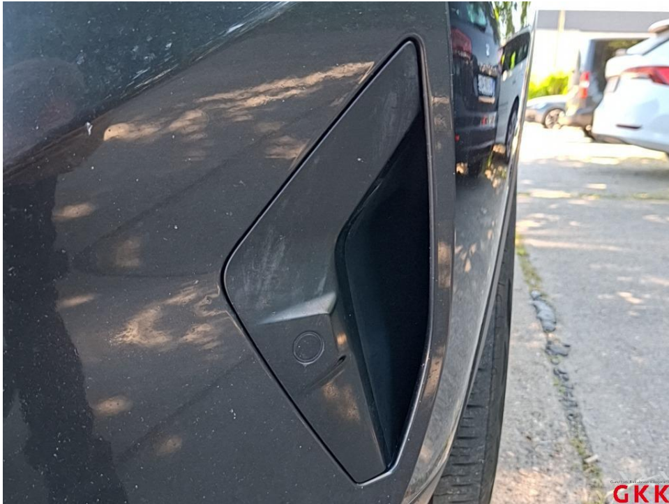
Bild 31. Stoßfänger vorne, Blende -lackiert-, beschädigt, ersetzen