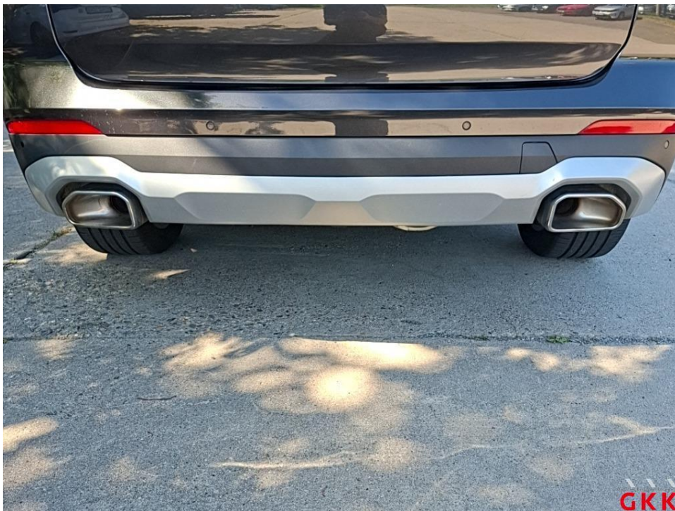
Bild 14. Stoßfänger hinten, Spoiler -lackiert-, beschädigt, ersetzen