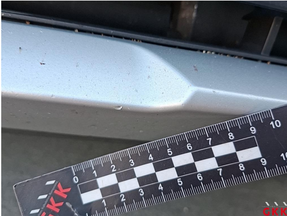
Bild 35. Stoßfänger vorne, Spoiler -lackiert-, verkratzt, lackieren