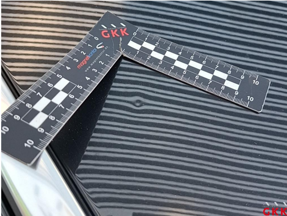
Bild 21. Dach, bis 3 Dellen / Bauteil, kalt drücken