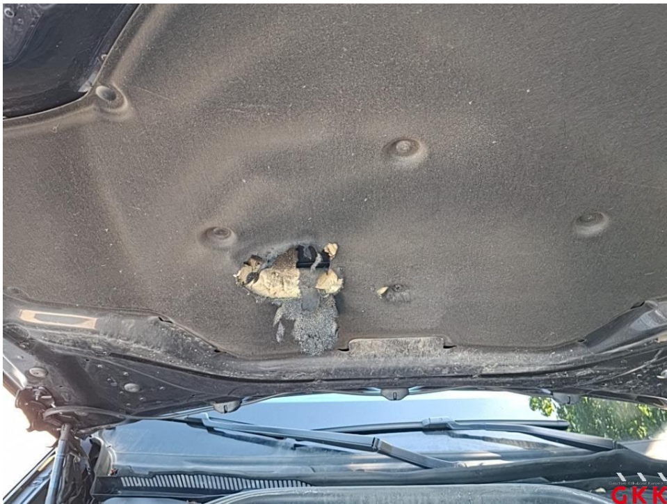
Bild 12. Motorhaube, Dämmmatte, beschädigt, ersetzen