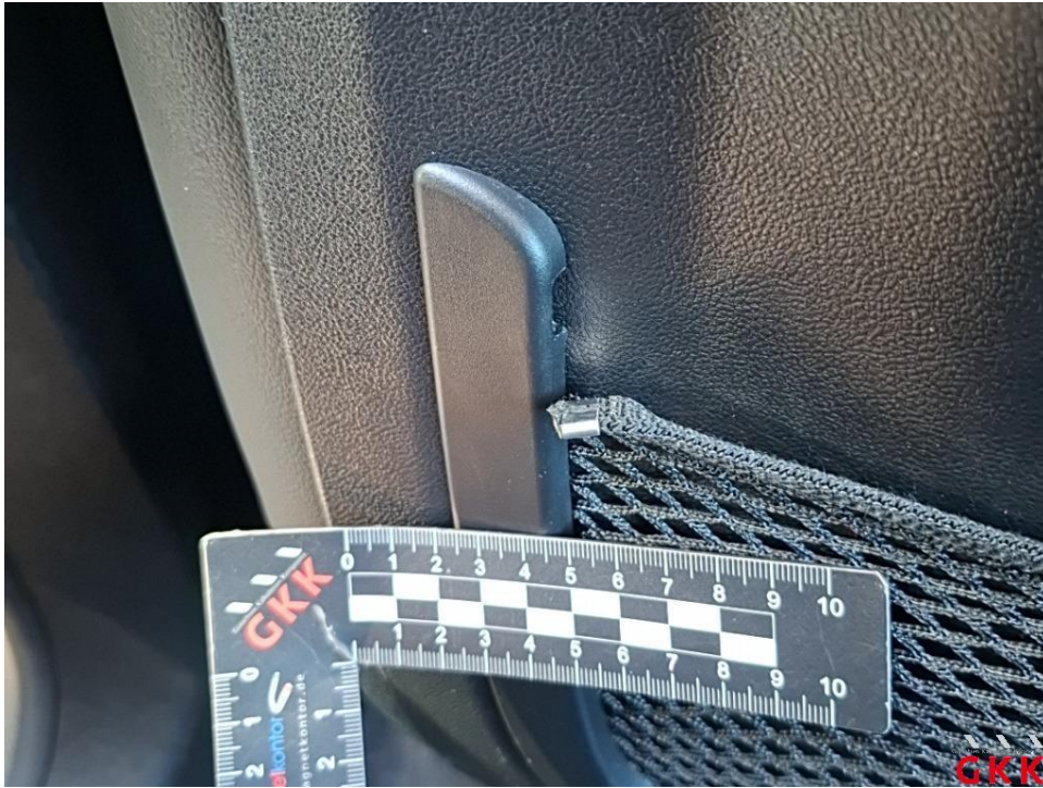
Bild 37. Sitz vorne links, Verkleidung, beschädigt, ersetzen