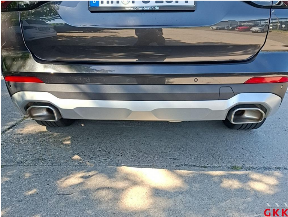
Bild 17. Stoßfänger hinten, Leiste -mittig-, beschädigt, ersetzen