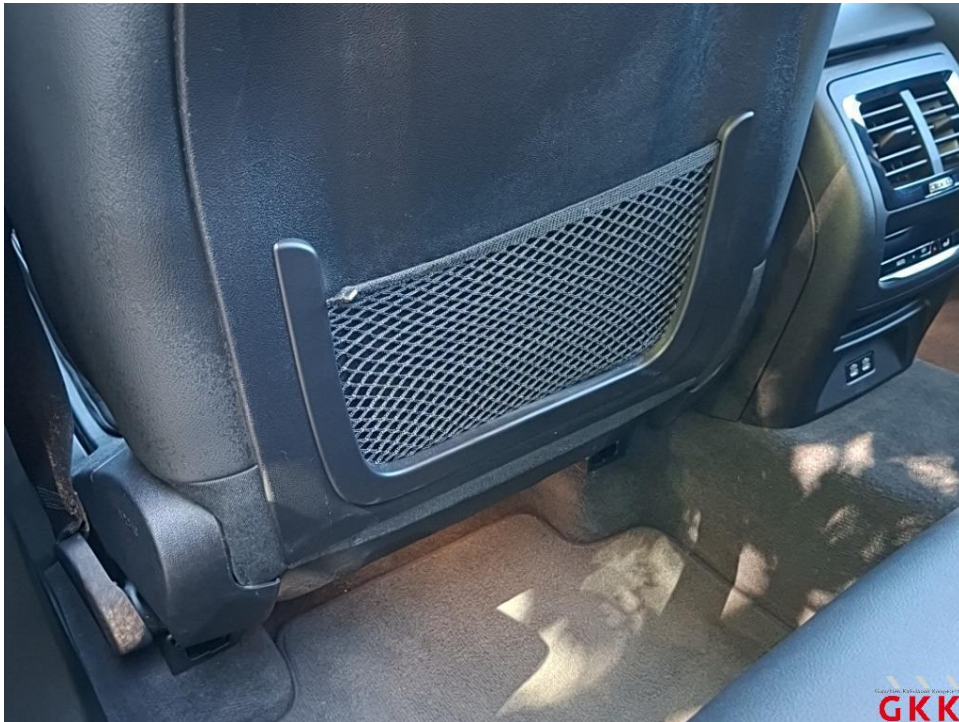
Bild 36. Sitz vorne links, Verkleidung, beschädigt, ersetzen