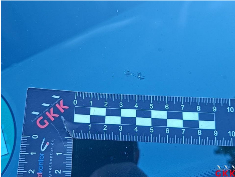
Bild 23. Frontscheibe, mit Regensensor und Frontkamera, Steinschlag mit Rissbildung, ersetzen