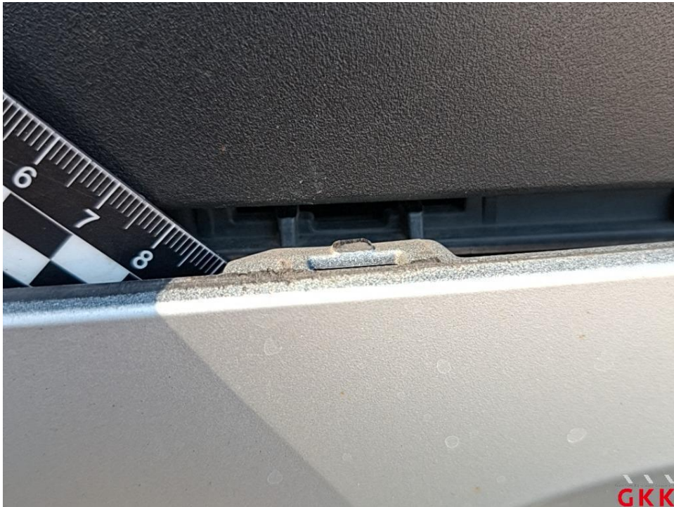
Bild 18. Stoßfänger hinten, Leiste -mittig-, beschädigt, ersetzen