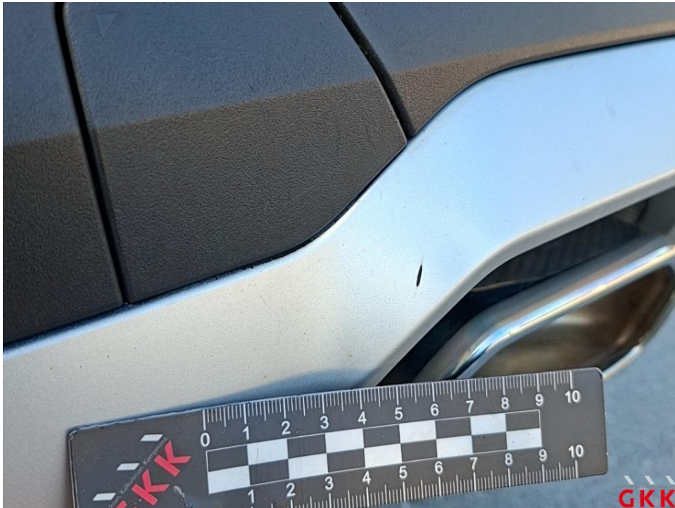
Bild 16. Stoßfänger hinten, Spoiler -lackiert-, beschädigt, ersetzen