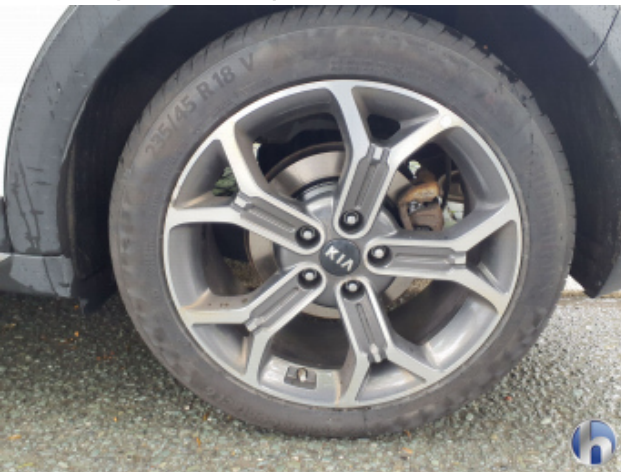
2. Felge Hinten - Links Kratzer - Smart Repair