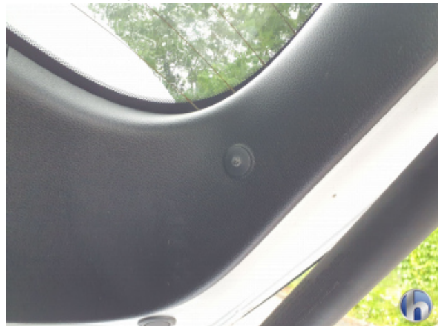
3. Verkleidung Fehlt - Erneuern