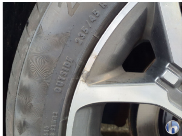
2. Felge Hinten - Links Kratzer - Smart Repair