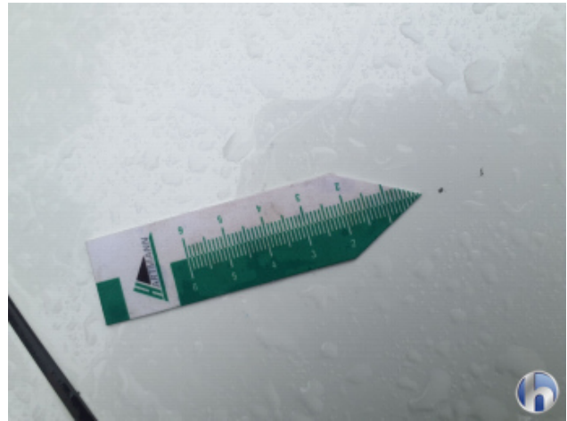
1. Motorhaube Gebrauchsspuren - Ohne Reparatur