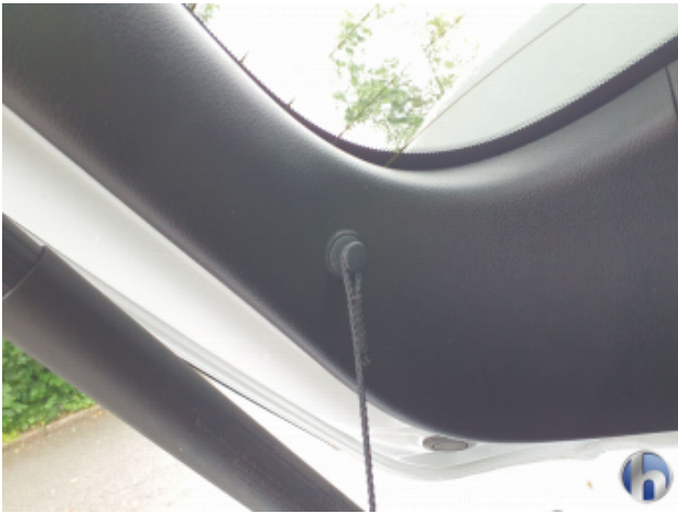
3. Verkleidung Fehlt - Erneuern