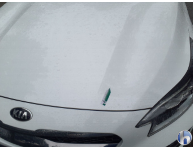
1. Motorhaube Gebrauchsspuren - Ohne Reparatur