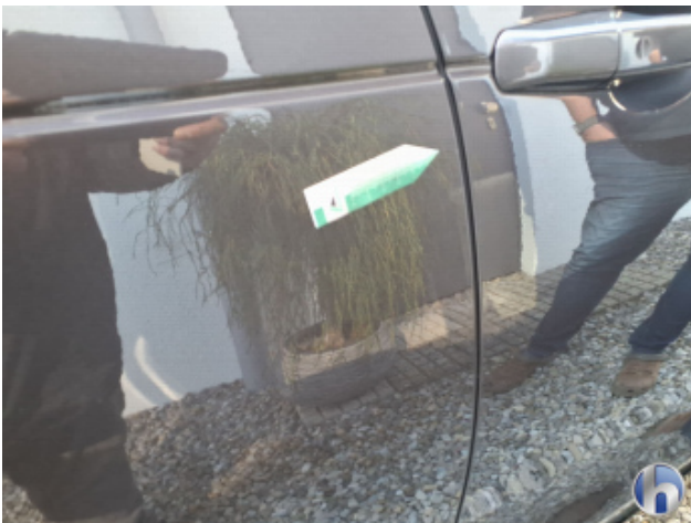
1. Tür Hinten - Rechts Kratzer - Smart Repair