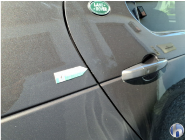
1. Tür Hinten - Rechts Kratzer - Smart Repair