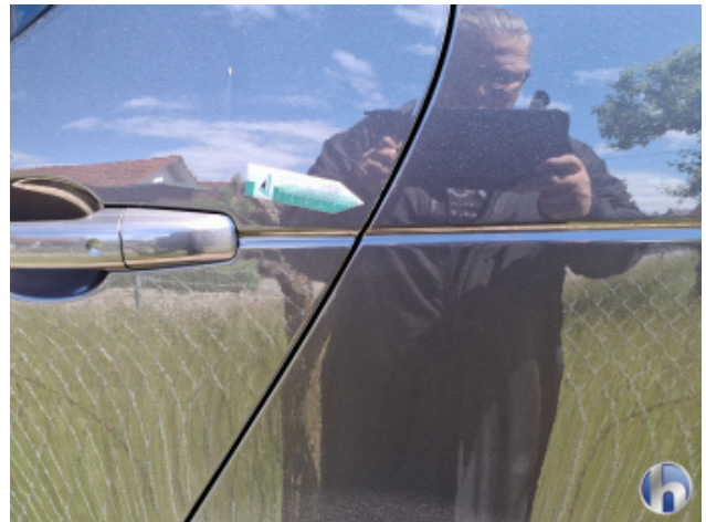
3. Tür Hinten - Links Kratzer - Smart Repair