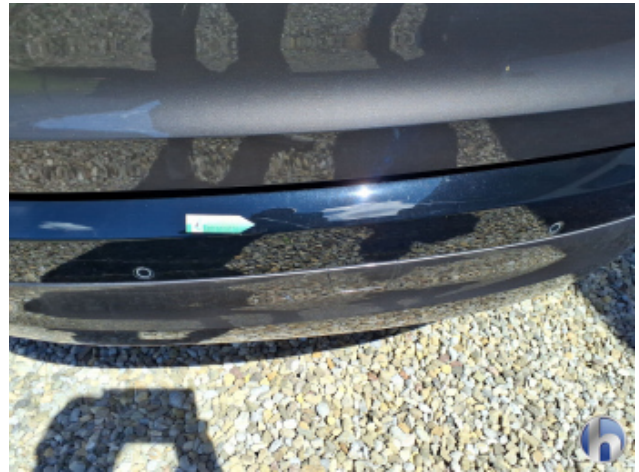
2. Stoßfänger Hinten Kratzer - Smart Repair