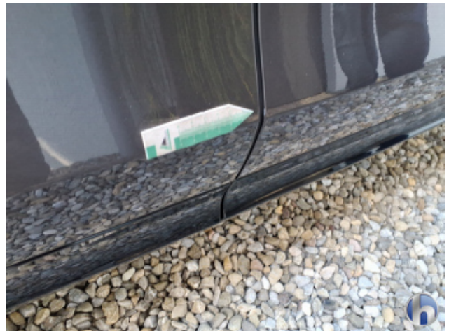
1. Tür Hinten - Rechts Kratzer - Smart Repair