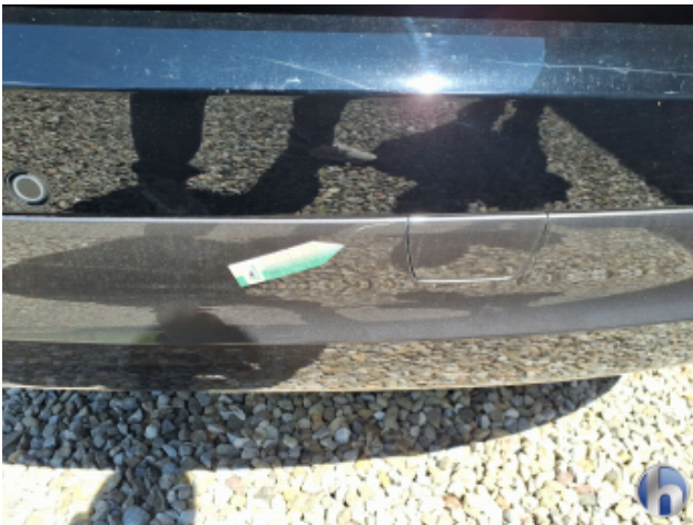
2. Stoßfänger Hinten Kratzer - Smart Repair