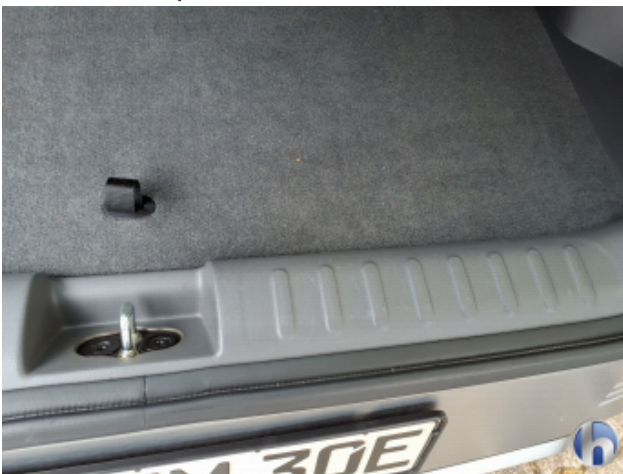
2. Verkleidung Gebrauchsspuren - Ohne Reparatur