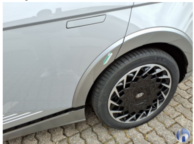
1. Seitenwand - Hinten - Links Kratzer - Smart Repair