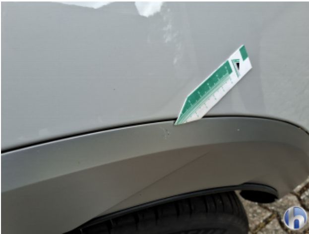
1. Seitenwand - Hinten - Links Kratzer - Smart Repair