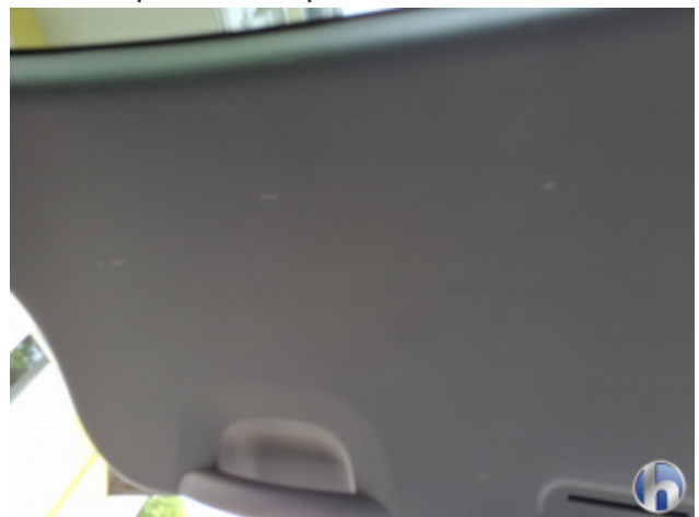
2. Verkleidung Gebrauchsspuren - Ohne Reparatur