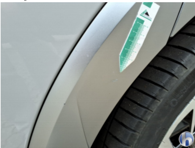
1. Seitenwand - Hinten - Links Kratzer - Smart Repair