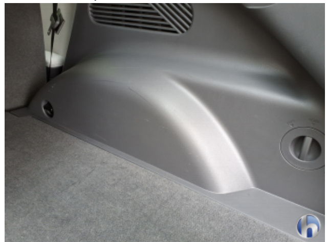
2. Verkleidung Gebrauchsspuren - Ohne Reparatur