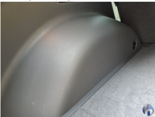
2. Verkleidung Gebrauchsspuren - Ohne Reparatur