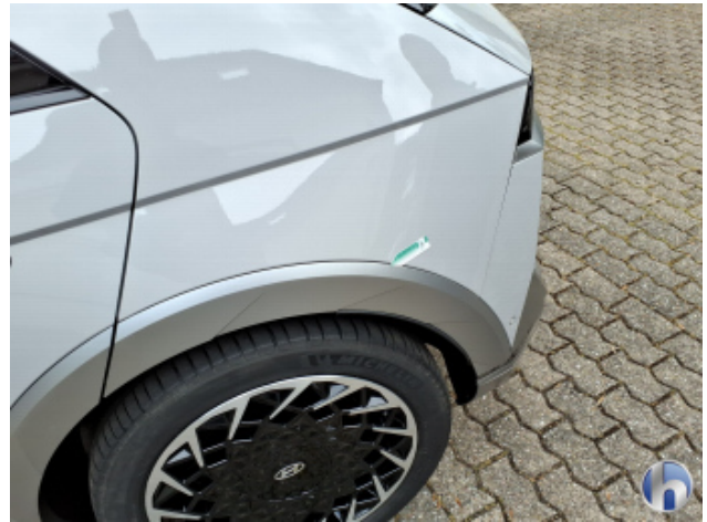
1. Seitenwand - Hinten - Links Kratzer - Smart Repair