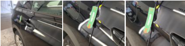
Aile ARD, Bosse(s), PDR - Débosselage ss peinture