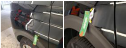
Porte AVD, Bosse(s) et griffe(s), LI - Réparer et peindre (complet)