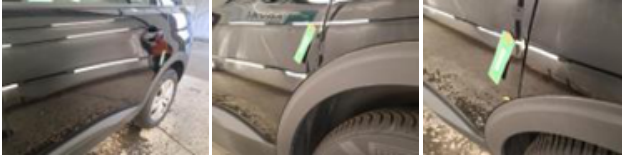
Porte ARD, Bosse(s), LI - Réparer et peindre (complet)