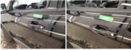
Porte ARG, Bosse(s), LI - Réparer et peindre (complet)