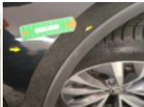
Pare-chocs AR, Griffe(s), Peindre