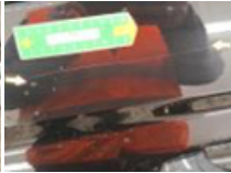
Aile ARG, Bosse(s), LI - Réparer et peindre (complet)