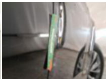
Aile AVD, Griffe(s), Peindre