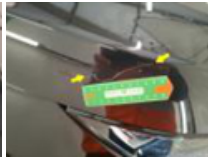
Porte AVD, Bosse(s), PDR - Débosselage ss peinture