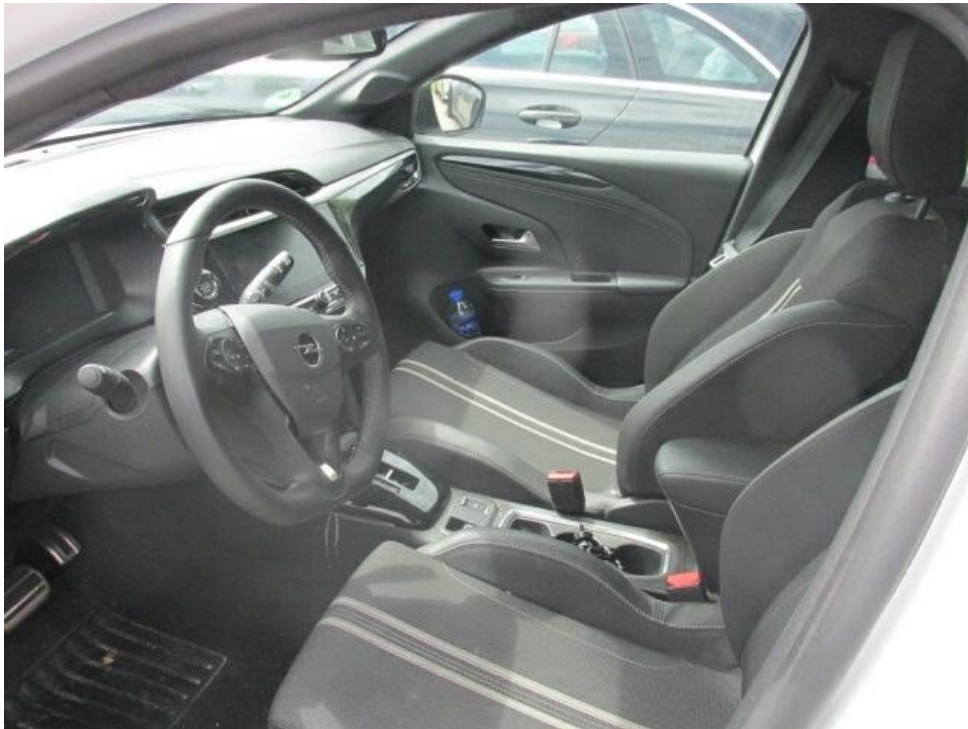
Bild 7 : Durch geöffnete Fahrertüre: Fahrersitz, Armaturenbrett und Schalthebel