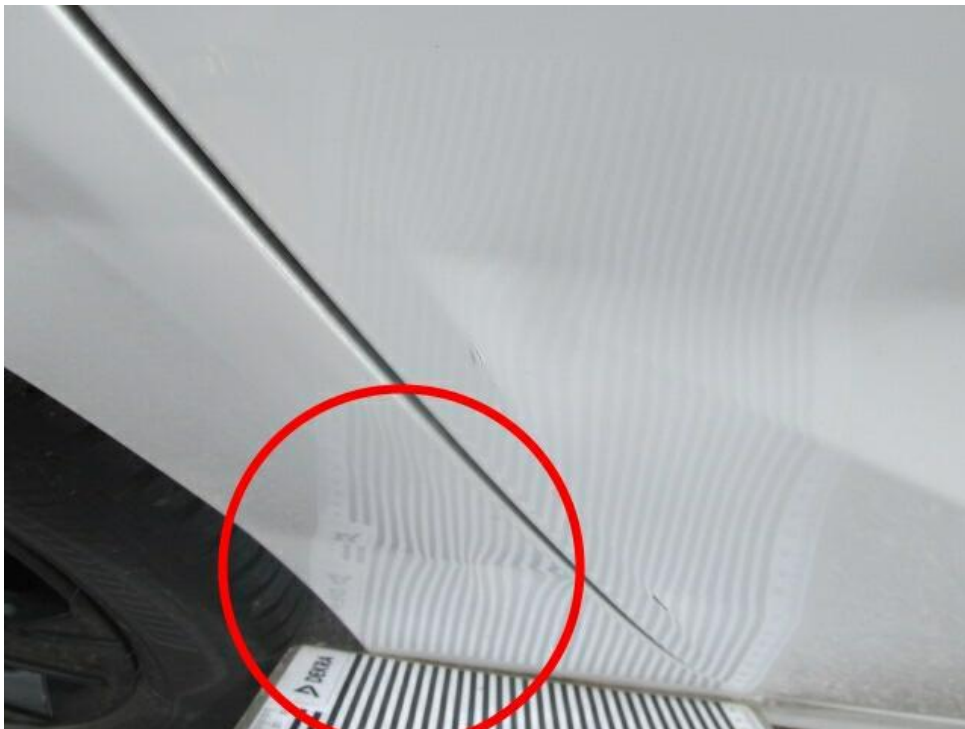
Bild 26 : Seitenwand hinten rechts mehrfach eingedrückt ( Unfallschaden)