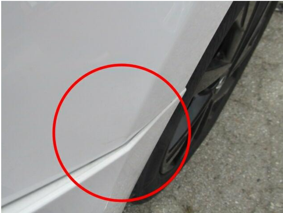
Bild 15 : Stoßfänger vorne bleibend verformt, Kotflügel links verformt