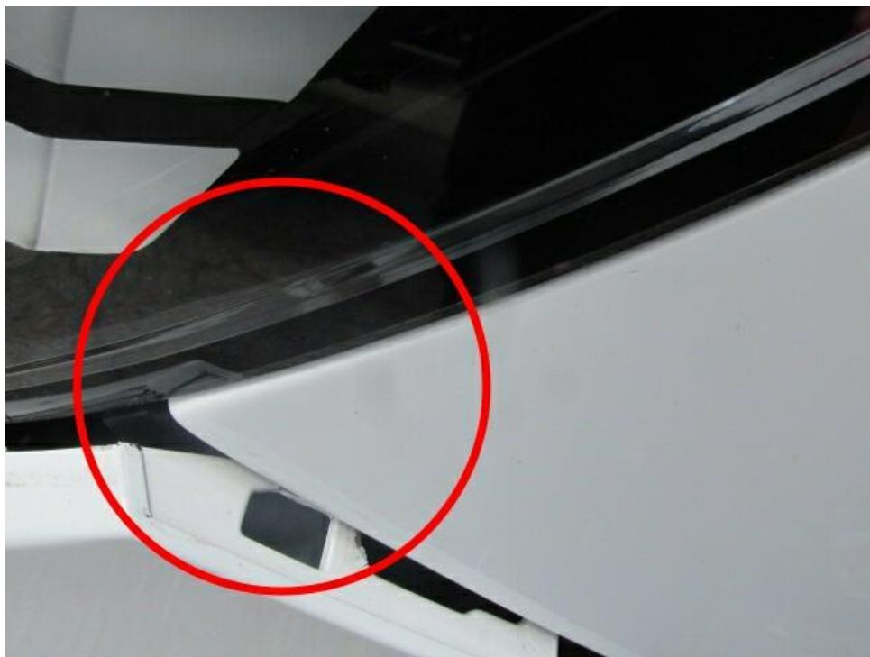
Bild 13 : Stoßfänger vorne bleibend verformt, Kotflügel links verformt