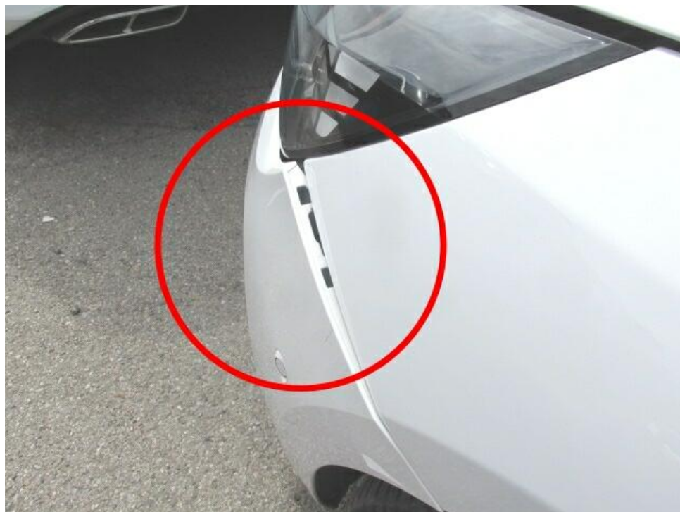
Bild 12 : Stoßfänger vorne bleibend verformt, Kotflügel links verformt