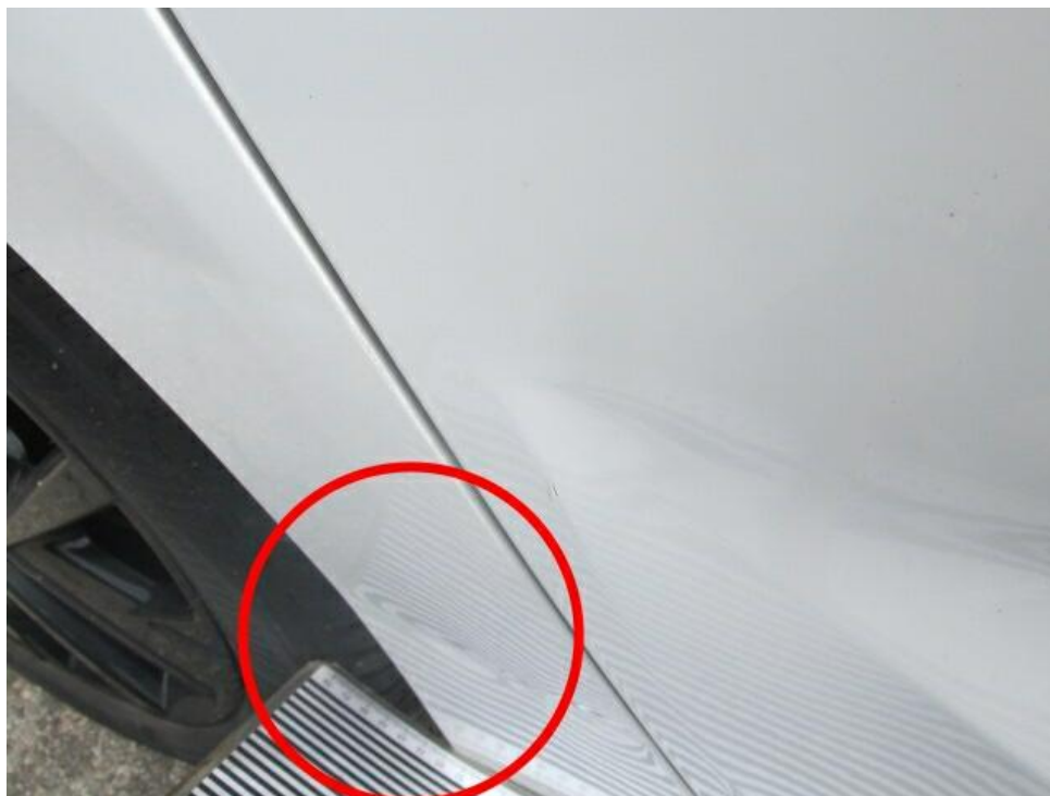
Bild 27 : Seitenwand hinten rechts mehrfach eingedrückt ( Unfallschaden)