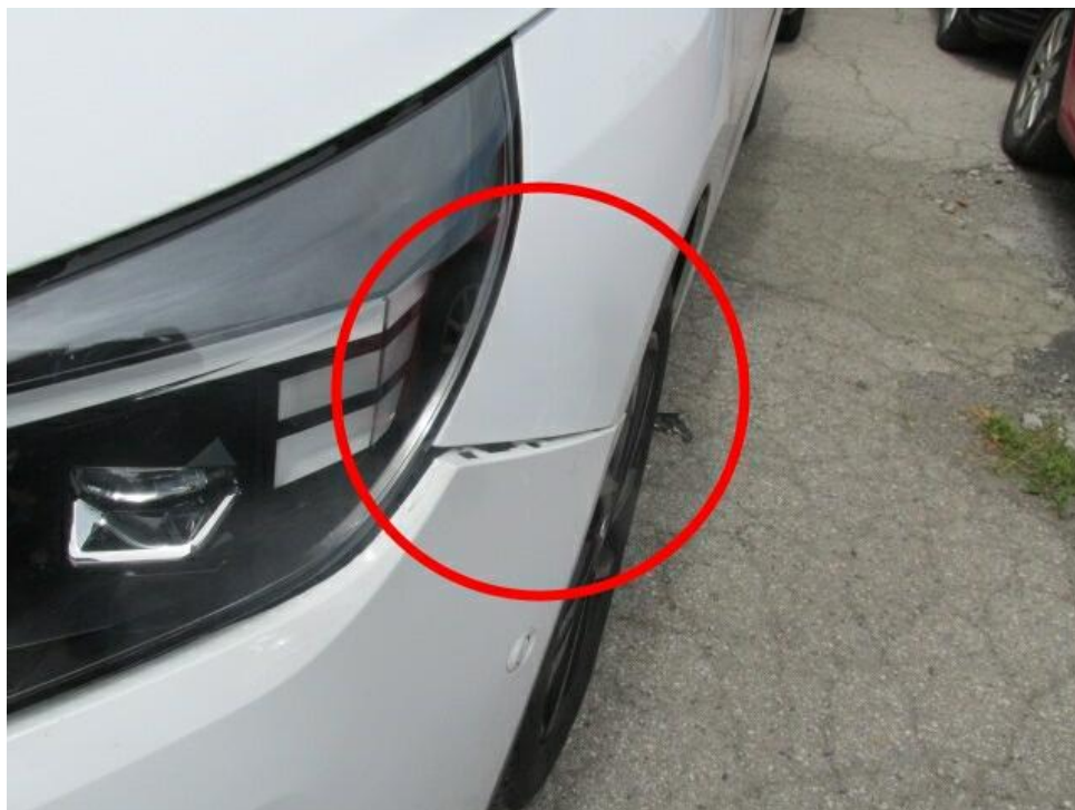
Bild 14 : Stoßfänger vorne bleibend verformt, Kotflügel links verformt