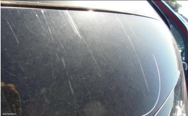
FFLTI_FOTOS FRONTO LATERAL IZQUIERDA