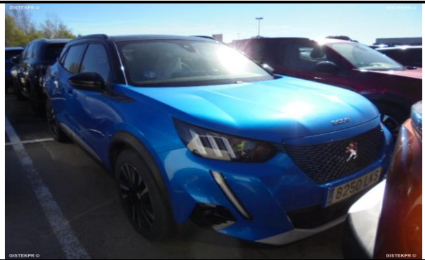
FFLTD_FOTOS FRONTO LATERAL DERECHA