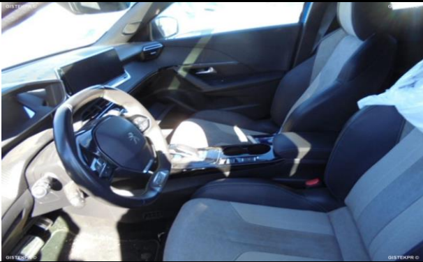
FASDEL_FOTOS ASIENTOS DELANTEROS

INFORME-STELL-RE-BUY- 907-2025__(VR3UKZKXZLJ658503- 8250LKS).DOC