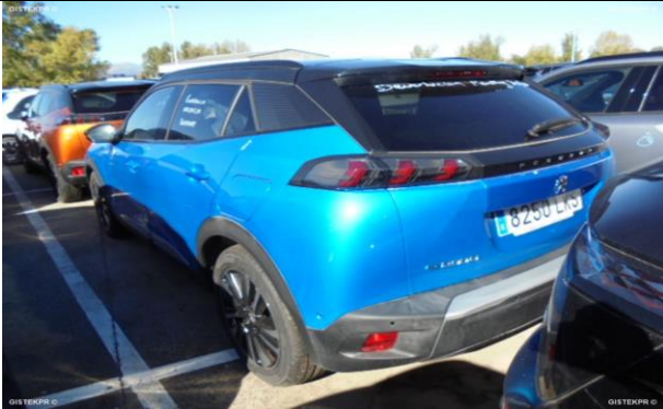
FTLTI_FOTOS TRASERA LATERAL IZQUIERDA