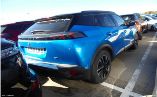
FLTD_FOTOS LATERAL DERECHA

INFORME-STELL-RE-BUY- 907-2025__(VR3UKZKXZLJ658503- 8250LKS).DOC