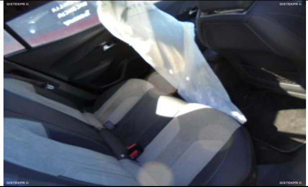
FASTRAS_FOTOS ASIENTOS TRASEROS