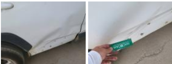
Puerta Delant Dr Abolladuras Reparar + Pintar