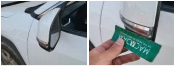
Puerta Delant Iz Rayado Reparar + Pintar