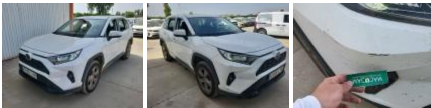
Placa Matrícula Delantera Deformado / Forzados Importe