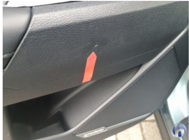
1. Verkleidung Kratzer - Smart Repair