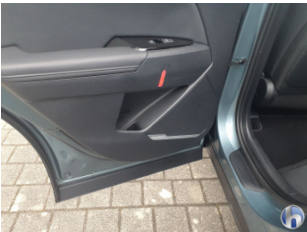
1. Verkleidung Kratzer - Smart Repair