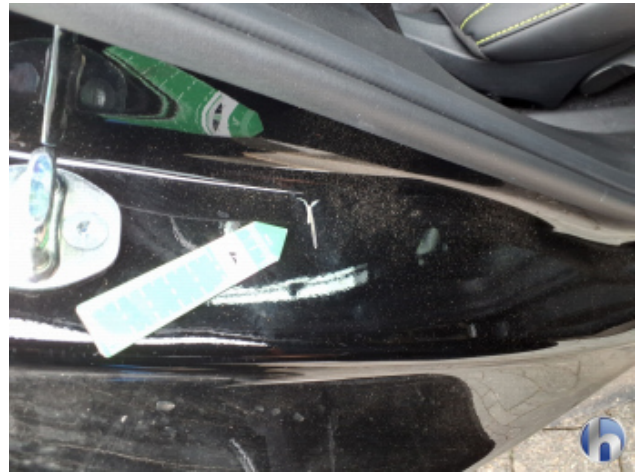
4. Türeinstieg Hinten - Rechts Beschädigt - Smart Repair