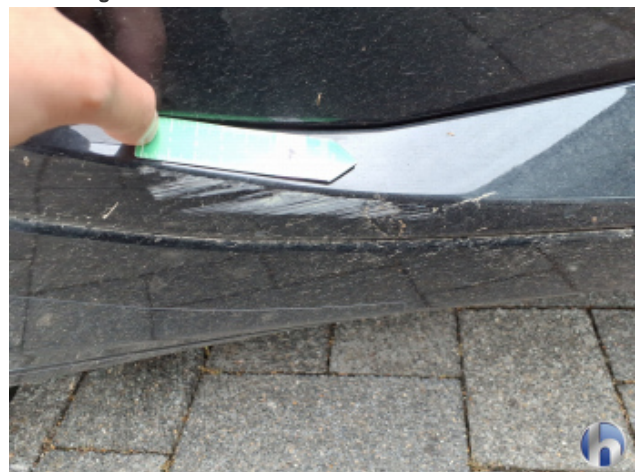
3. Tür Hinten - Rechts Beschädigt - Lackieren