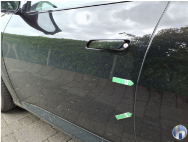
1. Tür Vorne - Links Gebrauchsspuren - Ohne Reparatur