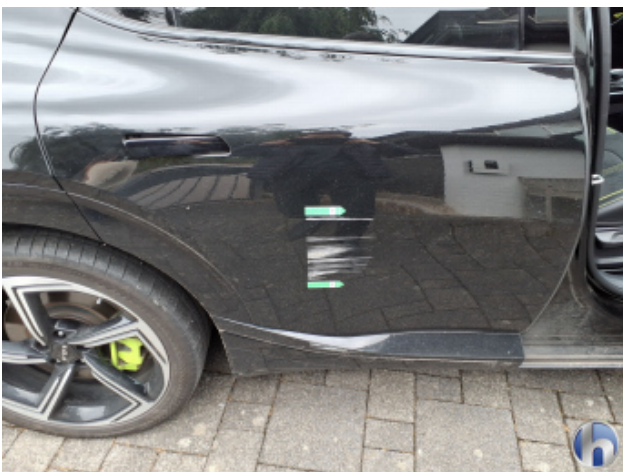
3. Tür Hinten - Rechts Beschädigt - Lackieren