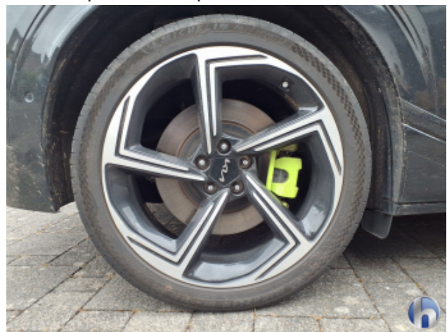
5. Felge Hinten - Rechts Gebrauchsspuren - Ohne Reparatur