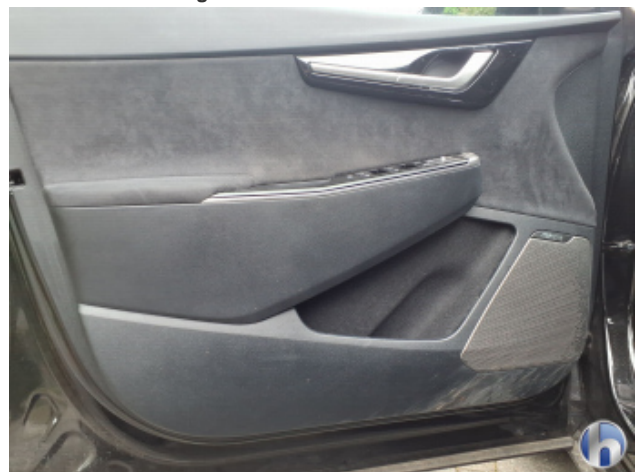
8. Verkleidung Verschmutzt - Reinigen