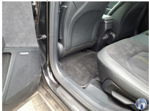
8. Verkleidung Verschmutzt - Reinigen