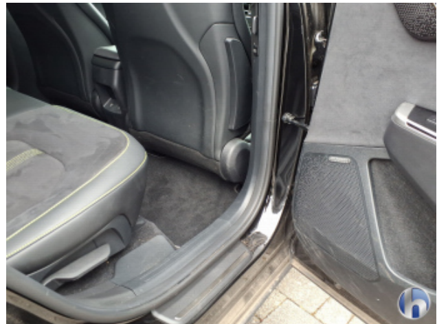
8. Verkleidung Verschmutzt - Reinigen