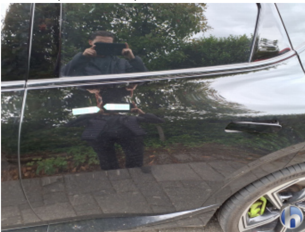
2. Tür Hinten - Links Oberflächenkratzer - Aufbereiten / Polieren