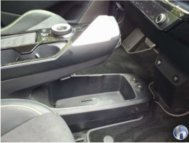
8. Verkleidung Verschmutzt - Reinigen