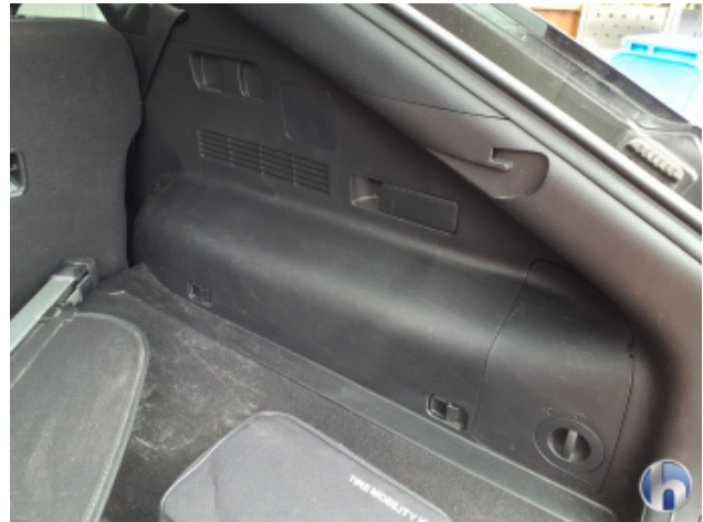
8. Verkleidung Verschmutzt - Reinigen