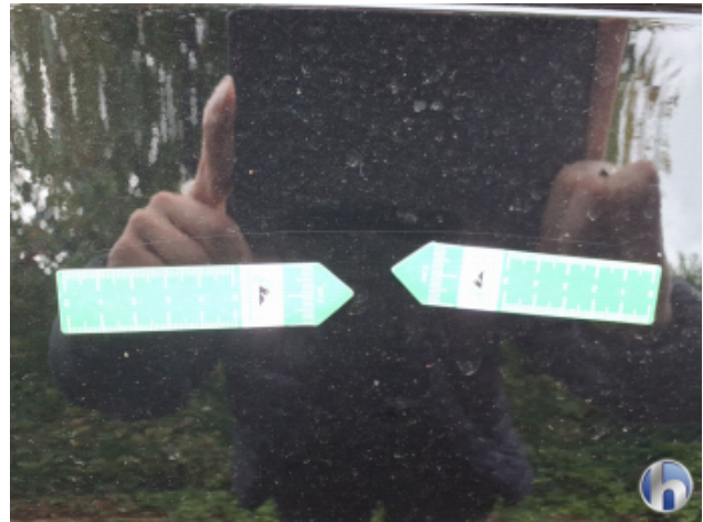
2. Tür Hinten - Links Oberflächenkratzer - Aufbereiten / Polieren