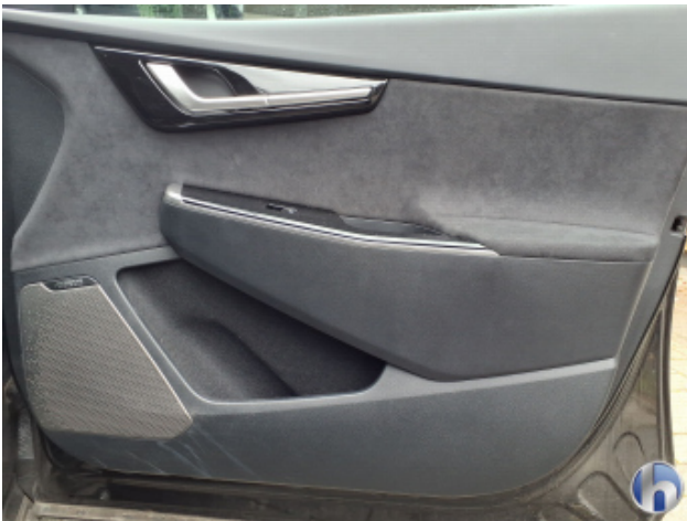
8. Verkleidung Verschmutzt - Reinigen