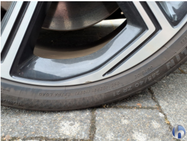
7. Felge Vorne - Rechts Gebrauchsspuren - Ohne Reparatur