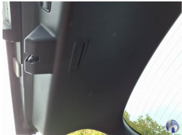
8. Verkleidung Verschmutzt - Reinigen