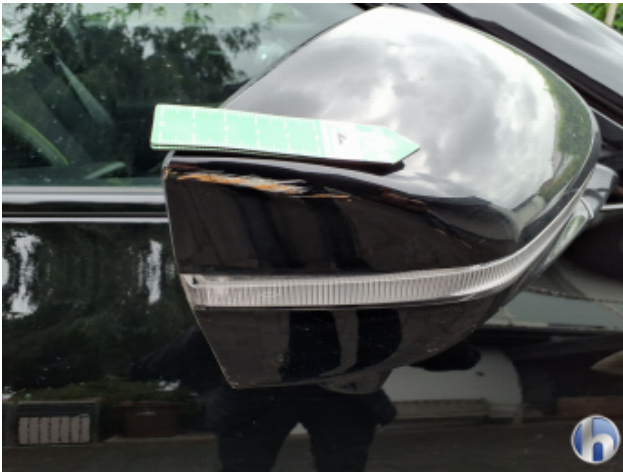
6. Außenspiegel - Rechts Kratzer - Smart Repair