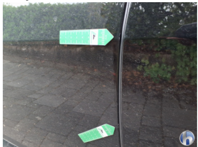
1. Tür Vorne - Links Gebrauchsspuren - Ohne Reparatur