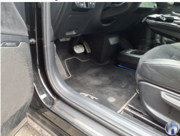
8. Verkleidung Verschmutzt - Reinigen