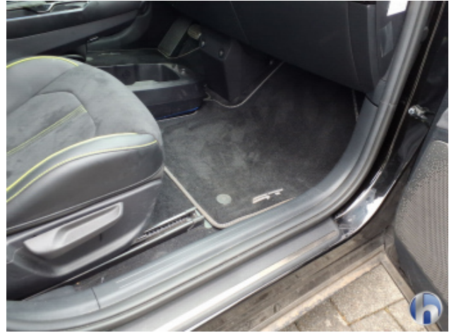
8. Verkleidung Verschmutzt - Reinigen