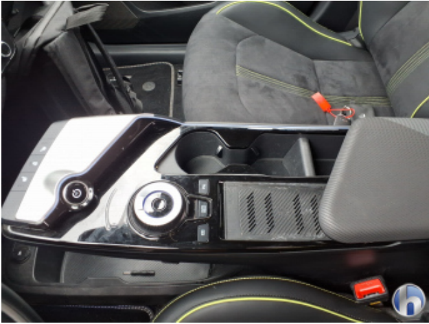
8. Verkleidung Verschmutzt - Reinigen