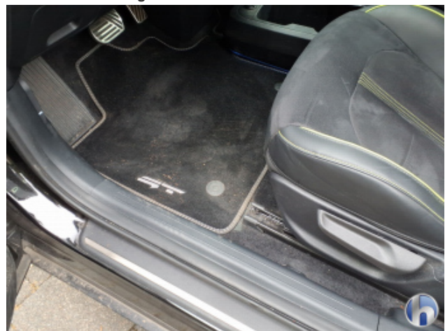
8. Verkleidung Verschmutzt - Reinigen