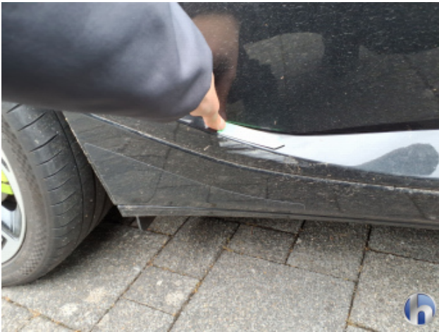
3. Tür Hinten - Rechts Beschädigt - Lackieren