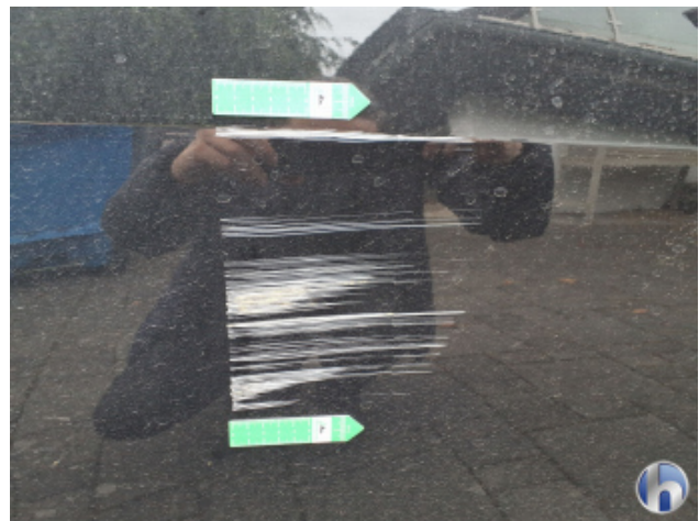
3. Tür Hinten - Rechts Beschädigt - Lackieren