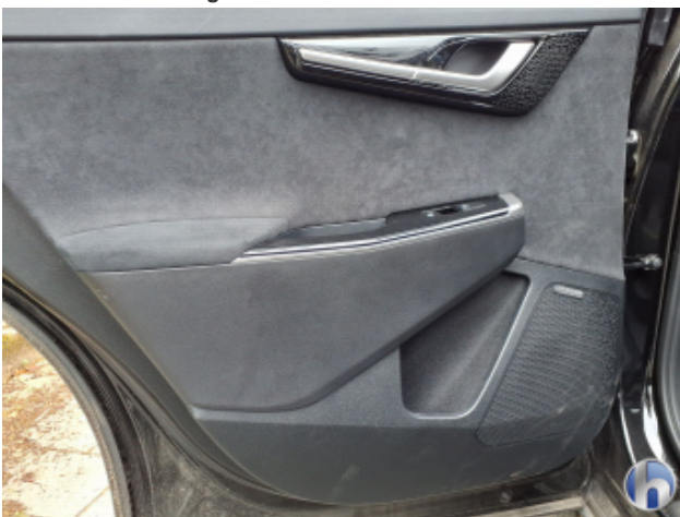
8. Verkleidung Verschmutzt - Reinigen