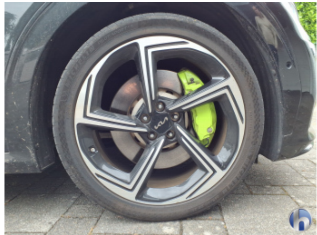
7. Felge Vorne - Rechts Gebrauchsspuren - Ohne Reparatur