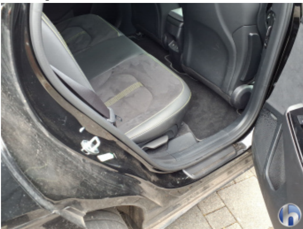
4. Türeinstieg Hinten - Rechts Beschädigt - Smart Repair