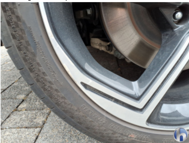
5. Felge Hinten - Rechts Gebrauchsspuren - Ohne Reparatur