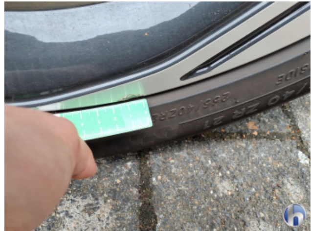
7. Felge Vorne - Rechts Gebrauchsspuren - Ohne Reparatur