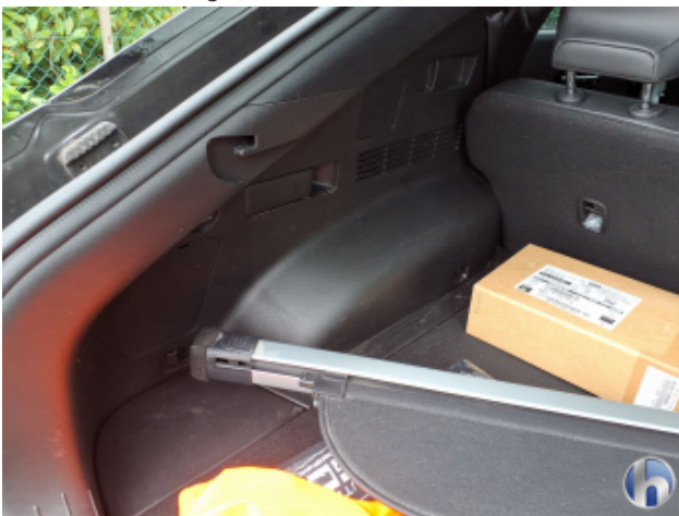
8. Verkleidung Verschmutzt - Reinigen