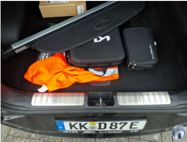
8. Verkleidung Verschmutzt - Reinigen