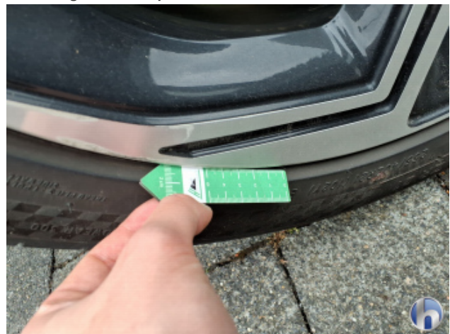
5. Felge Hinten - Rechts Gebrauchsspuren - Ohne Reparatur