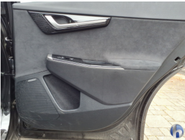
8. Verkleidung Verschmutzt - Reinigen