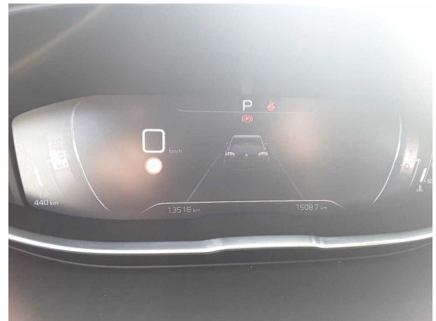
Abbildung 10: Kombiinstrument