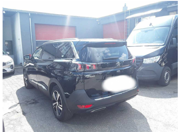
Abbildung 4: Schräg hinten