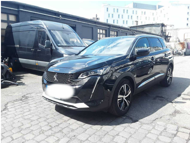
Abbildung 3: Schräg vorne