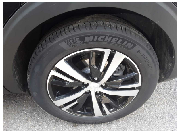
Abbildung 6: Montierte Bereifung