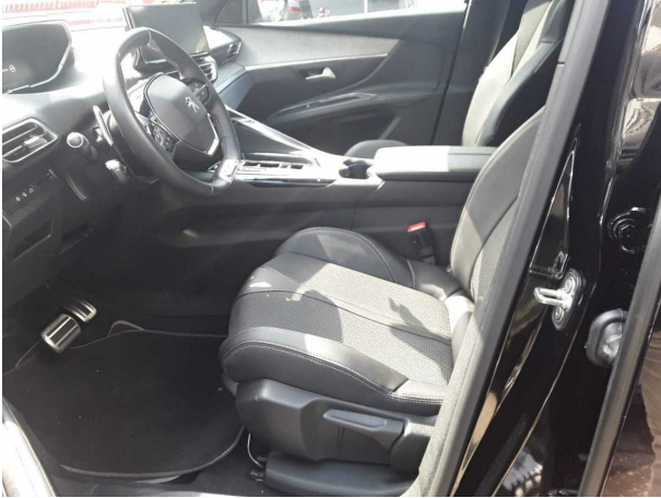
Abbildung 7: Innenraum vorne