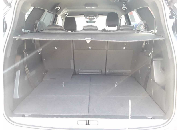
Abbildung 8: Laderaum