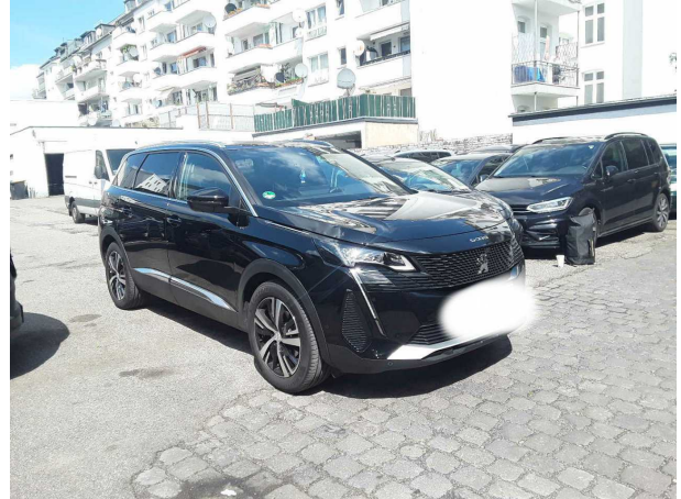
Abbildung 2: Schräg vorne