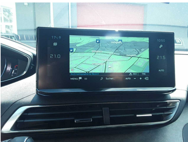
Abbildung 11: Instrumententafel