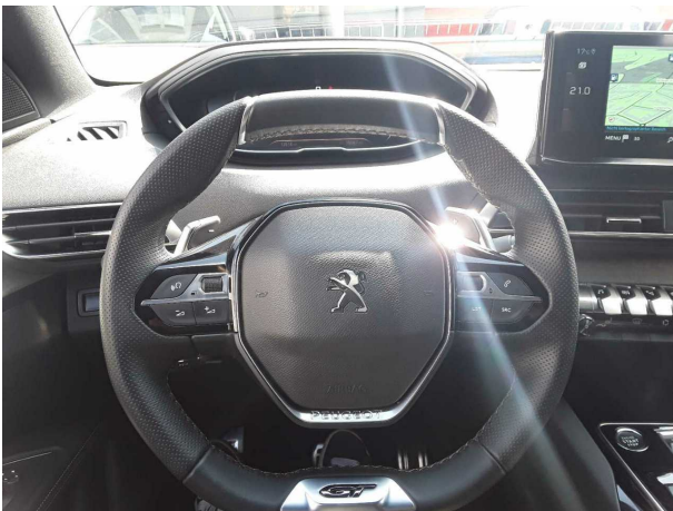
Abbildung 9: Kombiinstrument