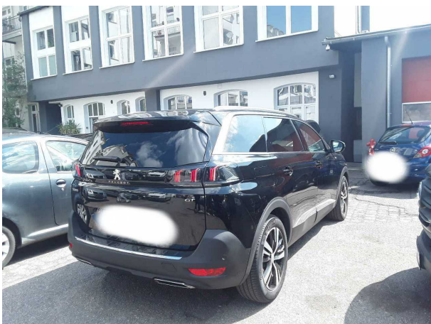
Abbildung 5: Schräg hinten