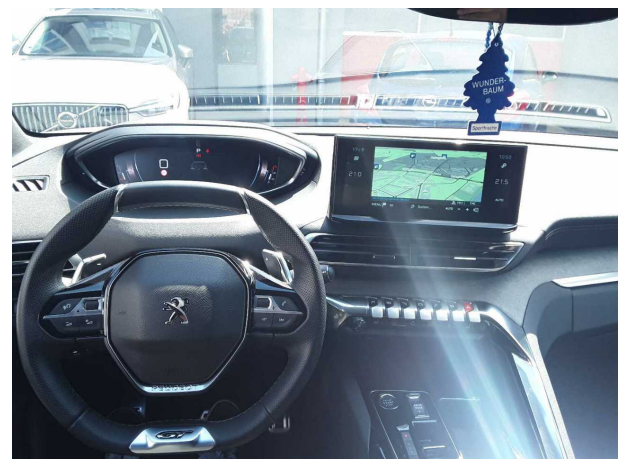
Abbildung 12: Instrumententafel