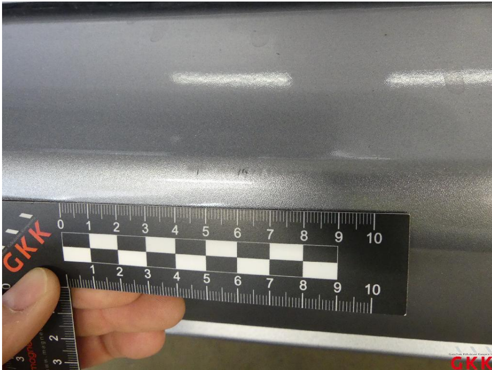
Bild 15 Stoßfänger hinten, Verkleidung -lackiert-, verkratzt, lackieren