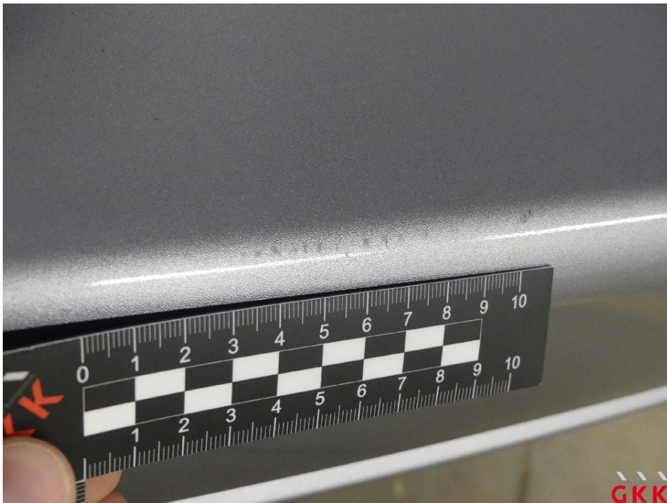
Bild 16 Stoßfänger hinten, Verkleidung -lackiert-, verkratzt, lackieren