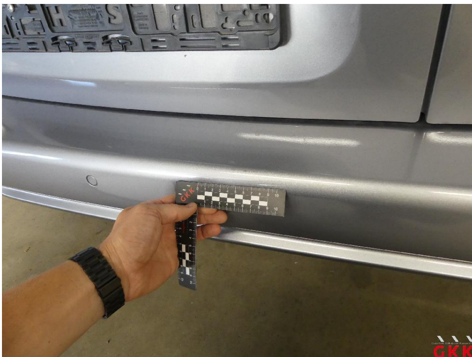
Bild 14 Stoßfänger hinten, Verkleidung -lackiert-, verkratzt, lackieren