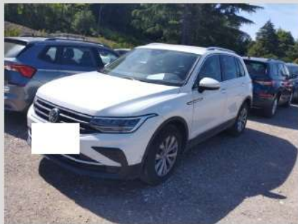
Anteriore sinistra 3/4