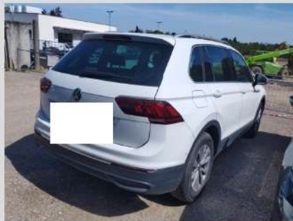
Posteriore destra 3/4