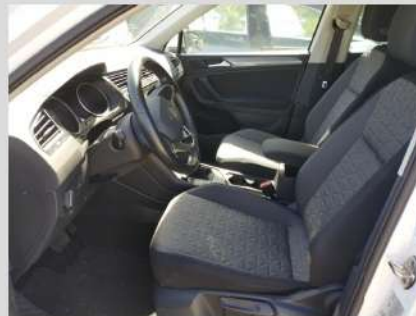
Interni lato guida