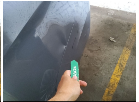
Paragolpes / Trasero / Ralladura