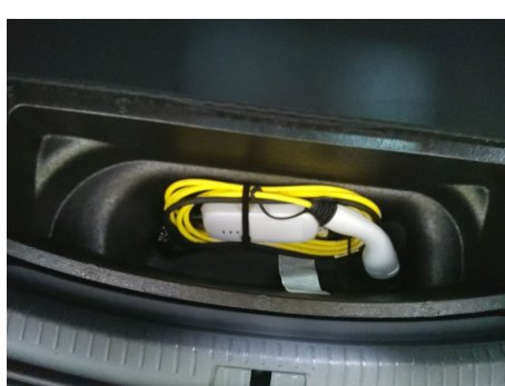
Cable de carga rápida / - / Faltante