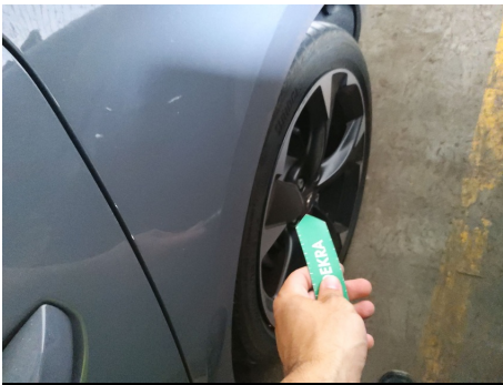
Llanta / Trasero izquierdo / Ralladura