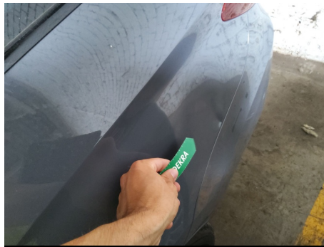
Aleta / Trasero izquierdo / Impacto