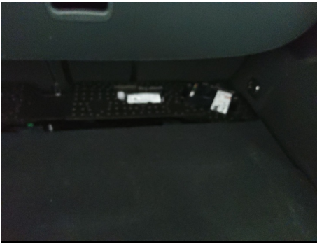
Elementos faltantes / Kit de reparación de neumáticos compresor